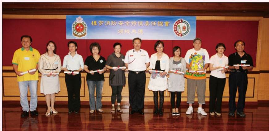
樓宇消防安全特使接受委任證書

如樓宇消防安全特使曾接受並完成消防安全大使訓練課程，可直接參與進階訓練課程及實習課程。