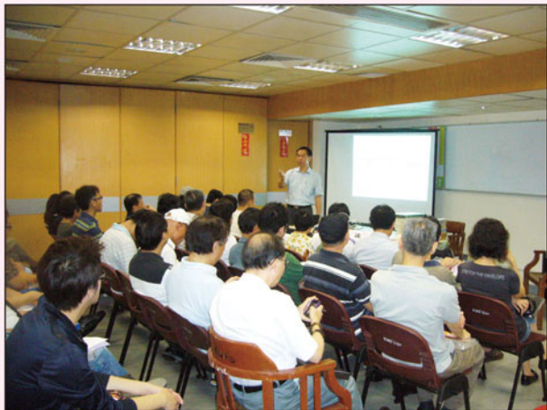
參加者正接受特使訓練課程