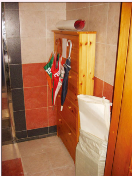
舉報於逃生通道擺放雜物