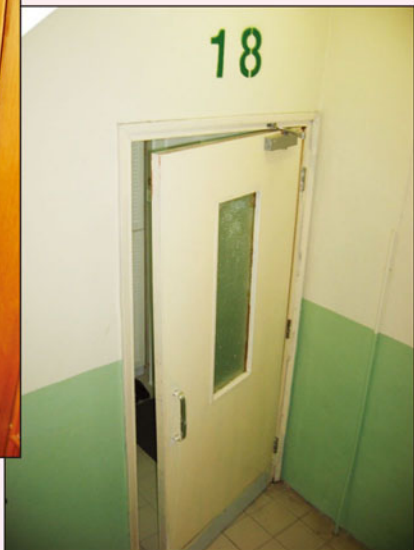
舉報損壞的防煙門