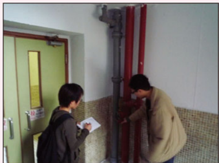
留意樓宇的消防裝置及設備 時刻保持有效操作