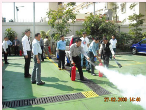
協助籌辦防火演習及 防火宣傳活動