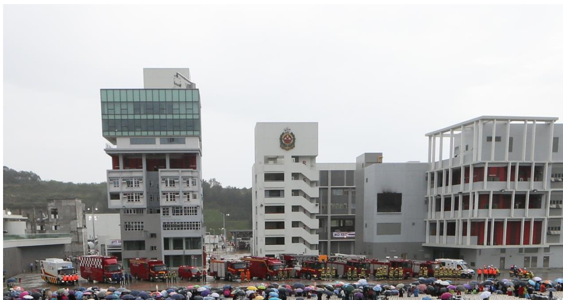
消防及救護學院今日（四月十日）舉行開放日。豐富的示範項目包括消防及救護車輛巡遊。