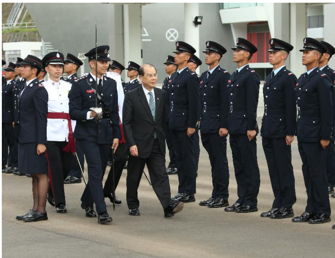
政務司司長張建宗今日（五月十二日）在消防及救護學院檢閱第 178 屆結業學員。