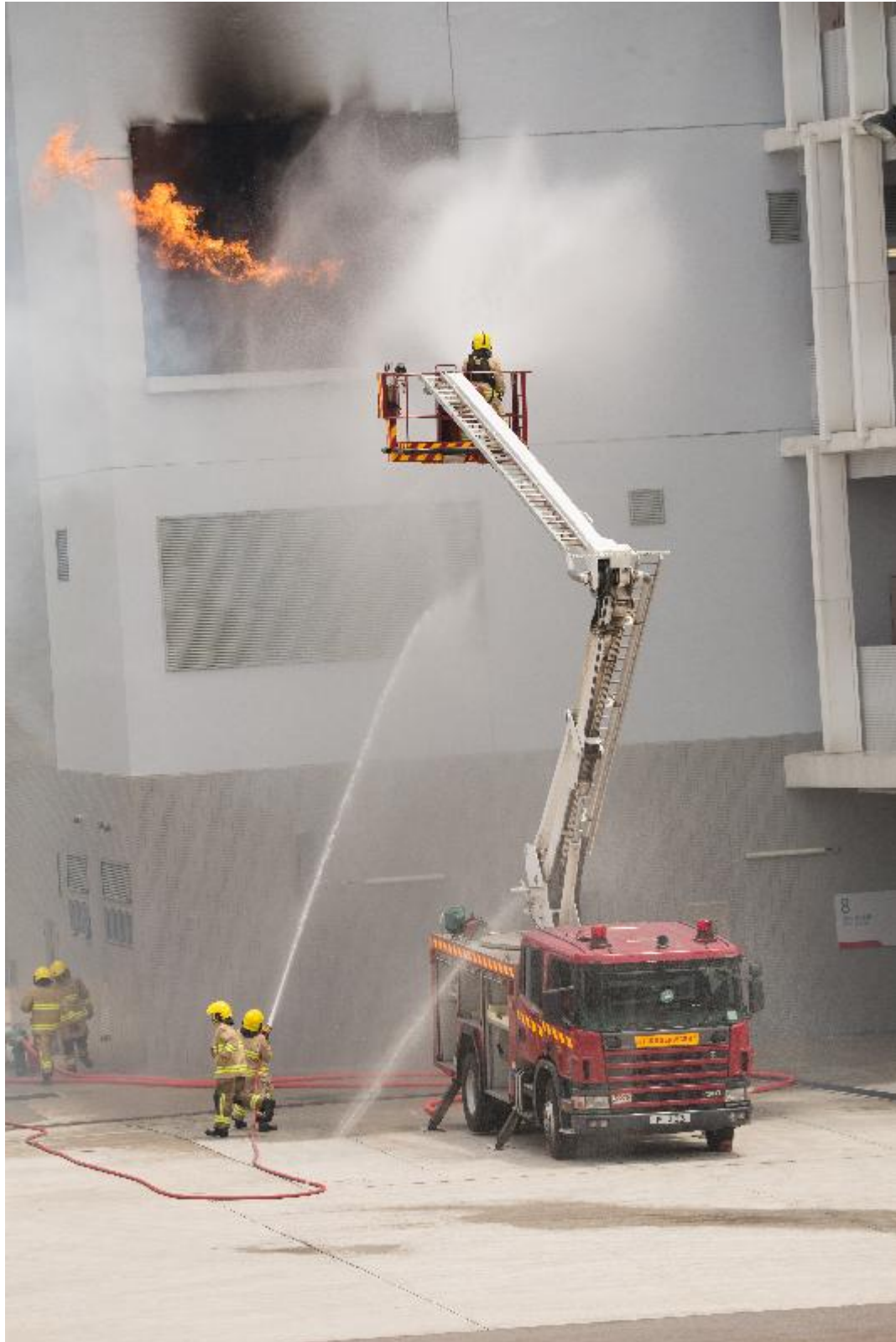
政務司司長張建宗今日(五月十二日)在消防及救護學院檢閱第178屆結業學員。圖示結業學員示範撲滅火警及救傷工作。