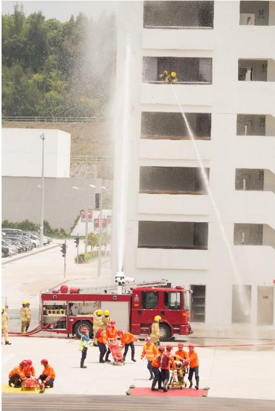
政務司司長張建宗今日(五月十二日)在消防及救護學院檢閱第178屆結業學員。圖示結業學員示範撲滅火警及救傷工作。