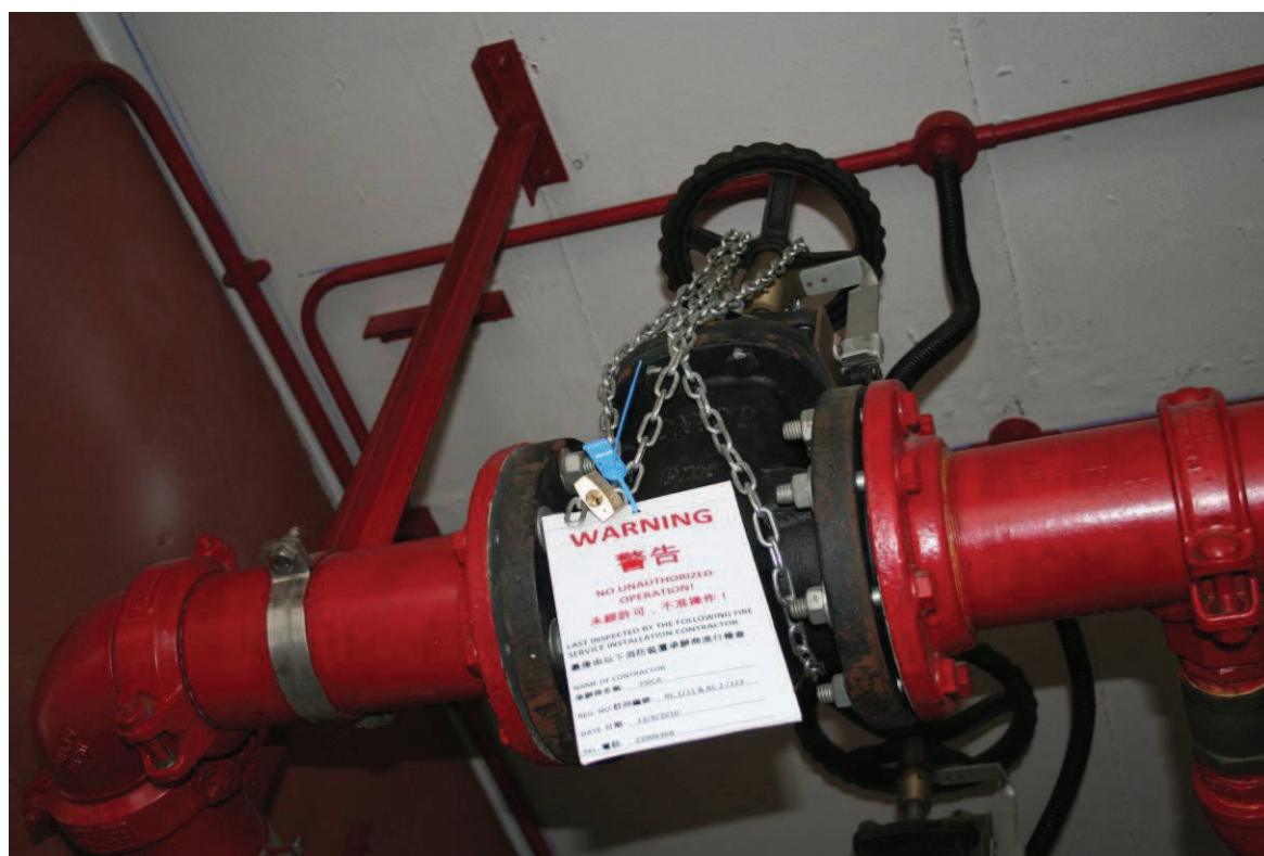
常用的花灑分層閘掣繫穩方法