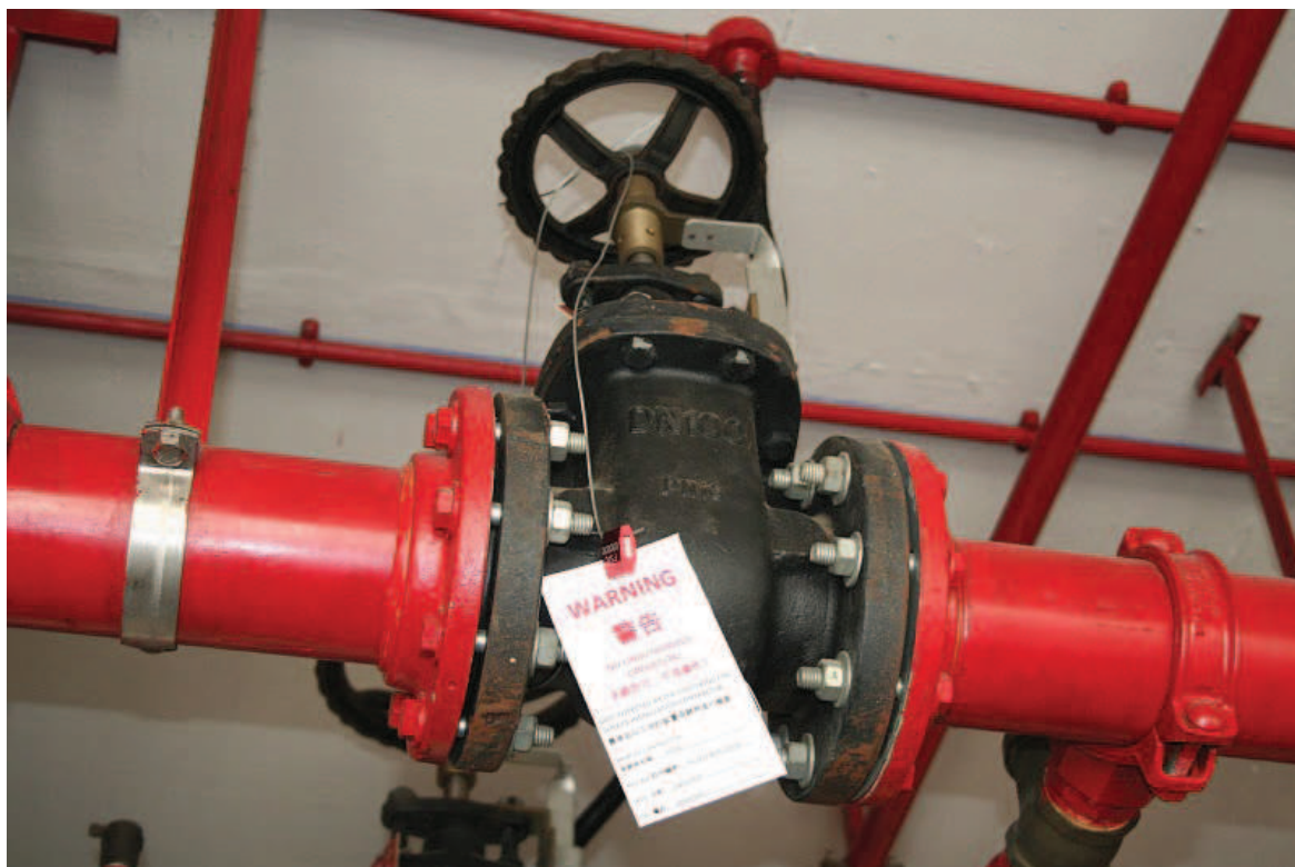
常用的花灑分層閘掣繫穩方法