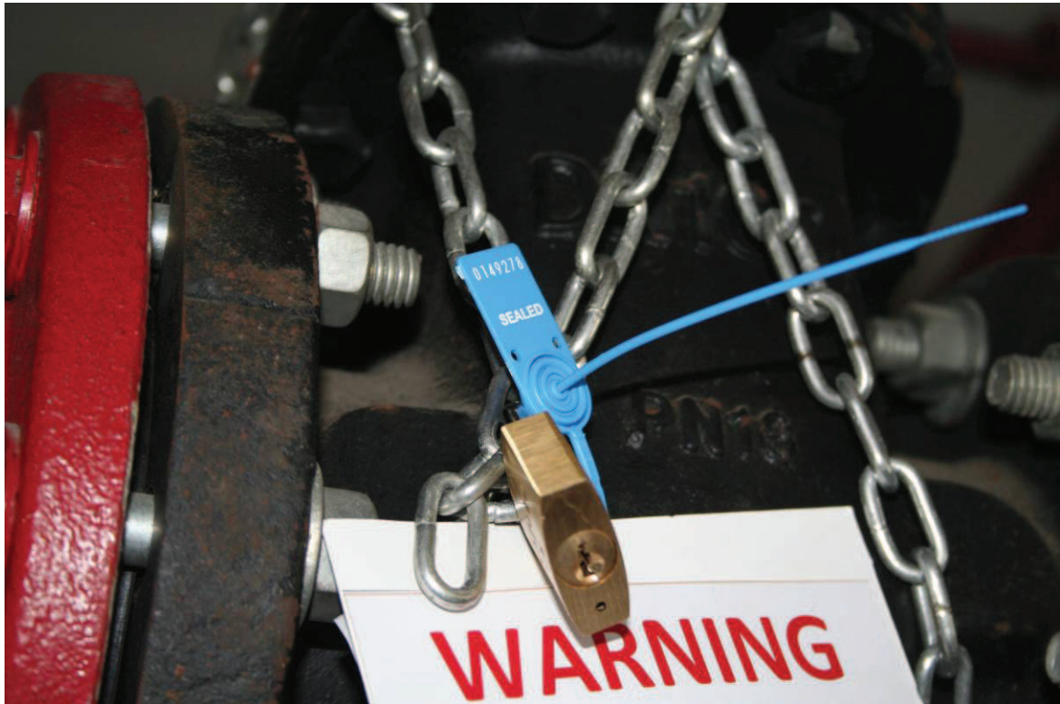
防干擾保險牌子樣本