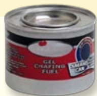
盛載啫哩狀燃料的 無縫容器/爐具樣本