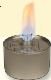
附有燈芯的二甘醇 diethylene glycol 液體燃料容器/爐具樣本