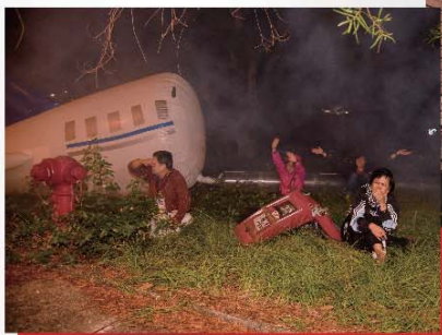
■ 多名傷者等待救援。