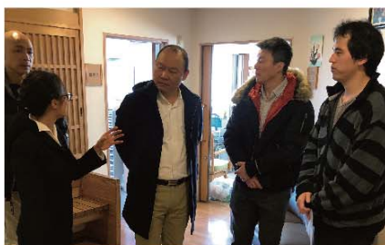
■ 代表團參觀東京一所安老院舍，聽取職員簡介院舍內的消防安全設備。

代表團拜訪了東京消防廳總務部及池袋消防署預防課，聽取消防官員講解當地安老院舍的牌照申請流程、消防設備要求及消防安全巡查事宜。代表團亦參觀了數所不同類型的安老院舍，進一步了解相關的消防安全規管。兩地消防人員亦藉此交流，加強彼此聯繫。