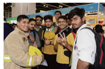
■ 向少數族裔人士介紹消防處工作。