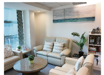
■ 心理服務組的「分享空間」