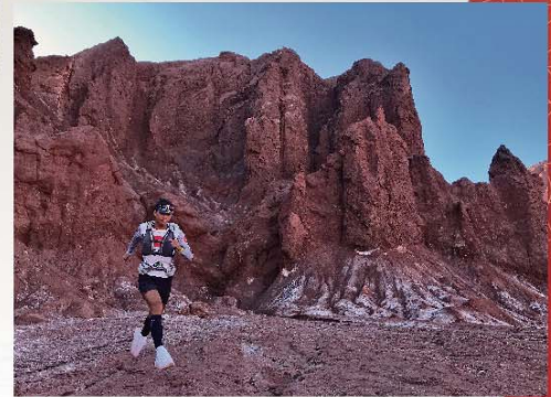
■ 智利亞他加馬沙漠