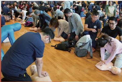
■ 參與教育講座的市民練習如何施行心肺復甦法。

社區應急準備課未來會繼續向不同社會群體推廣心肺復甦法及自動心臟除顫器，並與不同機構合作，務求以多角度、多平台及多元化的公眾教育，將相關知識普及化，令每一個市民明白「『敢』就救到人」。