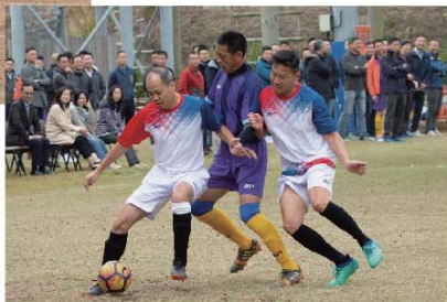
■ 「鄉紳派」與「精英龍」在高級長官組比賽打成3:3平手。