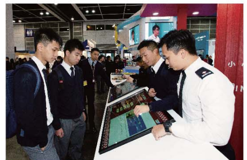
■ 參觀者透過大型觸控屏幕瀏覽欲投考職位的資訊。