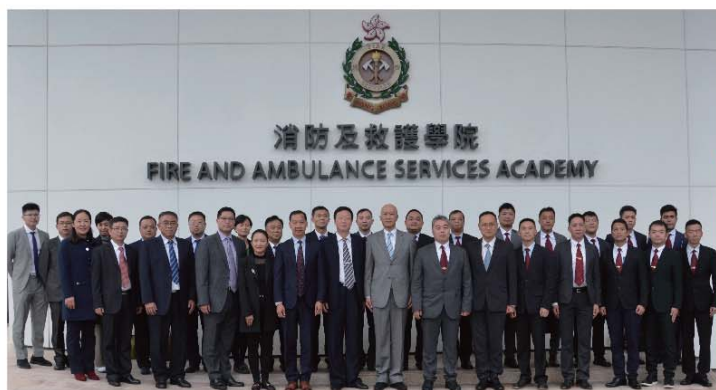
■ 三地消防及救護人員在消防及救護學院合照。