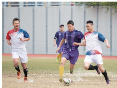
■ 「精英龍」(白衫)在精英組比賽勝出。