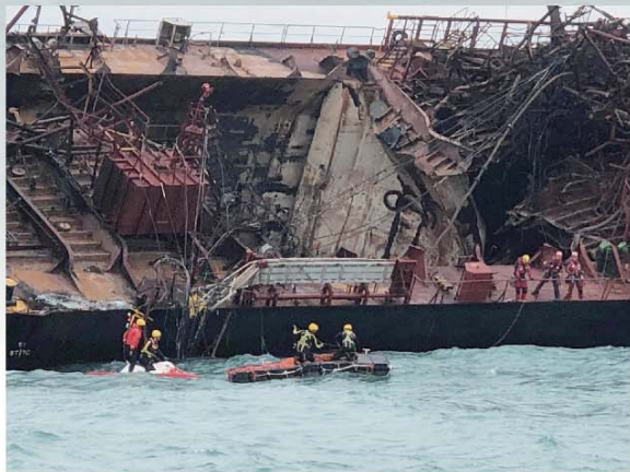
■ 高空拯救專隊用繩索協助潛水員登上嚴重傾側及甲板跳滑的運油輪。

行動中，HART利用專業知識及經驗，協助潛水員克服種種障礙，讓他們能夠安全及專心地應付水下的搜救工作，盡展專業所長及無畏無懼的精神。過去十年，部門增設多支專業化的隊伍，配備更精良的裝備，以豐富的經驗及熟練的技巧，在不同的行動中為前線同事提供意見和協助，提升救援效率和水平，為全港市民服務。