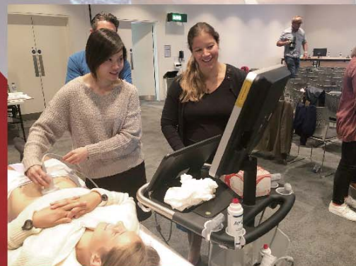
■ 手提超聲波儀器能透過影像，協助前線人員更準確和快捷地診斷傷病者。