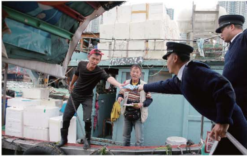
■ 本處人員向漁民派發防火宣傳單張。

港島南區的大型防火教育活動「海陸防火巡遊」早前於鴨洲舉行，活動包括在香港仔避風塘向船上漁民及區內居民廣播防火信息、派發宣傳單張及進行防火安全講座。大會亦安排消防安全教育巴士到鴨洲風之塔公園附近宣傳，並設吹氣迷宮和宣傳展板等，吸引區內居民參與。