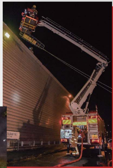
■ 消防人員模擬滅火救援工作。

過程中，各人員均秉承專業和認真的態度，在短時間內完成滅火及救援工作，展現出日常訓練的成果。演習後，參與單位針對各項安排及細節作全面的檢討，以提升人員對飛機事故的行動效率及優化調派部署。