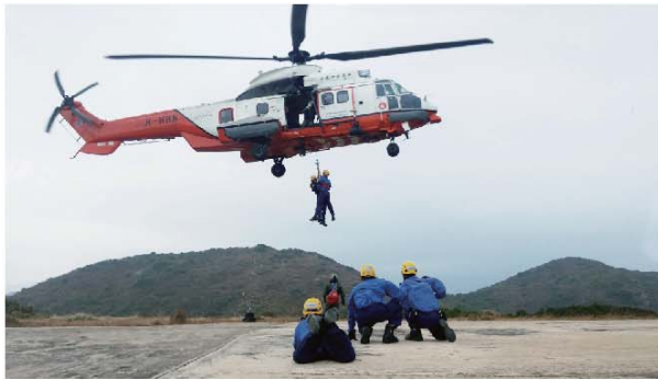
■ 攀山拯救專隊成員在飛行服務隊的協助下進行吊運訓練。

為加強繩索管理及熟習各山嶺的行山路徑，攀山拯救專隊成員每個月均會參與持續訓練，當中包括不少行山人士愛挑戰的鳳凰山。我們帶同拯救裝備，沿西狗牙登上山頂，並設扶手繩走過非常崎嶇的「一線生機」。每次訓練後縱然筋疲力盡，但想到能鍛鍊出更好的體能和信心應付未來的拯救的挑戰，便感到付出的汗水沒有白費。