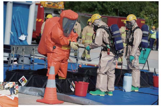
■ 危害物質專隊成員進行洗消工作。