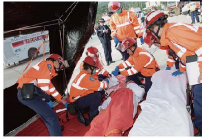
■ 救護人員模擬急救傷者。