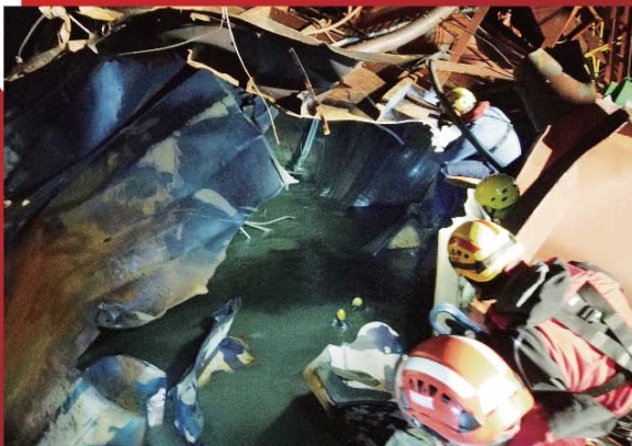
■ 搜救人員在滿佈油污的船艙通宵搜索失蹤者。