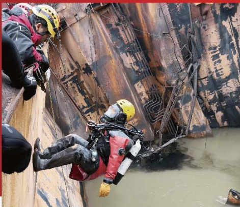
■ 高空拯救專隊架設錨固點及放出救生繩，助潛水員進入十米深的船艙搜索。