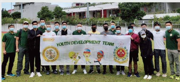
● 「少數族裔青年發展團隊」透過舉辦工作坊，鼓勵非華裔青年投身消防處。