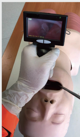
● 視像窺喉鏡能讓救護人員清晰檢視病人的氣道狀況。

有別於一般即棄式直接窺喉鏡 (direct laryngoscope)，視像窺喉鏡具備攝錄鏡頭及全彩螢幕，能讓救護人員清晰地檢視病人的氣道狀況；新訓練模型能提升救護人員施行「謙列治急救法」時的像真度，加強前線人員處理真實個案時的效率及技巧。