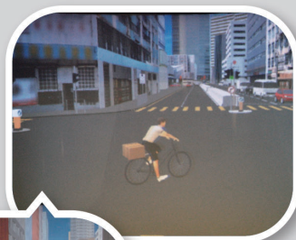
● 系統能模擬有司機突然打開車門及有道路使用者突然衝出路面等情景，助學員在安全情況下練習防衛性駕駛。