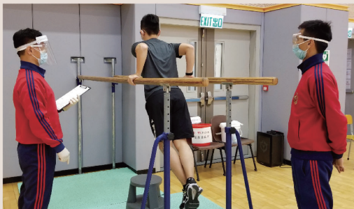
● 在疫情下，體能訓練組同事戴上防護裝備進行體能測驗。