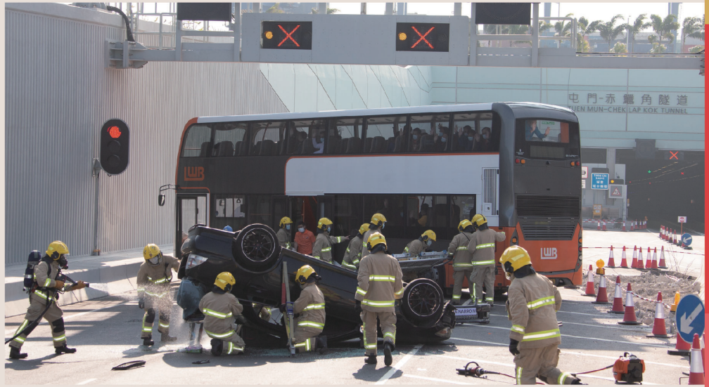
● 消防人員模擬拯救受傷的乘客。

演練模擬一輛雙層巴士與私家車在隧道入口相撞，消防人員到場後立即把被困私家車的傷者救出，並將巴士上的受傷乘客帶到安全地方，由救護人員進行分流、初步治理及送院；而警方及運輸署則負責指揮交通及協調附近臨時交通等安排。各參與人員及單位充分發揮團隊精神，令演練順利完成。