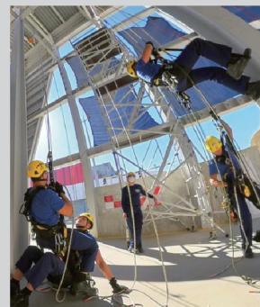
● 課程首兩星期着重訓練學員個人繩索技術。