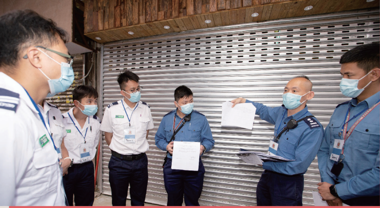
● 參與行動的消防及救護人員聽取行動簡介。 Participating fire and ambulance personnel receive a briefing on the operation.