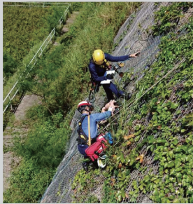
攀山拯救支援隊的救護人員需要完成為期四周的嚴格專門訓練並通過考核。

近年涉及山嶺意外的事故有上升趨勢，搜救工作亦日趨複雜，故部門將開展試行計劃，由受過相關訓練及考核的救護職系同事派駐消防及救護學院「攀山拯救支援隊」，負責在山嶺搜救行動中提供輔助醫療服務及相關教學職務。