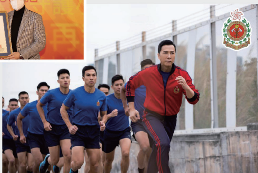
● 消防處屬員一起參與拍攝工作。

為進一步推廣香港消防處的專業服務及提升部門的國際形象，本處邀請國際知名巨星甄子丹擔任「香港消防處國際形象大使」，除了參與一系列的宣傳短片演出外，他更加破天荒為本處獻唱宣傳歌曲。