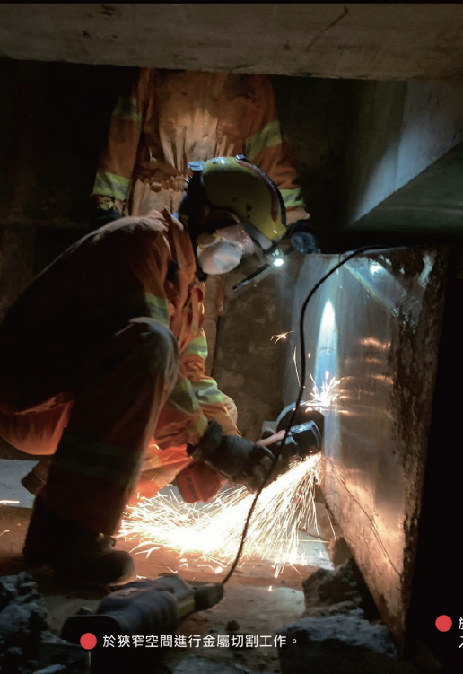
● 於狹窄空間進行金屬切割工作。

為加強演練的像真度及提高成效，在設計出動流程、運送裝備物資、設立行動基地、搜救程序及事故行動記錄等安排方面，完全依據聯合國國際搜救諮詢小組（INSARAG）的指引進行，符合國際救援組織的標準，使專隊於境外執行搜救任務時能與國際組織順利接軌。