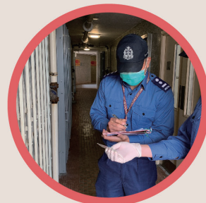
● 消防處人員協助上門檢查受強制檢疫人士，以助加強當局對有關人士的監測工作。 The FSD members assist in spot checks on persons under compulsory quarantine.

Department of Health. Five Ambulance Officers have also been seconded to the home quarantine taskforce under the Centre for Health Protection to render assistance for the home confinees, in collaboration with a team composed of up to 11 Senior Ambulancemen. Since the early stage of the pandemic, teams formed by off-duty FSD staff members have helped conducted spot checks on persons under compulsory quarantine. Hundreds of serving and retired FSD members have also participated in various kinds of voluntary work selflessly, such as putting electronic wristbands on people under compulsory quarantine, providing support and information to the confinees at call centres and distributing anti-epidemic materials to those in need.