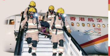
● 機場消防隊模擬拯救機上受傷的乘客。

香港國際機場每年都會舉行飛機事故及救援演習，以加強機場管理局處理事故的應變能力，以及與政府部門及機構之間的協調能力。