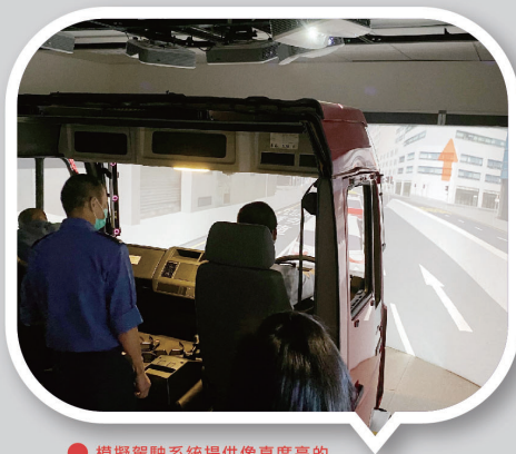
● 模擬駕駛系統提供像真度高的香港街道環境和不同場景。

經過兩年多的時間，消防處與香港大學工業及製造系統工程系合作研發的模擬駕駛系統，已於去年11月在消防及救護學院的駕駛訓練中心啟用，為消防及救護駕駛學員提供虛擬駕駛訓練。該訓練系統提供高像真度的香港街道環境，讓學員模擬在包括天雨、黑夜、特色路段及繁忙路面等不同情況下，處理不同危機及進行緊急召喚時的駕駛訓練，並讓學員在安全情況下練習各種防衛性駕駛的正確處理方法。