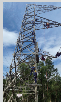
● 學員於中電訓練塔作處境救援實習。