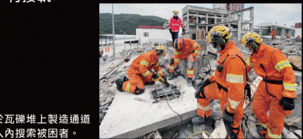
● 於瓦礫堆上製造通道入內搜索被困者。