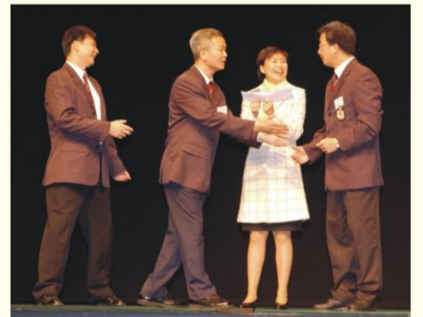
● 消防處代表隊在比賽中表現獲讚賞 F.S. Team wins the 2nd Runner-up in the Disciplined Forces Putunghua Competition