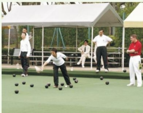
●消防草地滾球會現招募會員 The newly established F.S. Lawnbowling Club is recruiting members