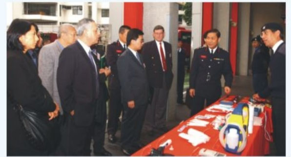
● 處長向代表團介紹消防處的救護設備 A top Macau disciplined forces delegation visits FSD Headquarters

代表團隨後參觀消防通訊中心，了解第三代電腦調派系統的運作；亦參觀了多種類型的滅火、救護車輛及裝備。