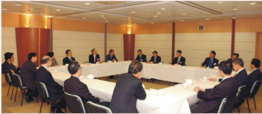
● 四個紀律部門副首長會議 The meeting of the Deputies of FSD, Correctional Services Department, Customs and Excise Department and Immigration Department

今次會議由消防處召開，出席的副首長包括消防處副處長盧振雄、懲教署副署長郭亮明、海關副關長黃秀培及入境事務處副處長周國泉。