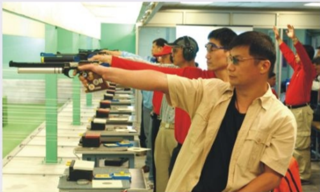
●消防處周年射擊大賽 NT Command wins the Championship in the Department's annual shooting competition