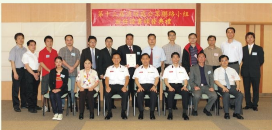
● 第十三屆消防處公眾聯絡小組於四月十九日舉行就職典禮 The Inauguration Ceremony of the 13th FSD Public Liaison Group was held on April 19