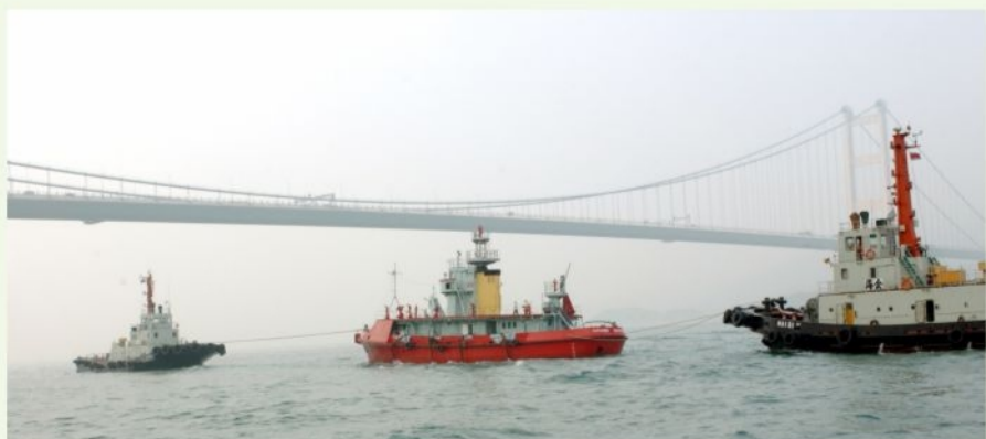
● 兩艘拖輪把「葛量洪號」拖往鯉魚涌 The Fireboat AG being towed by two harbour tugs towards Quarry Bay