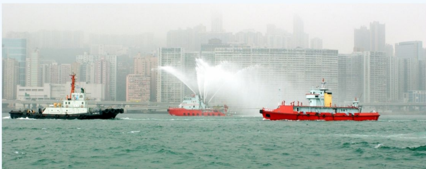
● 「葛量洪」號最後一次航程 The last voyage of the Fireboat AG