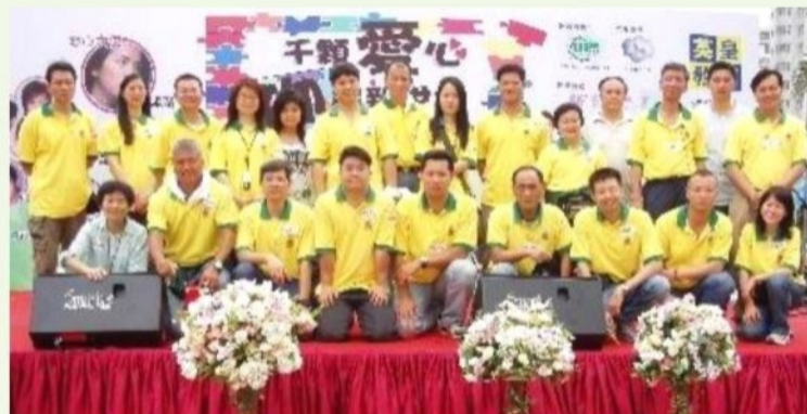
● 消防義工隊參與慈善活動 F.S. Volunteers help out in a charity activity

為支持該項慈善活動，消防義工隊派出約四十名義工參與，在場協助佈置場地，維持秩序以及運送物資等，活動亦因此而得以順利進行。