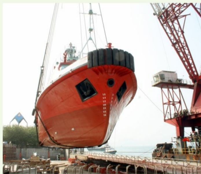
● 五百噸重的「葛量洪號」由海面吊運上岸 The 500-tonne Fireboat Alexander Grantham being lifted onto land

明年開放參觀的「葛量洪號」將透過豐富的文物及專題展覽，介紹滅火輪與社會的關係，以及香港海上救援百年歷史。