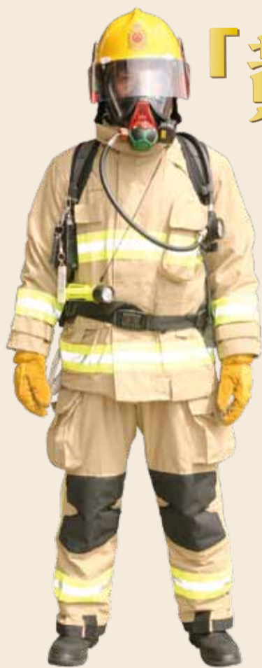
• 目前使用的構築物滅火防護服 Existing structural firefighting protective suit

註：出自《詩經·商頌·長發》，指龍受到上天眷顧，得以施展才能顯英勇，既不震驚不動搖，也不畏縮不惶恐，天賜的千祿百福全部降臨身上。