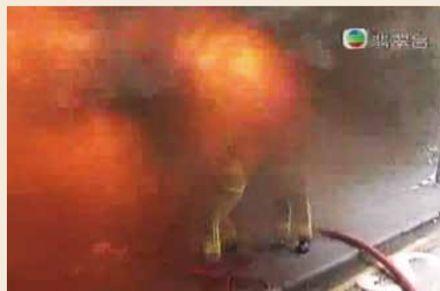
• 去年 12 月 20 日於旺角道發生的火警出現「回燃」現象，爆發出一個巨大火球 Backdraft phenomena in the fire at Mong Kok Road on December 20 last year

有驚無險的梁炳雄說：「我與所有的消防員都有著同一個願望，快快樂樂地上班，平平安安地下班。要達成這個願望，一套高效能的救火個人裝備決不可少。」