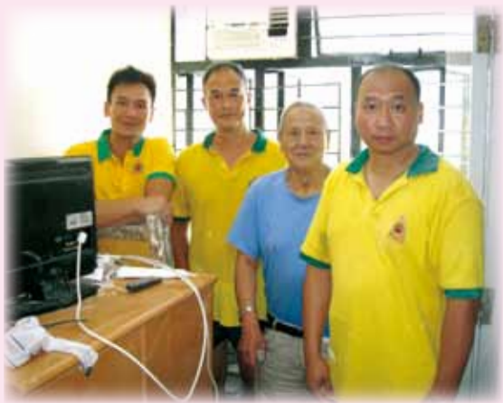
義工隊成員與屋主在翻新單位合照 F.S. volunteer team serve those in need