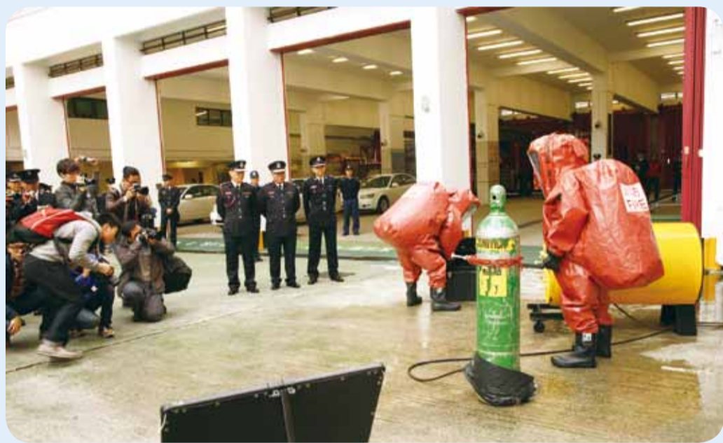
• 向傳媒展示新購置的裝備及工具。 A demonstration of newly acquired equipment after the press conference