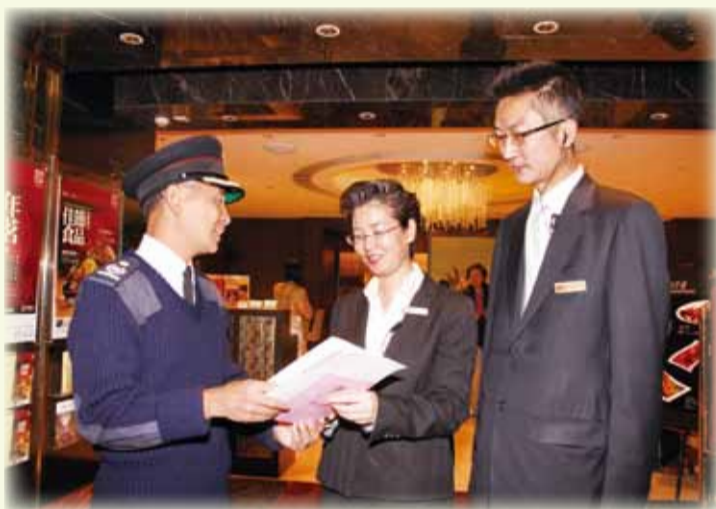
消防處人員在港島太古城中中心的食肆及公共娛樂場所派發防火宣傳單張 Fire Services personnel distributing fire safety pamphlets to the managers of restaurants and places of entertainment in Cityplaza, Taikoo Shing, Hong Kong

消防處牌照及審批總區人員於去年 12 月 14 日巡查位於港島太古城中中心的食肆及公共娛樂場所的消防安全狀況，旨在提高經營者的防火安全意識。 消防處人員檢查場所內的走火通道是否暢通、防煙門是否正確關上及消防裝置是否按時維修。巡查人員並派發防火宣傳單張，提醒公共娛樂場所的負責人在佳節期間應特別注意消防安全。