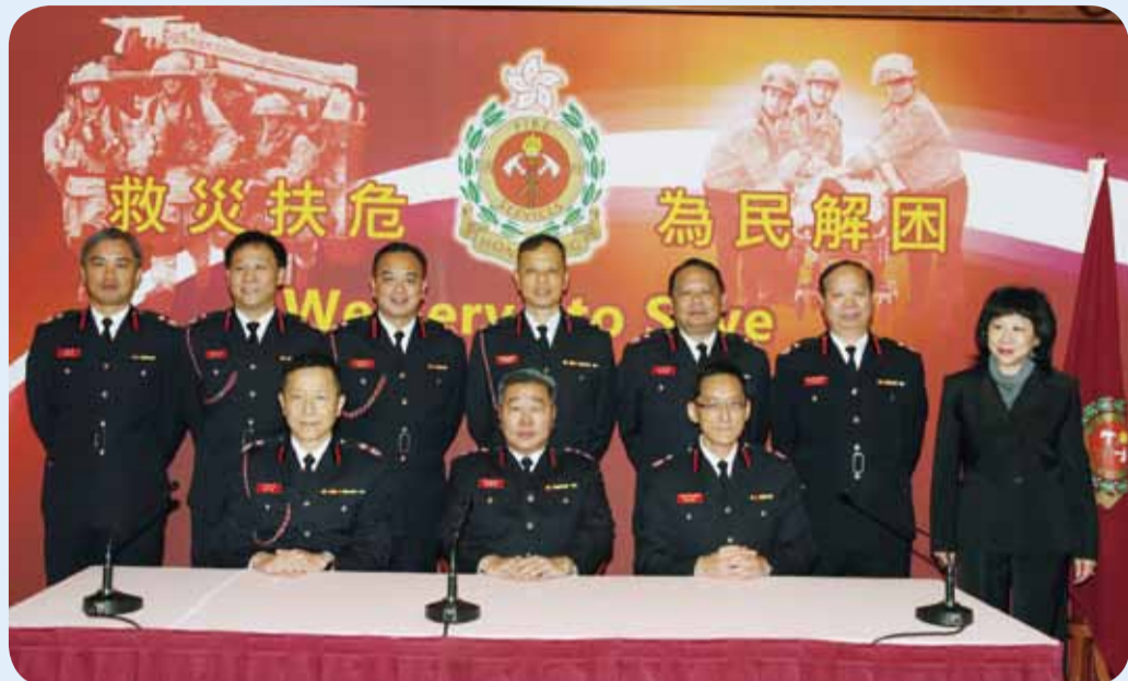
• 2011年終回顧記者會 2011 Year-end Review