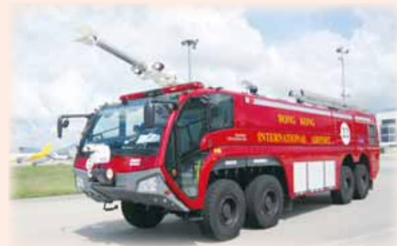
新的重型泡車 New Foam Tender