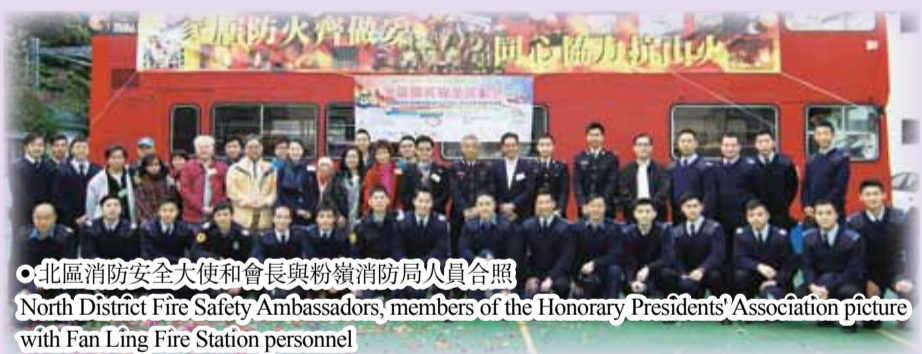
北區消防安全大使和會長與粉嶺消防局人員合照 North District Fire Safety Ambassadors, members of the Honorary Presidents' Association picture with Fan Ling Fire Station personnel

通過是次活動，同事們不但可以宣傳防火意識，亦可以建立彼此合作精神，實在饒富意義。