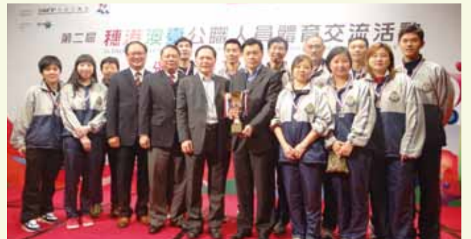
消防總長劉敏明（前排左四）與在澳門參加穗港澳台公職人員體育交流活動的香港消防處健兒合照 CFO, Mr Lau Mun-ming (fourth left, front row), pictures with athletes of FSD participating in a sports event of civil servants held in Macau

另外，總區際網球錦標賽 2012/2013 決賽亦已於 2 月 26 日順利舉行，獲消防總長（總部）羅紹衡主禮及頒發獎項。總區際錦標賽冠軍由新界總區奪得，亞軍和季軍分別由九龍總區及總部總區獲得。