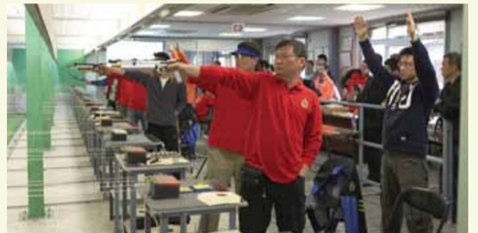
消防處周年射擊大賽 Fire Services Annual Shooting Competition