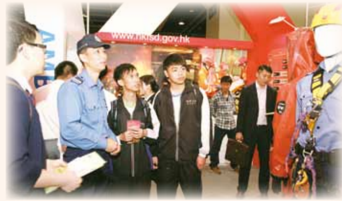
• 青年人參觀消防處在職業博覽會的攤位 Teenagers visiting FSD exhibition booth at the Career Expo 2013

展覽內容亦包括本處提供的各種服務，而高空拯救專隊、火警調查隊、火警調查犬、危害物質處理專隊、坍塌搜救專隊、坍塌搜救犬及輔助醫療救護員分別到場，為參觀人士講解相關工作，並示範使用工具，此外，救護主任、體能訓練導師、消防隊目（控制）及兩個防火總區的消防隊長則為參觀者解答各種關於工作範圍、入職條件、薪酬福利、投考程序、面試技巧、晉升機會等問題。現場亦設立一個收集箱，以便參觀者留下聯絡方法，讓本處能夠向他們發放最新的招募資訊。