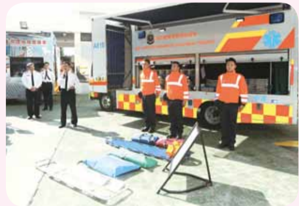
新引入的輔助醫療裝備車 The newly-introduced Paramedic Equipment Tender