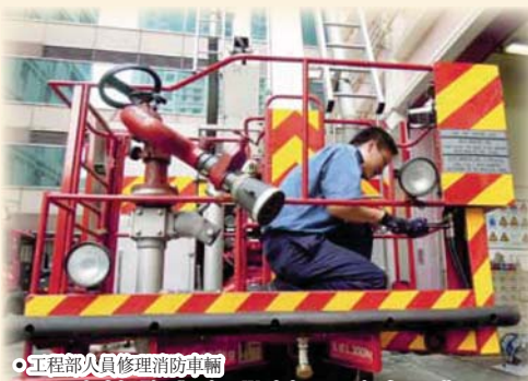
工程組人員修理消防車輛 Personnel of the Fire Services Workshops repairs fire appliances

因應效率促進組的建議，部門將部分工作轉交文職同事負責，這些文職同事包括由機電工程署借調往該組的技工，部門並開設一些技工職位，而最近亦招聘了一位軍裝人員和兩位工程技工，以應付工作需要。