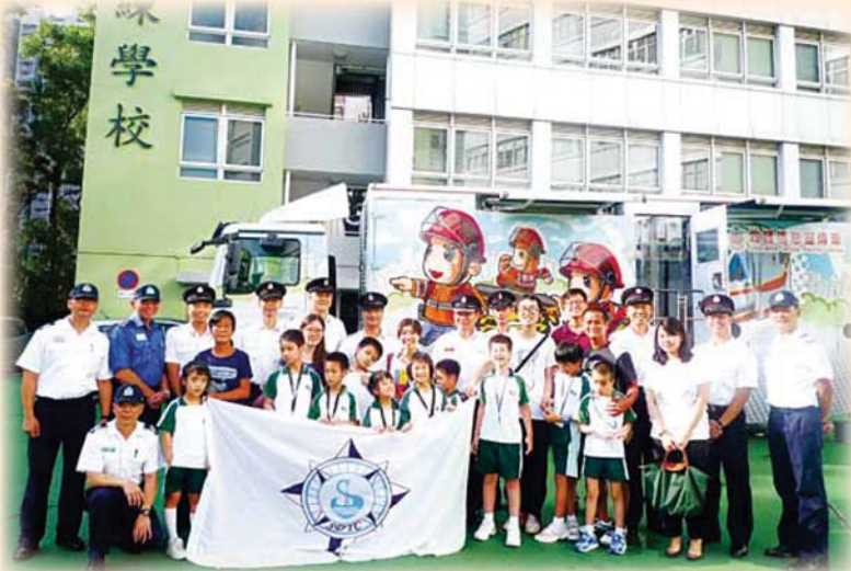
• 來自心光盲人學校的參觀者與本處人員在救護訓練學校合照 Visitors from the Ebenezzer School for the Visually Impaired picture with FSD personnel at the Ambulance Command Training School

情，領略到他們積極學習帶來的滿足感，亦激勵自己持續學習新知識，與時並進，為有需要的人帶來更專業的服務。