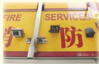
● 泵車的後視鏡頭及倒車鏡頭 Reversing camera and rear-view camera on a major pump

計劃的資料已上載本處網頁和本處的內聯網，供市民和本處屬員參閱。消防處會在首階段試驗計劃完成後檢討結果，評估成效以決定下一步計劃。本處會繼續聆聽部門各級人員及市民的意見，以完善試驗計劃的各項安排。