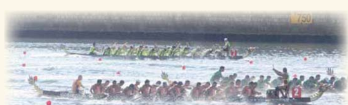
● 消防處龍舟錦標賽 2014 FSD Inter-Command Dragon Boat Championship 2014