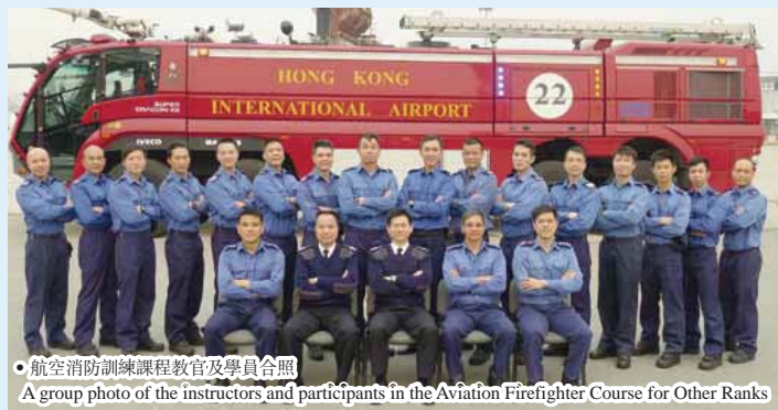
● 航空消防訓練課程教官及學員合照 A group photo of the instructors and participants in the Aviation Firefighter Course for Other Ranks