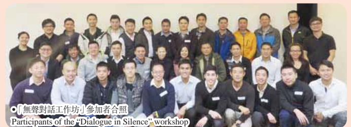
「無聲對話工作坊」參加者合照 Participants of the "Dialogue in Silence" workshop