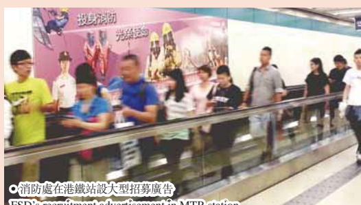
● 消防處在港鐵站設大型招募廣告 FSD's recruitment advertisement in MTR station