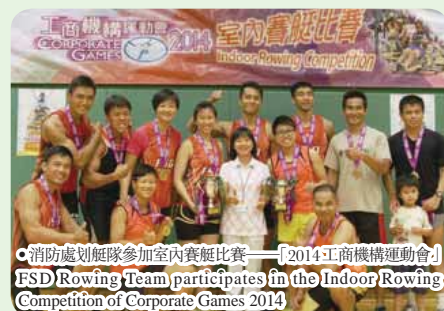
● 消防處划艇隊參加室內賽艇比賽——「2014 工商機構運動會」 FSD Rowing Team participates in the Indoor Rowing Competition of Corporate Games 2014