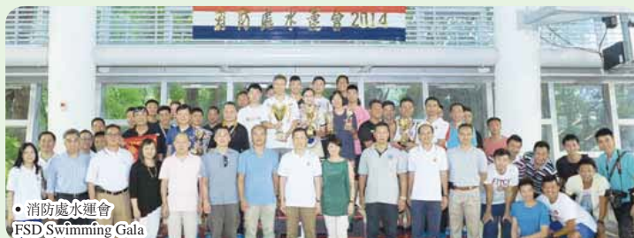
● 消防處水運會 FSD Swimming Gala

項目的主辦單位感謝各位義務的工作人員利用休班時間積極支持和協助籌辦是次活動，使本年度的水運會能順利完成。