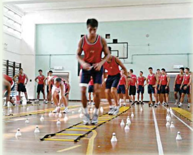
• 消防處屬員透過體能訓練，提升體適能 FSD personnel receive physical training to enhance physical fitness

評估體適能的項目繁多，究竟我們應如何進行訓練，使自身的體適能得以提升呢？「體能訓練組」會在往後的《精英專訊》專欄為大家詳細講解，敬請密切留意！