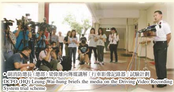
● 副消防總長(總部)梁偉雄向傳媒講解「行車影像記錄器」試驗計劃 DCFO (HQ) Leung Wai-hung briefs the media on the Driving Video Recording System trial scheme