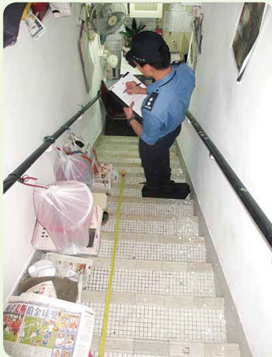
• 消防安全巡查專隊成員處理阻塞走火通道的投訴 A member of the Fire Safety Inspection Team handles complaints about obstruction of means of escape

倘發生火警時會妨礙市民逃生，因此會視為迫切的火警危險投訴。有鑑於部分消防局執行滅火救援的出勤率較高，而接獲的火警危險投訴個案亦較多，本處曾探討不同方案，致力確保有關的消防局能繼續快捷及有效地提供這兩方面的服務，經詳細研究後，本處分別在港島及九龍總區揀選試點，於2012年5月在該兩個行動總區各試行成立一隊「消防安全巡查專隊」(簡稱「專隊」)，協助這些工作量較多的消防局處理火警危險投訴，以便這些消防局人員可以有更多時間強化各項與行動相關的訓練、深化內部溝通及加強區內高風險設施或地點的巡查，從而提升前線人員的行動效率。