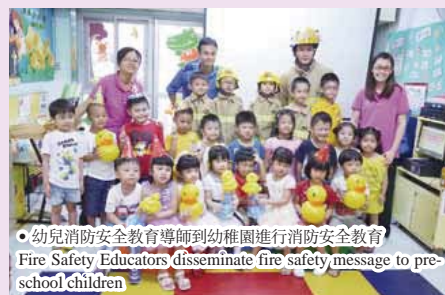
● 幼兒消防安全教育導師到幼稚園進行消防安全教育 Fire Safety Educators disseminate fire safety message to pre-school children

式的氣球公仔，除了可以在學校消防安全講座時送給小朋友外，亦可於消防開放日或宣傳活動時送給參加者，為活動增添氣氛。