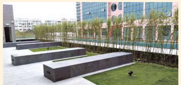
• 救護站設有空中花園，既可美化環境，亦可降低室內溫度 The rooftop garden improves surrounding environment and reduces room temperature inside the depot