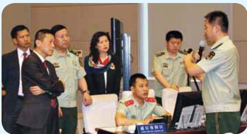
• 公安部消防局指揮中心人員向消防處代表團介紹該中心的運作 Staff members of the Fire Department of the Ministry of Public Security brief the FSD delegation on the operation of their command centre