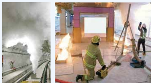
Personnel of the Railway Development Strategy Division carry out acceptance inspections of the fire safety facilities such as (clockwise from top left) refuge area, preaction recycling sprinkler system; and conducting the hot smoke test and cold smoke test