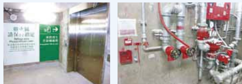
鐵路發展課人員負責驗收鐵路站的消防安全設施，包括(由左上順時針方向)避火區、重複啟閉預作用自動花灑系統、進行熱煙測試及冷煙測試