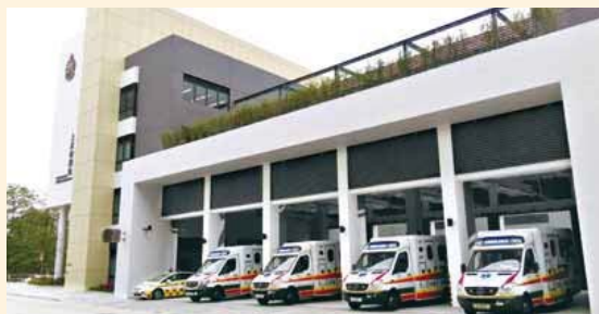
• 上水救護站是首間設有五個救護車停車間的救護站 The Sheung Shui Ambulance Depot is the first ambulance depot equipped with five ambulance bays

救護站內亦有不少綠化設施，其中包括位於隊員休息室外的空中花園，以及飯堂外的園林。這些綠化設施不但美化整個救護站的環境，同時亦有助減低救護站內的溫度及碳排放量。各項先進和新穎的設計及環保設施使上水救護站較其他的救護站更有生氣及活力。