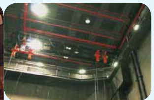
• 消防處人員參觀國家大劇院（左圖），考察劇院的消防性能化設計（上圖） FSD personnel visit the National Centre for the Performing Arts (left) to study the performance-based design of the Centre (above)