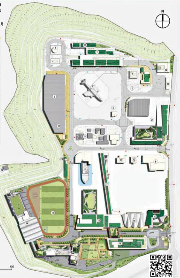
• 新的消防及救護學院的平面圖