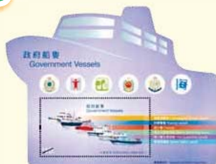
船形郵票小型張 A vessel-shaped stamp sheetlet

「精英號」於 2001 年投入服務，主要負責香港水域的滅火、搜救及潛水支援作業任務。「精英號」曾於 2010 年油麻地碼頭撲救一宗三級船火，並參與同年在東龍洲以北水域的內河運沙船搜救工作，以及 2013 年螺洲以西水域貨船沉沒事故的搜救工作。