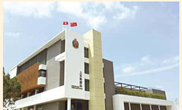
• 上水救護站進一步提升區內救護服務 The Sheung Shui Ambulance Depot further enhances ambulance services in the district

上水救護站能夠順利在本年第二季正式為市民服務，實在有賴部門在尋找合適地點及爭取資源方面的努力不懈，加上各高級長官、管理組、策劃組、資訊科技組、採購及物流組，以及救護總區各同事的鼎力支持及辛勞工作。