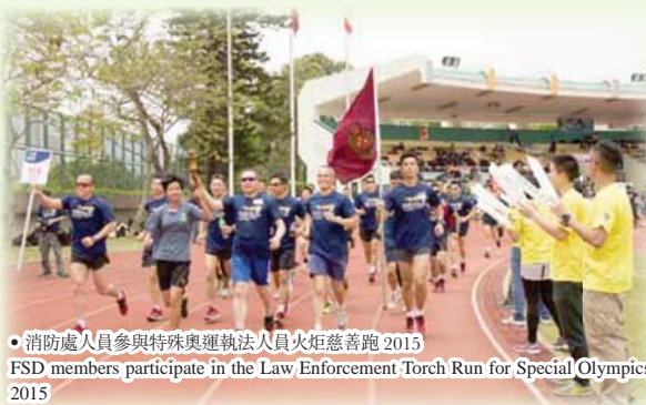
• 消防處人員參與特殊奧運執法人員火炬慈善跑 2015 FSD members participate in the Law Enforcement Torch Run for Special Olympics 2015