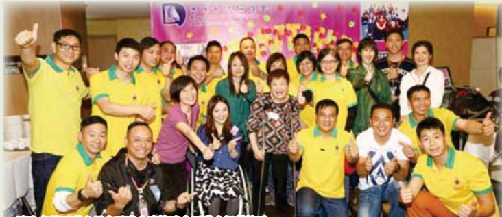
消防處義工隊人員在香港女障協進會活動中提供協助 FSD Volunteer Team members provide assistance in an activity organised by the Association of Women with Disabilities Hong Kong