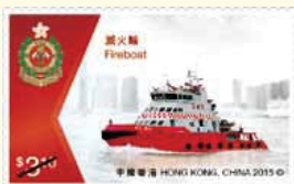
印有滅火輪「精英號」的特別郵票 A stamp with a picture of Fireboat "Elite"

香港郵政推出以「政府船隻」為題的特別郵票及相關集郵品，並於 5 月 21 日公开发售，加深市民對政府船隻及其職務的認識。