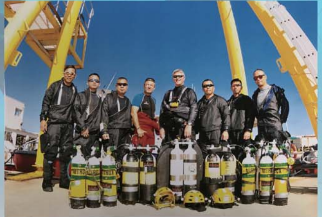
隊員學習使用乾式潛水衣及全副裝備。