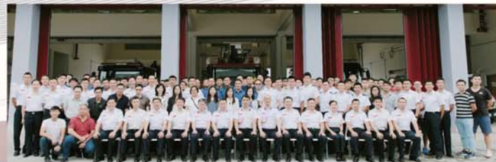
▶ 派駐港珠澳大橋消防局暨救護站的人員與消防總長(新界)邱偉強(前排右八)及救護總長陳兆君(前排右七)等長官合照。