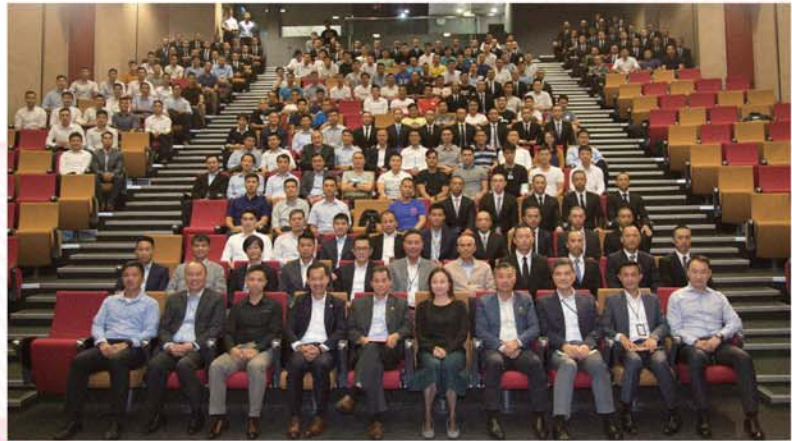
副消防總長(質素保證及管理)魏德勇(前排左五)與出席同事合照。