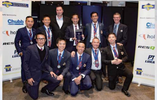
代表隊在比賽發揮高度合作精神，獲得Spirit of the Challenge獎項。