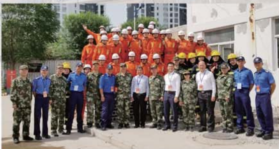
訪問團與參與坍塌事故演練的武警學院人員合照。

本處與內地專家和學院師生，就滅火救援的知識與訓練、建築防火課程建設、建築火災煙氣控制技術、智慧消防等專題分享交流，結合理論和實戰經驗，為兩間學院未來深入交流和合作建立良好基礎，成果豐碩。