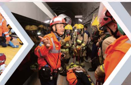
消防及救護人員於隧道內拯救傷者。