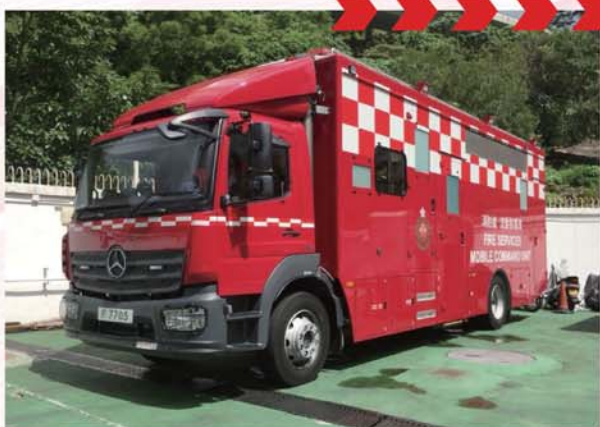
新型流動指揮車全長10米、高3.8米、重16噸。

新一部流動指揮車(F7705)已於6月17日在藍田消防局投入服務，令本處的流動指揮車增至六輛。新車配有多種先進裝置，車廂設計更配合行動需要。現時全港共有六輛流動指揮車，分別派駐於藍田、上環、尖沙咀、沙田、荔景及東涌消防局。