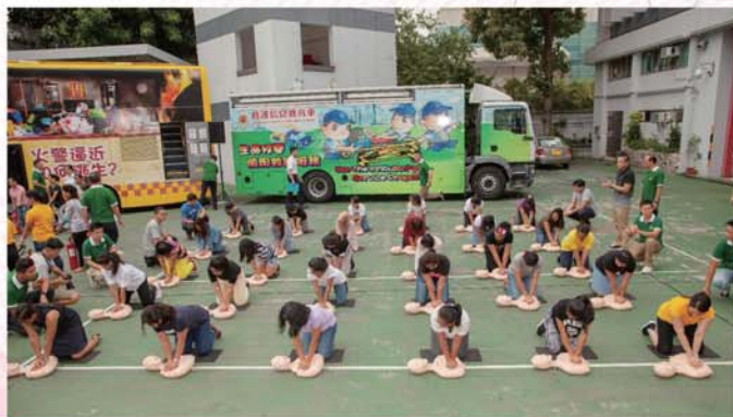
出席外傭親身體驗如何施行心肺復甦法。

另外，本處亦應總領事邀請，於8月17日到菲律賓駐港總領事館舉辦「消防安全 x 擊活人心」訓練課程，參加者包括副總領事Roderico C. Atienza及領事館各級人員。總領事和副消防總長(消防安全)陳錦輝當日亦有到場支持及頒發證書。