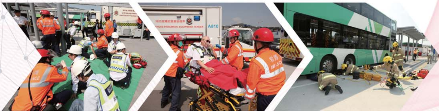
▶ 救護人員治理傷者。