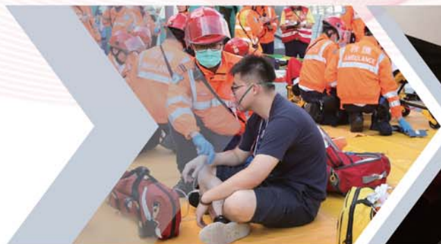
救護人員為傷者分流及治理。