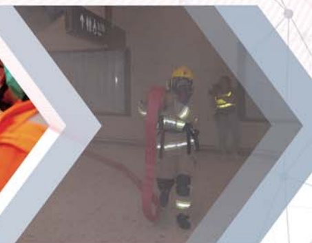
消防人員於西九龍站舖設滅火喉。