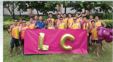
與牌照及審批總區同事參加龍舟比賽。