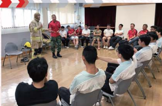
擔任友師的屬員透過不同的活動鼓勵和引導學生積極學習，擴闊視野。