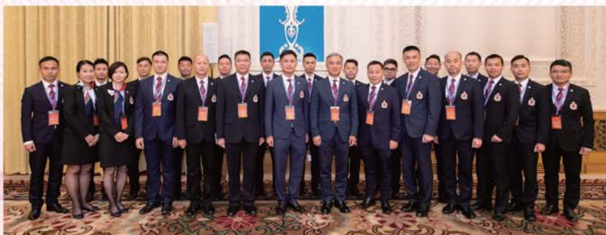
消防處代表團在為期四天的訪京行程中，到訪多個機構就彼此感興趣的內容進行深入交流。

8月27日，代表團在保安局局長李家超帶領下，獲國務院副總理韓正於人民大會堂親自接見。韓副總理對本港紀律部隊的工作予以肯定，並勉勵我們要堅定維持國家及香港的法治及安全，繼續為香港市民提供優質服務。