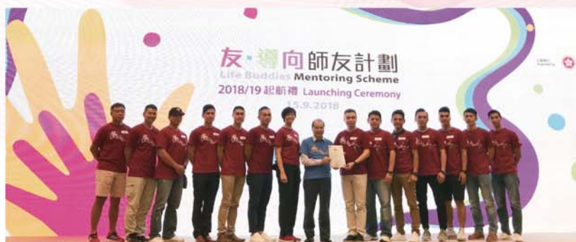
政務司司長暨扶貧委員會主席張建宗向參與計劃的屬員頒受嘉許獎狀。