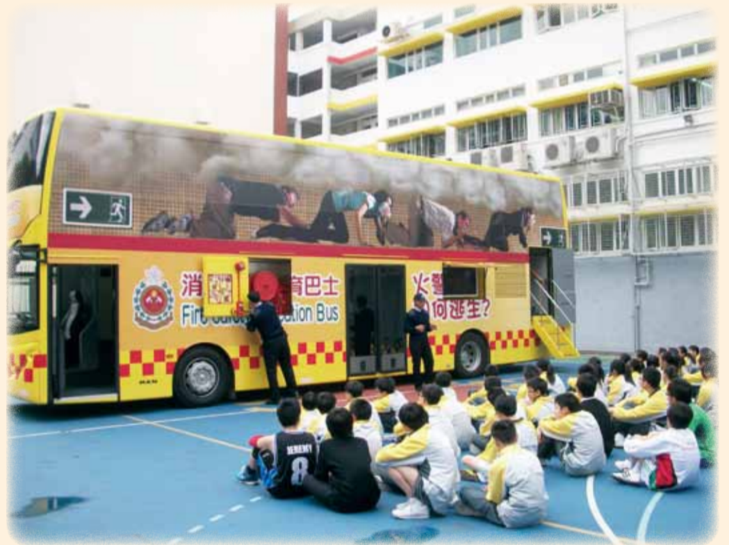
• 消防安全教育巴士到訪學校進行宣傳活動 The double-decker Fire Safety Education Bus visits a school

系統，可以在短時間內抽出所有模擬火警時所產生的煙霧，盡快令空氣回復清新。假如上層參觀人士如有需要或發生意外，可按動緊急掣，啟動抽氣、鮮風及照明系統，確保安全。