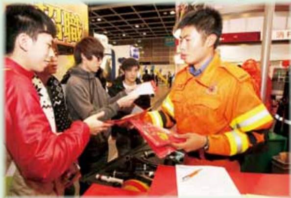
• 消防處在職業博覽會的攤位吸引青年人參觀 Teenagers are attracted by the FSD exhibition stall at the Career Expo

本處亦特別安排高空拯救隊、火警調查隊、核生化部隊、坍塌搜救專隊、火警調查犬領犬員及輔助醫療救護員到場，為參觀者講解有關工作職責及示範使用工具。