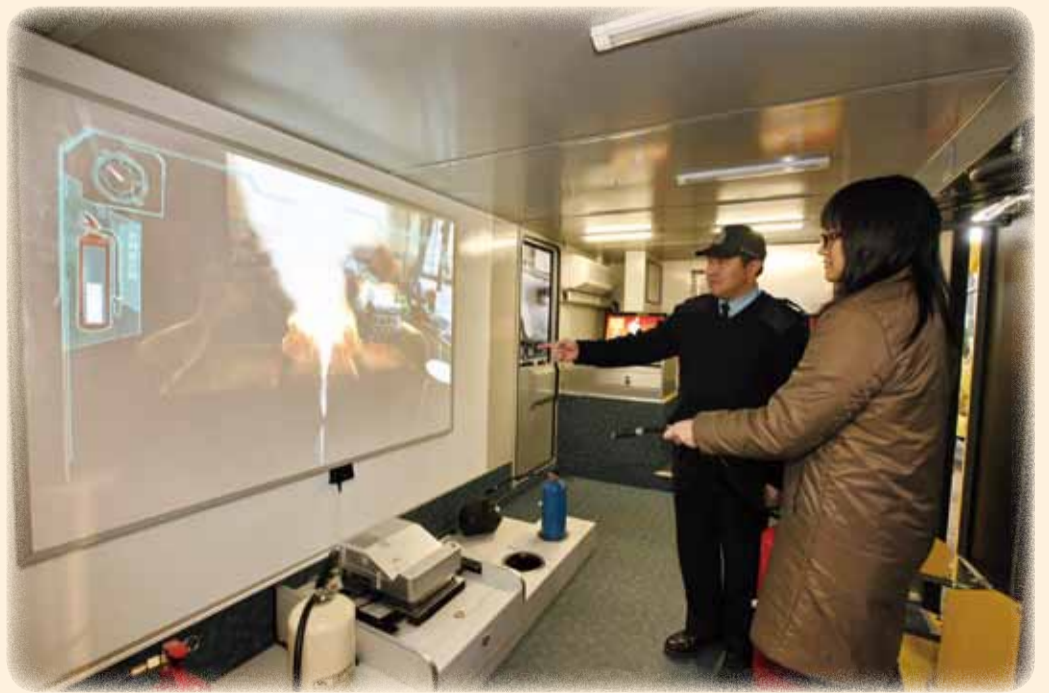
• 巴士下層的多媒體互動模擬滅火視象系統 The multi-media fire suppression training system at the lower deck