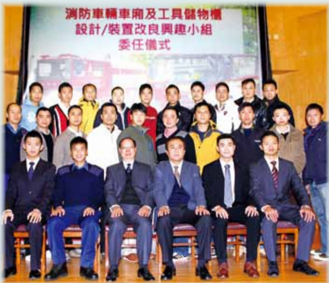
• 九龍消防總長岑永昌(左三)與小組成員合照 An interest group has been set up to improve the design of appliance cabinets and lockers

各同事如對消防車輛的車廂及工具儲物櫃設計有任何建議，歡迎將意見電郵至 lockerdesign@yahoo.com.hk。