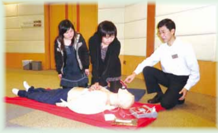
• 學員對訓練課程十分投入 F.S. Ambulance Command Training School organises a cardiopulmonary resuscitation course for FSD civilian staff

為加深消防處文職同事的急救常識，救護訓練學校特別為文職人員在3月12日舉辦心肺復甦法訓練課程，學習使用心臟去顫器，希望藉此提高他們對心臟病的認識，有需要時可以為心搏暫停人士進行心肺復甦法及使用心臟去顫器，以提升病人的存活率。