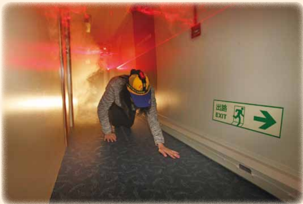
• 巴士上層以煙霧及激光模擬發生火警時的情況，讓參觀人士學習如何逃離火場 A visitor practises evacuation at the upper deck which simulates a fire scene