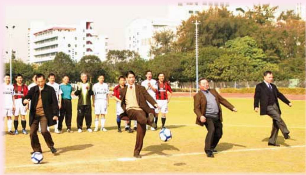
• 處表及副處長等為發財盃主持開球禮 The directorate officials officiate at the Fat Choy Cup Kick-off Ceremony

一年一度的發財盃於 2 月 2 日在九龍灣運動場舉行，當日賽程非常激烈，需要互射十二碼才能決定勝負，最後鄉紳派(港島、新界、牌照總區)以總成績 4 比 3 勝精英龍(九龍、消防安全、救護、總部總區)。