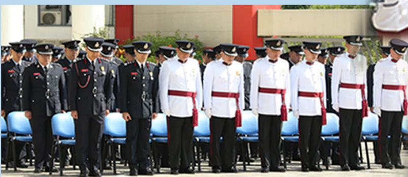
在《最後崗位》吹奏後，全場默哀一分鐘。 A minute's silence is observed after the playing of The Last Post.