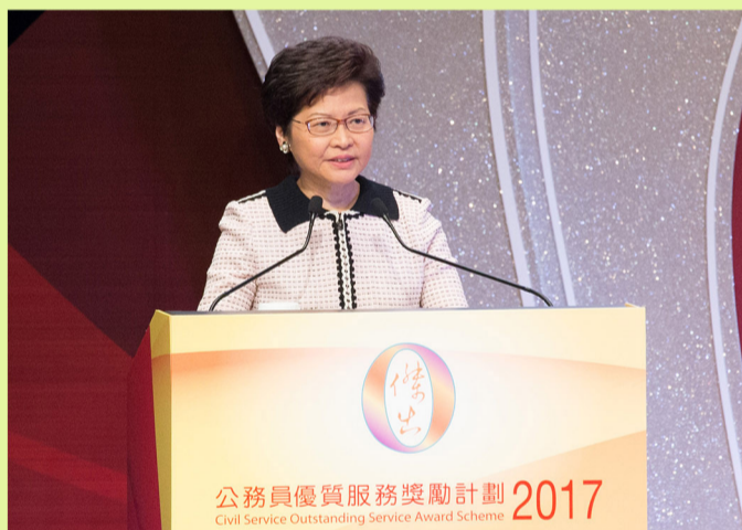
行政長官林鄭月娥在頒獎典禮上邀請出席者為消防處人員鼓掌。 The Chief Executive, Mrs Carrie Lam, invites participants to give applause to the FSD members.