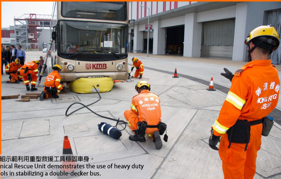
技術救援組示範利用重型救援工具穩固車身。 The Technical Rescue Unit demonstrates the use of heavy duty rescue tools in stabilizing a double-decker bus.