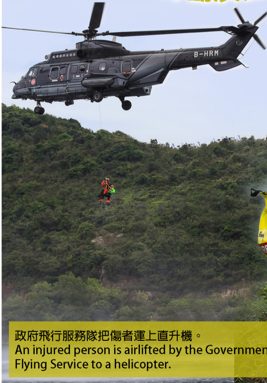
政府飛行服務隊把傷者運上直升機。 An injured person is airlifted by the Government Flying Service to a helicopter.