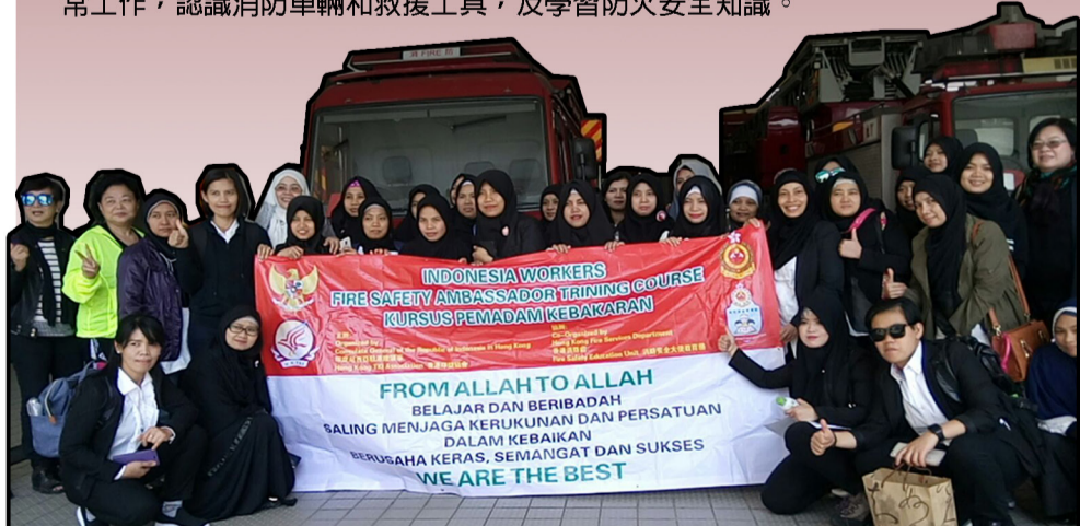
約40名印傭參加「消防安全大使」計劃。 About 40 Indonesian domestic helpers participate in the Fire Safety Ambassador Scheme.

一班來自印度及尼泊爾的小朋友，早前到長沙灣消防局參觀，了解消防員的日常工作，認識消防車輛和救援工具，及學習防火安全知識。