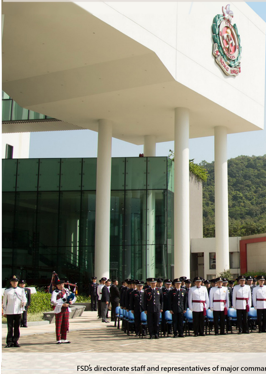
消防處首長級人員、各主要單位、五個消防及救護工會，以及退休人員互助會均有代表出席紀念儀式。 FSD's directorate staff and representatives of major commands, five fire and ambulance services staff unions and the retired members' mutual aid association attend the ceremony.