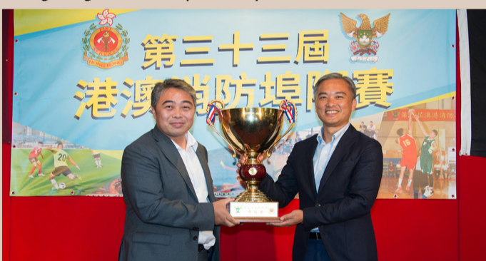
香港消防處代表隊成功蟬聯埠際賽總冠軍。 The Hong Kong FSD delegation becomes again the champion of Hong Kong-Macau Interport Competition.

翌日，港澳消防埠際賽的龍舟競賽移師到沙田賽馬會石門划艇中心舉行。比賽分為三個回合，分別為二百米中龍賽、二百米小龍賽及五百米中龍賽，三場比賽總時間較少的一隊為勝方。澳門消防局在首兩個回合均以短距離勝出，香港消防處在第三回合發力窮追，成功取回一局，但總時間仍以1.2秒之差落敗。