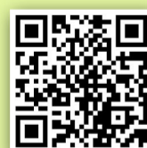
QR Code 消防處得獎名單