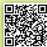
QR Code 公務員事務局專頁