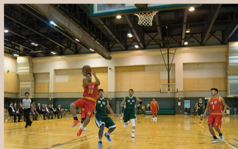
兩地消防代表隊在籃球比賽中競爭激烈。 The FSD delegation in two cities in an exciting basketball competition.

開幕禮在紀律部隊人員體育及康樂會運動場舉行過後，一連串競爭激烈、精彩刺激的運動競技項目隨即揭開戰幔。率先舉行的是元老足球賽，雙方代表都精銳盡出，務求在這場比賽中先拔頭籌。比賽期間，雙方同樣攻守兼備，令球賽緊張萬分。最後，香港消防處的足球健兒技勝一籌，全場攻入三球，兼且不失一球，以三比零勝出。接着舉行的精英足球賽，雙方代表的爭持同樣激烈，最終香港消防處再下一城，以一比零小勝澳門消防局。