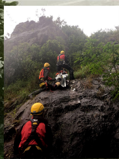
攀山拯救專隊和高空拯救專隊拯救被困行山人士。 MSRT and HART members take part in a mountain rescue operation.

今年8月26日，強烈熱帶風暴帕卡襲港，當晚天文台發出三號強風信號。期間，消防處接報有一男一女行山人士因迷路被困飛鵝山上，被困的女士更不慎墮坡受傷而不能走動，處方遂派遺攀山拯救專隊出動搜救。經過數小時的搜索，專隊隊員終於在面向扎山道一方的山崖找到他們，由於當時風雨交加，雨水從山上一湧而下，令所有人被困於山洪之中。由於情況危急，處方立即調派高空拯救專隊加入拯救。雖然我當時並非當值，但得悉現場環境惡劣及情況危險亦替他們擔憂。