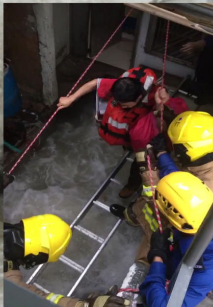
消防人員把被困村民帶到安全地方。 FSD personnel lead stranded villagers to safety.

颶風「天鴿」襲港期間，天文台發出2012年以來首個十號颶風信號。鯉魚門近岸邊的環境非常惡劣，海面不時捲起大浪，湍急的洪水覆蓋附近街道，部分海邊的圍欄及建築物亦被沖毀，洪水最高時更深及腰間。當日，油塘的升降台及細搶救車更處理多宗求助個案，成功救出共15名村民。