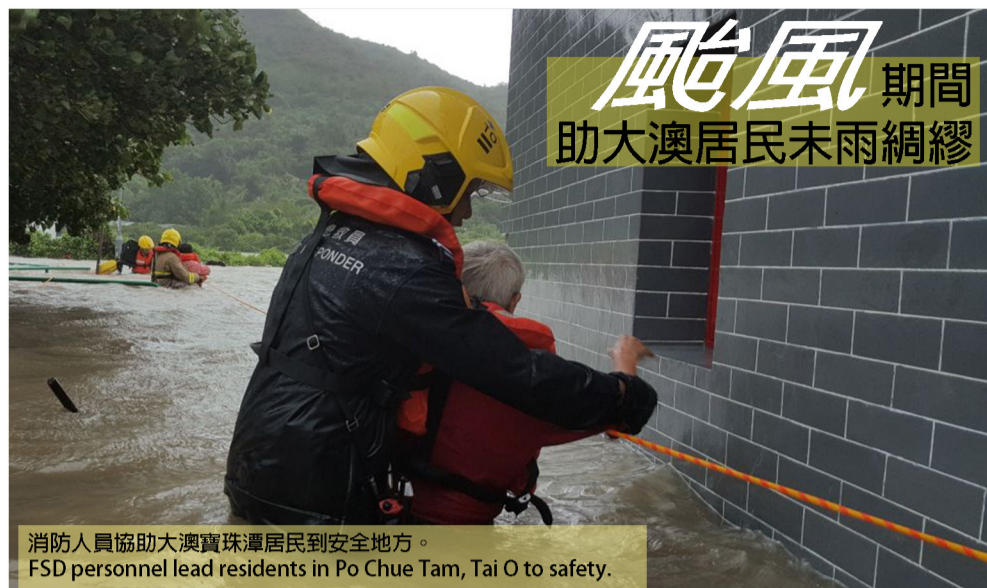
消防人員協助大澳寶珠潭居民到安全地方。 FSD personnel lead residents in Po Chue Tam, Tai O to safety.

大澳居民多年來面對水浸及颶風災害的威脅。雖然大澳兩間消防局早已就此制定了一套完善的應變計劃，但面對超強颶風「天鴿」的正面吹襲，同事們都打醒十二分精神，更自發根據社會福利署轄下鄰舍輔導會提供的名單，預先聯絡及探訪區內長者，以及行動不便和需要特別協助的人士，提醒他們颶風將至，如遇到困難應立即致電求助。另外，同事們又四出呼籲居民做好預防水浸及防風的措施，並在永安街、太平街、吉慶前後街等低窪地區架設充足的救生繩索，以提升救援時的效率。