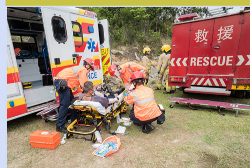
救護人員處理傷者。 Ambulance personnel handle an injured person.

重陽節期間,消防處派員到各區山火黑點及墓地派發單張,宣傳掃墓及祭祀時的防火要點。處方亦於演習當日,向參與本年度「零山火獎勵計劃」的村代表頒發嘉許狀,表揚他們在防止山火方面的努力。