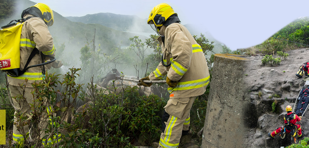
消防處人員模擬拯救傷者及撲滅山火。 Fire service personnel simulate the rescue of an injured person and vegetation fire-fighting.