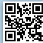
QR Code 消防處紀念日短片

紀念儀式簡單而莊嚴。在警察樂隊號角手吹奏《最後崗位》後，全場人士默哀一分鐘。隨後，處長與來自各個總區、文職人員、香港消防主任協會、香港消防處救護主任協會、香港消防控制組職員會、香港消防處職工總會、香港消防處救護員會和香港消防退休人員互助會的代表，在《晨曦號》的樂曲聲中，先後向英勇殉職的同胞獻花。