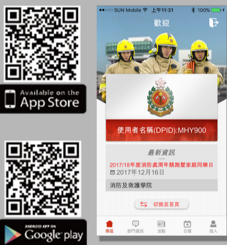
於App Store或Google Play下載「香港消防處流動應用程式」 Obtain the FSD App from the App Store and Google Play

「香港消防處流動應用程式」已新設「屬員專區」,屬員現在可以透過智能電話或平板電腦登入,隨時隨地獲得部門最新資訊,包括: