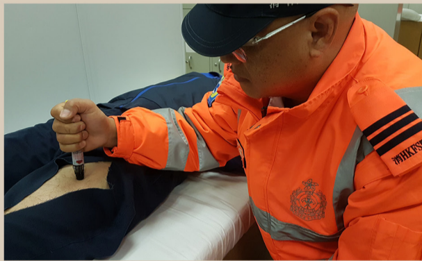
300微克腎上腺素自動注射器 Jext adrenaline auto-injector (300 mcg)

救護總區由今年9月起引入300微克腎上腺素自動注射器,取代在皮下進行注射。具備高級治理程序資格(I)的二級急救醫療助理,可利用它為十二歲以上出現全身過敏性反應的病人,提供有效及即時的治理。現時所有由上述人員當值的快速應變急救車、輔助醫療救護車和輔助醫療救護電單車,均有此配備。