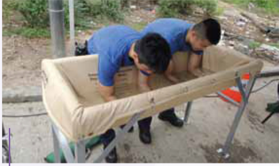
歇息區內的降溫裝置。 Immersion Cooling Equipment (ICE) in the Rest Area.