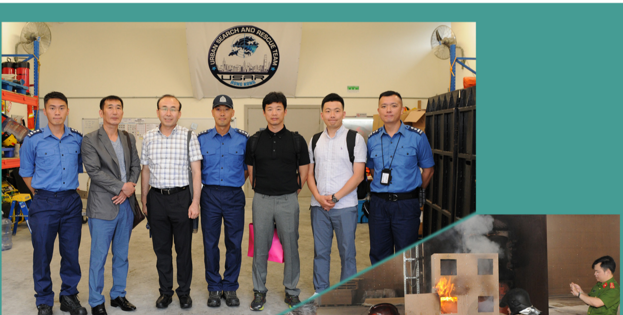
韓國代表團與坍塌搜救專隊人員進行技術交流。 Technical exchange between the Korean delegation and USAR specialists.