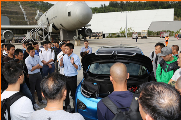
參加屬員聽取有關電動車輛的結構的講解。 Participants are briefed on the structure of an electric vehicle.

為使本處救援工作的策略、技術及知識能與時並進，新界東區、新界西區及技術救援組於11月22及23日在消防及救護學院舉辦了兩場「電動車輛及雙層巴士工作坊」，以傳承知識、技術及經驗，有超過500人參加。