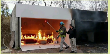
火警調查員透過模擬火警情況以調查起火原因。 Fire investigators stimulate a fire scene to investigate the cause of a fire.