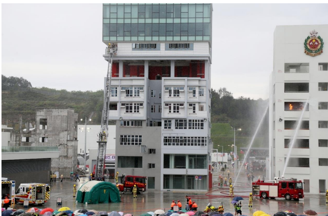
消防、救护和调派及通讯组学员示范扑灭火警和救伤工作。