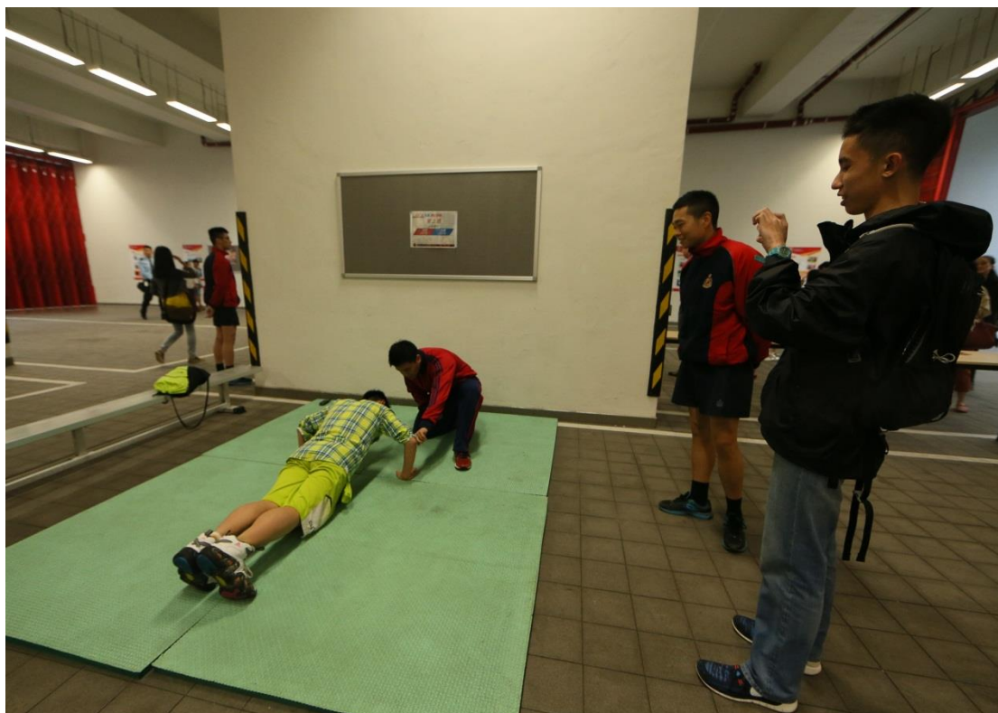
投考信息专区让市民尝试各项入职考核测试。