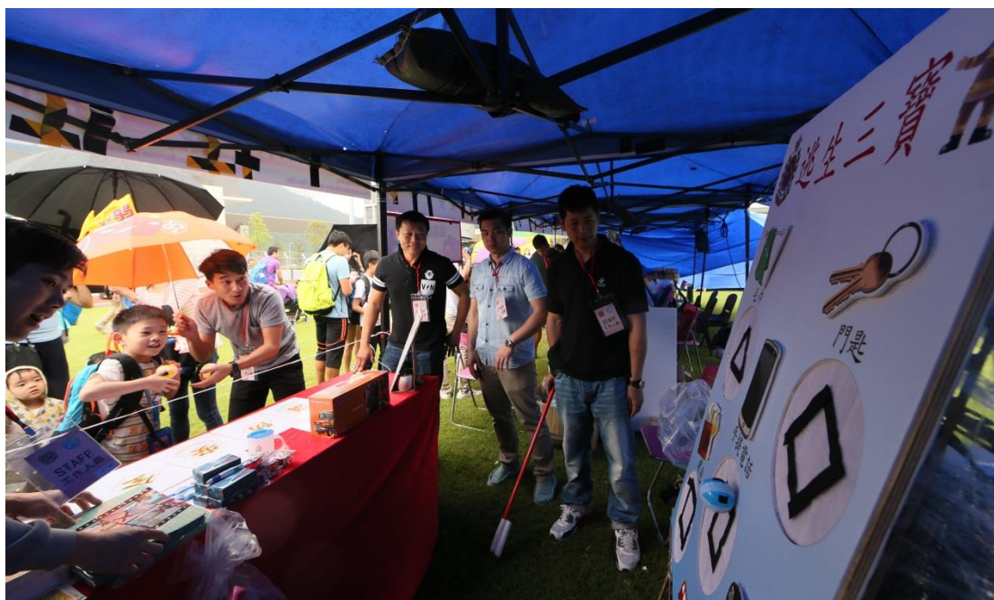
小朋友开心参与摊位游戏。