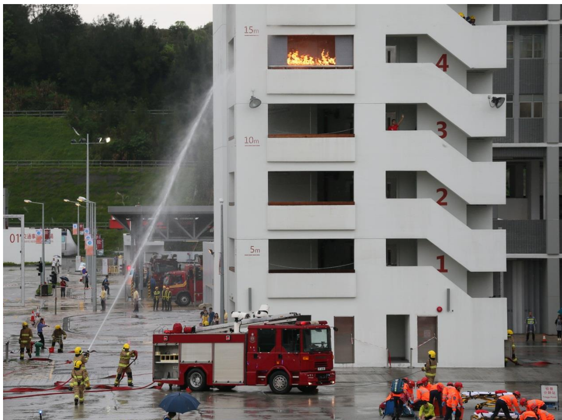
消防、救护和调派及通讯组学员示范扑灭火警和救伤工作。