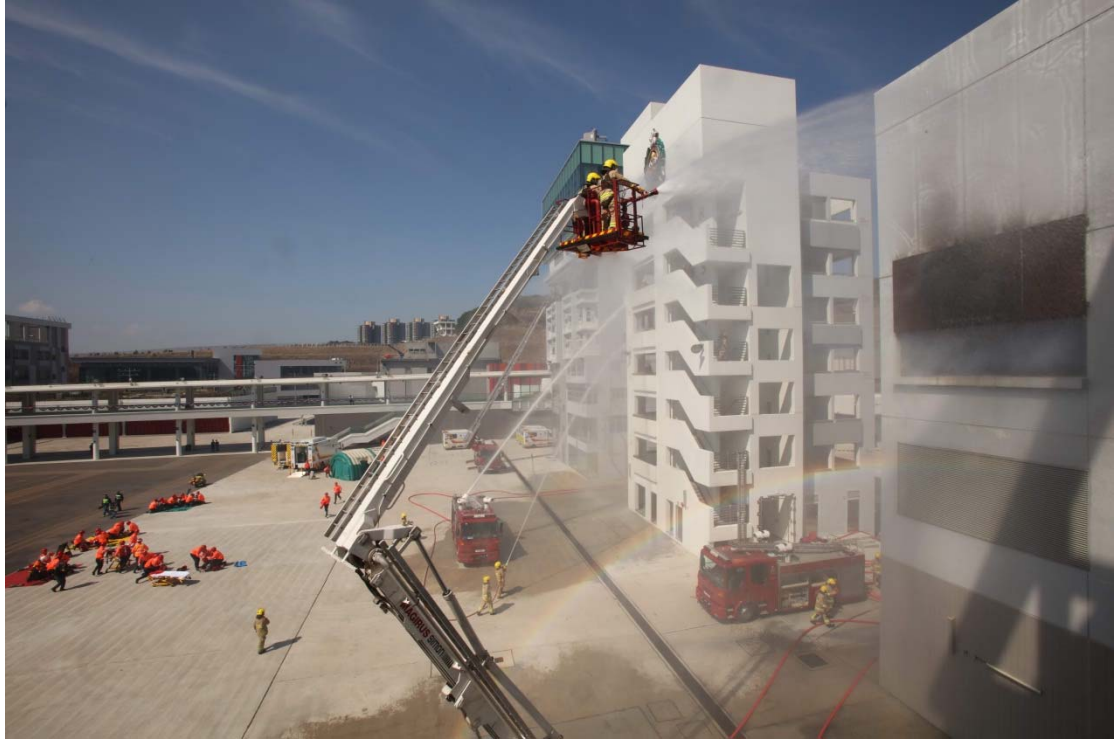
保安局常任秘书长罗智光今日（二月十七日）在消防及救护学院出席消防处第177届结业会操，检阅学员。图示结业学员示范扑灭火警及救护工作。