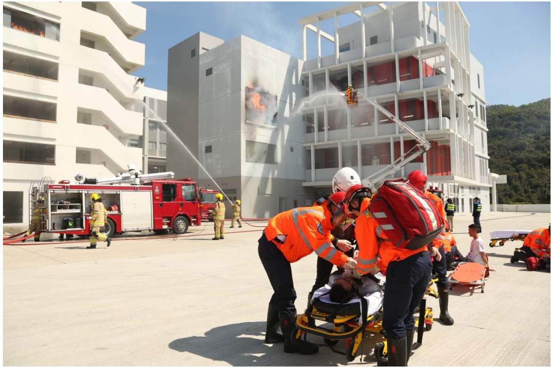
保安局常任秘书长罗智光今日（二月十七日）在消防及救护学院出席消防处第177届结业会操，检阅学员。图示结业学员示范扑灭火警及救护工作。