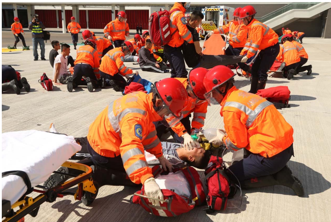
保安局常任秘书长罗智光今日（二月十七日）在消防及救护学院出席消防处第177届结业会操，检阅学员。图示结业学员示范扑灭火警及救护工作。