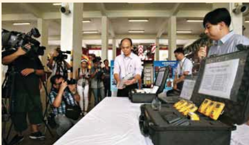
● 政府化驗所人員向傳媒介紹在事故現場能快速識別化學品的專業儀器 Personnel of the Government Laboratory showing the media the professional equipment which can quickly identify unknown chemicals at incident scenes

黃嘉榮說：「消防處一向以保障公眾安全為首要任務，本處會繼續在《危險品條例》的框架下嚴謹監管有關的危險物質，務使香港市民的生命及財產得到保障。」