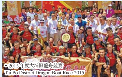
● 2015 年度大埔區龍舟競渡賽 Tai Po District Dragon Boat Race 2015