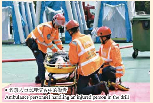
● 救護人員處理演習中的傷者 Ambulance personnel handling an injured person in the drill