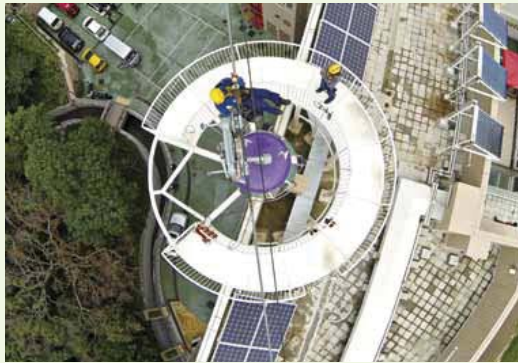
Personnel of the Hong Kong Fire Service receiving training at the simulated cable car system on the top of the Aberdeen Fire Station cum Ambulance Depot