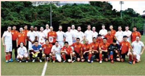
● 消防足球隊與美國駐港總領事館代表隊合照 Fire Services Football Team members pictured with the representatives of U.S. Consulate General Hong Kong

另外，消防足球隊與香港學界精英代表隊於 8 月 6 日在九龍仔公園足球場進行友誼賽，消防足球隊以三比一勝出。