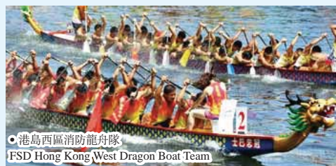
● 港島西區消防龍舟隊 FSD Hong Kong West Dragon Boat Team