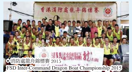
● 消防處龍舟錦標賽 2015 FSD Inter-Command Dragon Boat Championship 2015

第二屆消防處龍舟錦標賽於 8 月 22 日在沙田城門河舉行。今年新增三個比賽項目，分別是主任級別小龍組、40 歲以上小龍組及紀律部隊邀請賽。約二千多名休班屬員及家屬到場參賽及打氣，場面十分熱鬧。各總區及分區隊伍均充分發揮團隊合作精神，奮力作賽。最後由港島總區奪得「處長盾」殊榮，由處長黎文軒頒發。