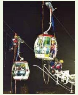
消防人員在晚間進行實地操練 Fire personnel carrying out an onsite drill at night

纜車事故有別於一般特別服務。一般事故中，例如有人企圖從高處跳下或有人被困地盤天秤等，消防人員需要盡快把事主或傷者拯救到安全地方。但在纜車事故現場，車廂下面往往是荒山野嶺，若用繩索把被困者或傷者移往地面風險較高，反而纜車車廂才是最安全的地方。除非有乘客受傷而其情況危急，必須緊急撤離，否則救援人員不會隨便把乘客移離車廂。 曾接受纜車高空拯救訓練的薄扶林消防局署理隊目黃小明表示，透過模擬纜車系統進行實境訓練，不但可以就預見的情況多加演練，更能提升隊員的合作性及培養默契。 他說：「回想第一次接受纜車拯救訓練時，我很開心，因有機會學習新的知識和技術，提升自己專業水平。雖然訓練並不輕鬆，但我認為付出的努力非常值得。作為拯救員，我們必須熟習拯救程序，發揮團隊合作精神，為拯救行動作出準備。Train hard, fight easy。」