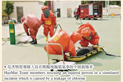
● 危害物質專隊人員在模擬洩漏氯氣事故中拯救傷者 HazMat Team members rescuing an injured person in a simulated incident which is caused by a leakage of chlorine