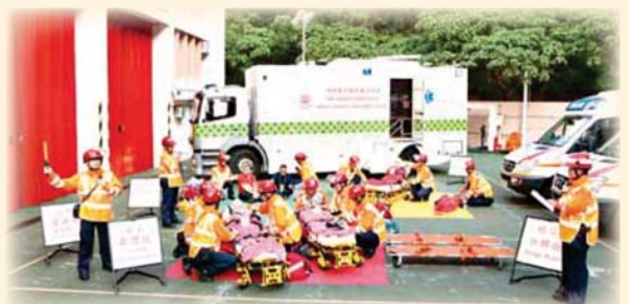
大型事故演習加強特別支援隊人員對處理大型事故的認識 SSU members enhance their know-how for handling major incidents through drills and exercises