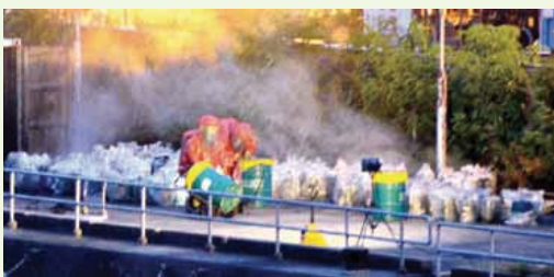
● 危害物質專隊人員將洩漏二氧化硫的容器放入重型盛載器內 HazMat Team members put leaking containers filled with sulphur dioxide into a heavy-duty container

為進一步提升屬員對危害物質的應變能力，本處會繼續派遣人員修讀美國伊利諾州大學伊利諾消防學院舉辦的處理危害物質事故訓練課程。