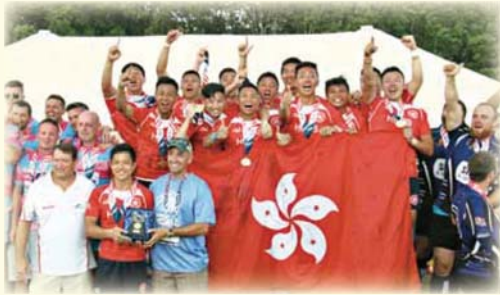
● 紀律部隊聯隊奪得世界警察及消防大賽 2015 七人欖球賽事冠軍 The Hong Kong Discipline Services Team wins the gold medal of the Rugby Sevens in the World Police & Fire Games 2015

兩年一度的「世界警察及消防大賽 2015」於 6 月至 7 月期間在美國維珍尼亞州舉行；來自全球不同地方的執法隊伍及消防人員，在這國際級的運動盛事中一較高下。由消防處及懲教署人員組成的紀律部隊聯隊，在大賽的七人欖球賽中勇奪冠軍殊榮。