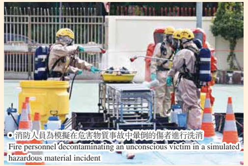
● 消防人員為模擬在危害物質事故中暈倒的傷者進行洗消 Fire personnel decontaminating an unconscious victim in a simulated hazardous material incident