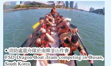
● 消防處龍舟隊於南韓釜山作賽 FSD Dragon Boat Team competing in Busan, South Korea

消防處龍舟隊於 9 月 11 日及 12 日參加韓國釜山國際龍舟賽，創下佳績。參賽隊伍來自世界各地，包括南韓、中國、美國、俄羅斯、新加坡及馬來西亞等。消防處龍舟隊在多項賽事中奪標，包括在公開組 200 米賽事及公開組 500 米賽事中奪得冠軍榮譽。