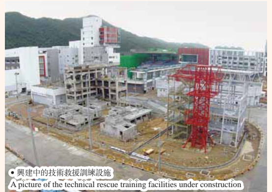
興建中的技術救援訓練設施 A picture of the technical rescue training facilities under construction

「塔式起重機」及「纜車塔」分別按起重機及纜車的獨特設計和操作而特製，訓練屬員在狹窄及受限制的環境下執行拯救任務。