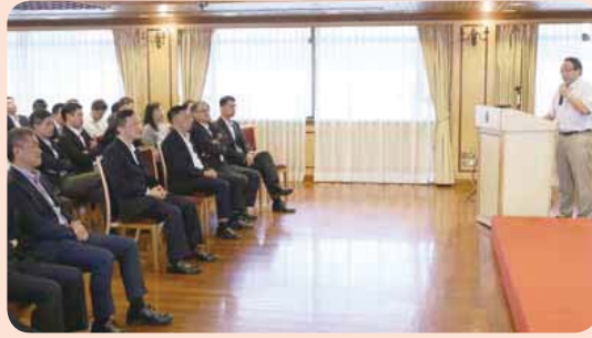
• 前律政司司長黃仁龍(左圖)及前香港大專校長徐立之教授(右圖)在講座上分享經驗 (Left and right pictures) Former Secretary for Justice, Mr Wong Yan-lung, and former President and Vice-chancellor of the University of Hong Kong, Professor Tsui Lap-chee, share their experiences at the seminars