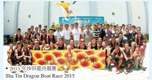
● 2015 年沙田龍舟競渡賽 Sha Tin Dragon Boat Race 2015