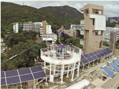
港島總區人員在香港仔消防局暨救護站頂層的模擬纜車系統接受訓練 Personnel of the Hong Kong Fire Service receiving training at the simulated cable car system on the top of the Aberdeen Fire Station cum Ambulance Depot