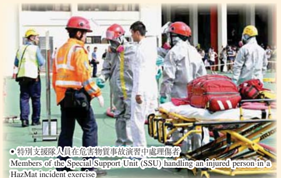
特別支援隊人員在危害物質事故演習中處理傷者 Members of the Special Support Unit (SSU) handling an injured person in a HazMat incident exercise