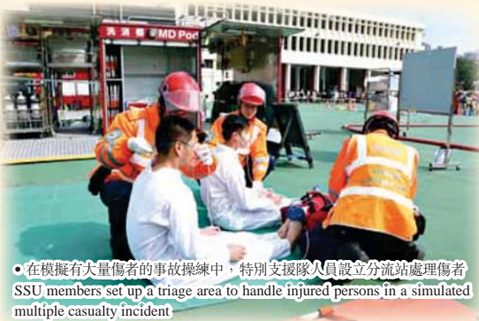
在模擬有大量傷者的事故操練中，特別支援隊人員設立分流站處理傷者 SSU members set up a triage area to handle injured persons in a simulated multiple casualty incident