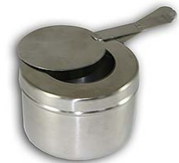
典型的盛载燃料的容器 / 炉具