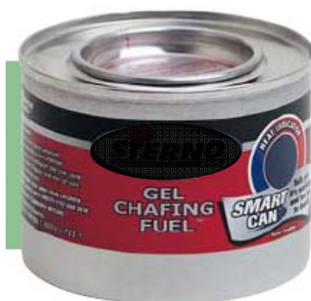
盛载啫喱状燃料的无缝容器 / 炉具样本