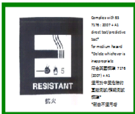
Sample III (樣本 III)