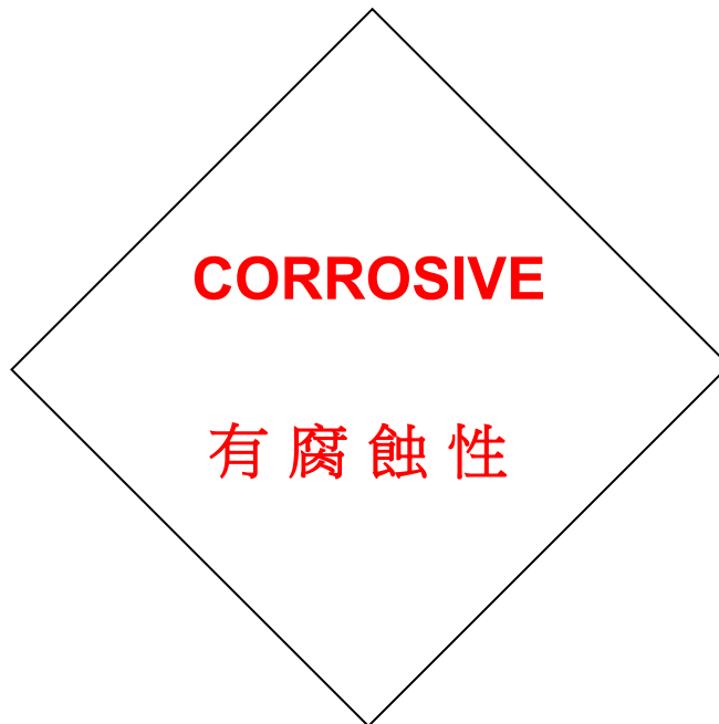
Label E 標籤 E

Vermilion Red lettering on White 朱紅色字白色底