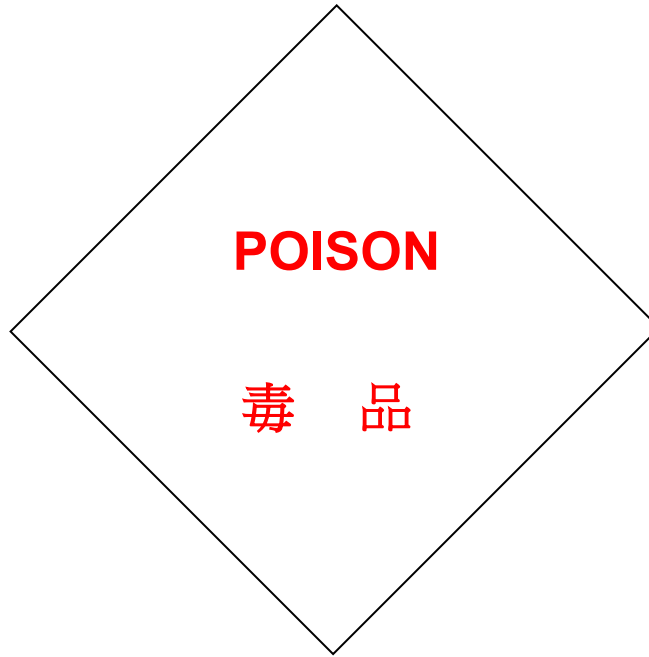
Label D1 標籤 D1

Vermilion Red lettering on White 朱紅色字白色底