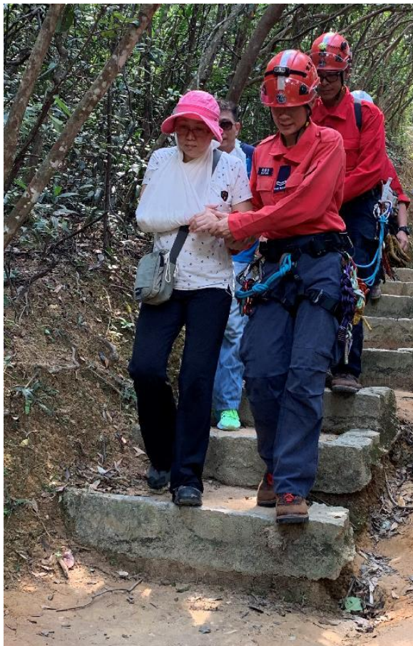
民眾安全服務隊人員在今日（九月二十五日）舉行的跨部門山火暨攀山拯救行動演習模擬拯救傷者。