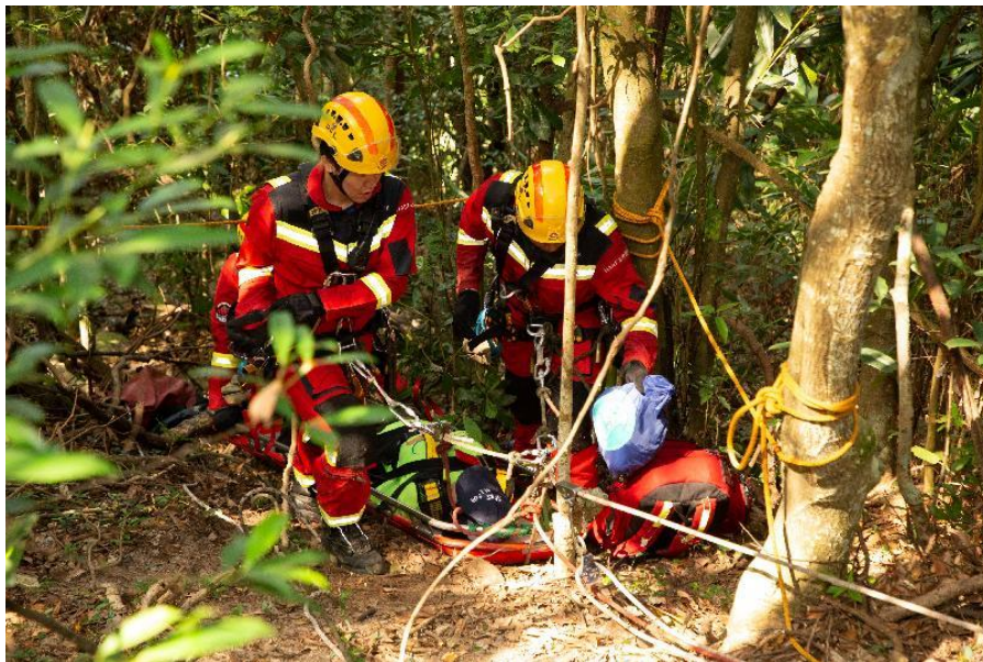
消防處高空拯救專隊在今日（九月二十五日）舉行的跨部門山火暨攀山拯救行動演習模擬拯救一名傷者。