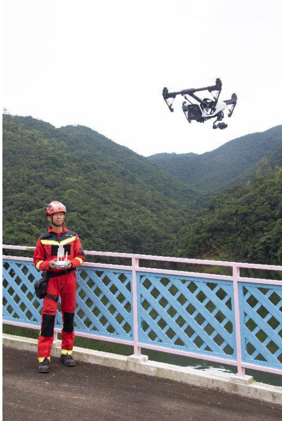
政府多個部門參與今日(九月二十五日)舉行的跨部門山火暨攀山拯救行動演習。圖示消防處人員模擬使用航拍機協助搜索傷者。