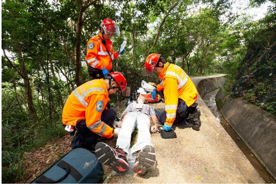
救護人員在今日（九月二十五日）舉行的跨部門山火暨攀山拯救行動演習模擬處理一名傷者。