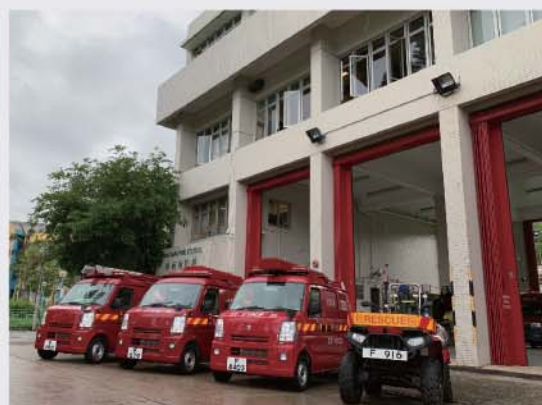
坪洲消防局的車輛為適應離島及偏遠地區的狹窄路面而訂造。

外觀方正的坪洲消防局座落坪洲的大街上，實而不華。為適應離島的環境及地形變化，局內的車輛及工具與市區的消防局大有不同，例如該局使用的電動馬陶快速爆破器能適應狹窄的環境，令我們可靈活地使用。而坪洲消防局的消防車輛，包括小型搶救車(MRV)、小型消防車(MFV)、小型裝備車(MEC)、迷你搶救車(MRT)、迷你消防車(MFT)及後勤支援車(LSA)等更是為了適應離島及偏遠地區的狹窄路面而訂做。