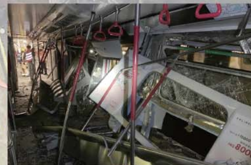
意外後車廂損毀嚴重。