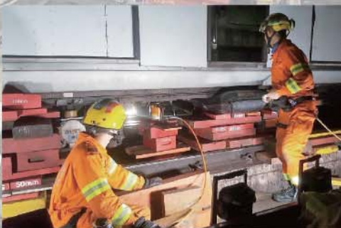
坍塌搜救專隊利用重型油壓機及氣墊處理偏離路軌的車廂。

為配合本港鐵路的发展，坍塌搜救專隊去年特地派員到法國學習處理鐵路意外的專業知識和拯救技術。專業水平的提升，亦成為是次行動的成功關鍵。