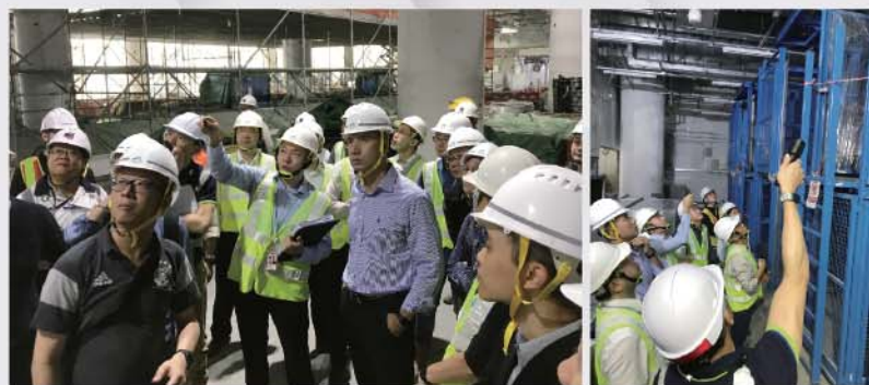
機場擴建工程課人員和機場管理局人員到三跑道系統工程地盤視察相關消防裝置和設備。

為配合粵港澳大灣區發展，機場擴建工程課會繼續調配資源以應付工程不同時期的審批及驗收消防裝置的需要，全力配合第三跑道系統工程進度。