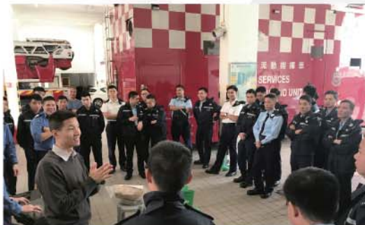
消防處人員介紹危害物質專隊的常用工具。

有見及此，消防處新界東區於2月至3月期間邀請警務處新界南衝鋒隊到沙田消防局舉行四場經驗交流工作坊。工作坊除介紹日常消防工作外，亦特別介紹沙田消防局的危害物質專隊，包括專隊的組成、處理危害物質的方式、實戰經驗分享和工具介紹等。警務處衝鋒隊成員對專隊的工作深感興趣，踴躍發問，和與會者互相交流意見，氣氛熱烈。