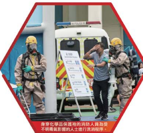
身穿化學品保護袍的消防人員為受不明毒氣影響的人士進行洗消程序。