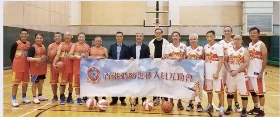
▶ 處長李建日及副處長梁偉雄主持籃球賽開球禮。

為推動退休消防人員持續健康生活，互助會分別於3月29日和30日在紀律部隊人員體育及康樂會舉辦首次籃球及足球友誼比賽，約70名會員參加。當中最年長的參加者是83歲的前高級消防區長宋修文。處長李建日、副處長梁偉雄，以及前處長黎文軒均應邀擔任主禮嘉賓。