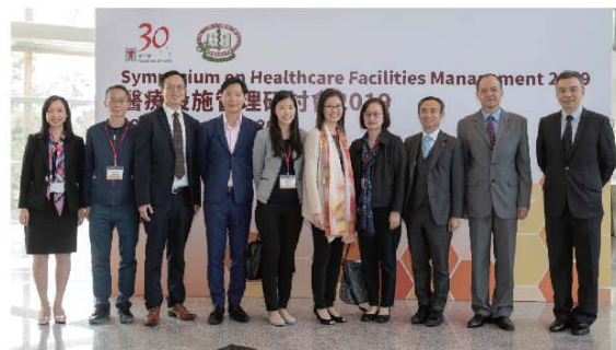
牌照及審批總區消防總長梁冠康(右二)及副消防總長黃鎮業(右一)和與會人士合照。

牌照及審批總區早前應邀出席衛生署舉辦的「醫療設施管理研討會2019」，聯同食物及衛生局、衛生署、屋宇署的代表，向與會的醫護人員及私營醫療機構營辦者介紹有關醫療設施管理的法例和規定。時任高級消防區長(政策課)胡麗芳以「私營醫療機構的消防安全」為題，講解應如何作出風險評估及消除火警危險隱患，並回應在場人士提問，以加深他們對私營醫療機構消防安全的認識。