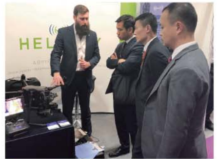
參展商展示不同的反恐裝備和技術。

數百間參展商展示不同的反恐裝備和車輛、危害物質檢測儀器，以及以虛擬實景技術作火警調查訓練的設備；英國各部門亦進行多場不同的反恐演練，包括模擬處理危害物質，展示各單位的反恐能力和專業水平。