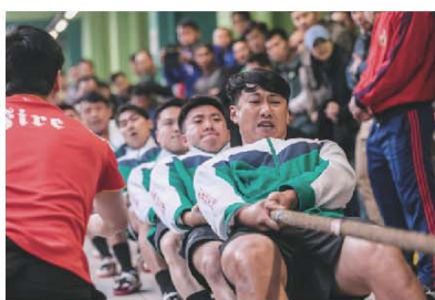
▶ 新界總區拔河隊後來居上，重奪陸運會總區際拔河比賽冠軍。

決賽對手是宿敵——曾奪得多次冠軍的港島總區。比賽過程非常緊張刺激，雙方爭持激烈。新界總區先輸一局，但隊員沒有氣餒，在同事及親友的大力打氣下，最終以二比一反勝，重奪失落的總區冠軍。獲勝的一刻，大家都十分雀躍和激動，港島總區和其他總區的隊伍亦紛紛送上祝賀，展現「比賽第二，友誼第一」的體育精神。