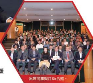
出席同事與江Sir合照。