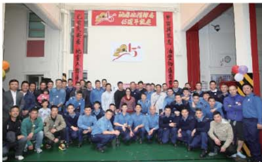
油麻地消防局於1974年(甲寅年)開局，居民代表贈送的對聯「甲寅與眾志油豐物盛忠有賴；己亥定安居 地覆人傑永留情」一直懸掛在局內。

逾百名嘉賓於3月9日出席油麻地消防局建局45週年誌慶。助理處長(九龍)羅紹衡博士致辭時，細數70年代至今該局參與的觸目救災事故，包括2016年的油麻地果欄三級火警，對駐守人員的努力予以肯定。