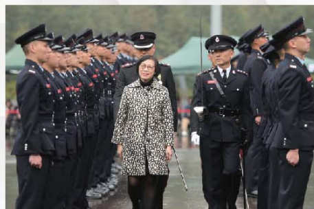
食物及衛生局局長陳肇始教授出席消防及救護學院舉行的第185屆結業會操。

食物及衛生局局長陳肇始教授在3月14日出席在消防及救護學院舉行的第185屆結業會操，檢閱25名消防隊長、61名消防員和44名救護員。她致辭時讚揚消防處努力不懈，精益求精，廣受市民愛戴。處方在救災之餘，亦不斷推展防災和宣傳教育工作，銳意加強市民的應急準備意識，讓他們面對危難或突發事故時知所應對。