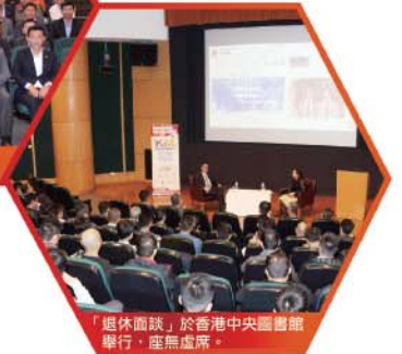
「退休面談」於香港中央圖書館 舉行，座無虛席。