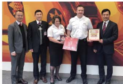
代表團到訪倫敦消防隊總部，與當地同業交流。

代表團亦藉此機會到訪倫敦消防隊總部，雙方就應急準備和教育、社交媒體運用、反恐情報收集、大型事故處理、防火和樓宇巡查等多方面作深入交流。