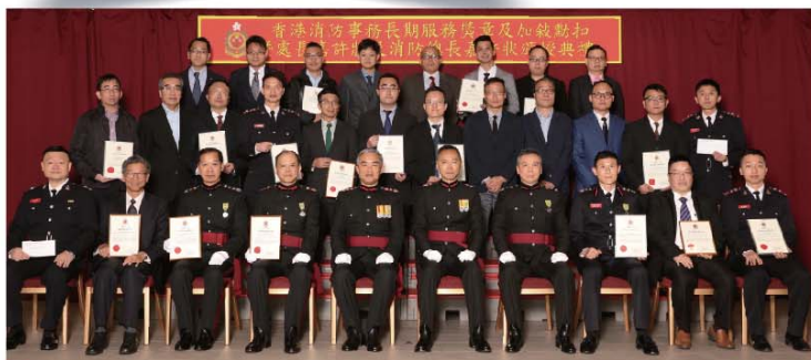
處長李建日(前排左五)、副處長梁偉雄(前排左六)和獲獎同事合照。

處長李建日、副處長梁偉雄及首長級人員，出席2月25日在尖沙咀消防局舉行的「消防處處長暨總長嘉許狀頒授典禮」，嘉許港珠澳大橋工程消防驗收的團隊。