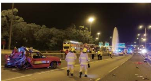
肇事的士車尾被撞至變形，零件散落一地，救援人員爭分奪秒拯救傷者。