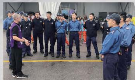
消防處、其他部門和主辦單位人員商討處理事故的策略。