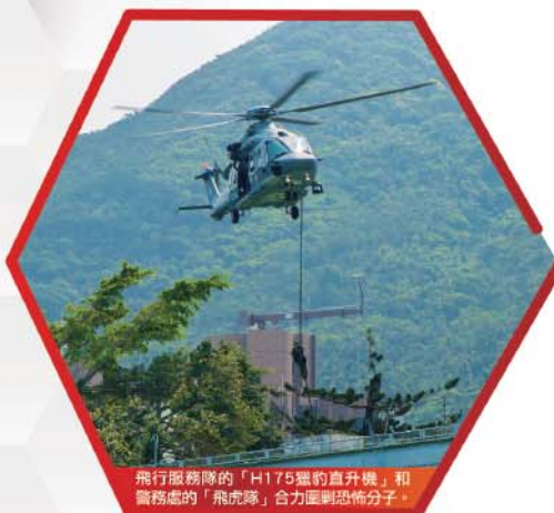
飛行服務隊的「H175獵豹直升機」和警務處的「飛虎隊」合力圍剿恐怖分子。