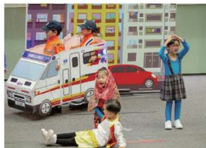
保良局金幼幼稚園憑著別具心思的佈景造型及貼地動聽的歌曲，奪得冠軍。

救護四格漫畫設計比賽(小學初級/高級組別)和救護宣傳短片創作比賽(中學組別)的頒獎禮亦於同日舉行，同學們的創意及畫工均得到評判團的高度評價。