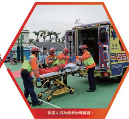
救護人員為傷者治理傷勢。