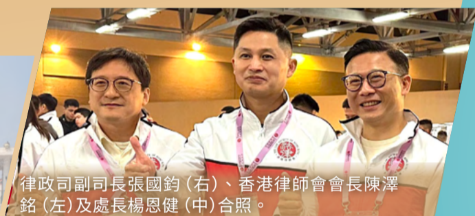
律政司副司長張國鈞(右)、香港律師會會長陳澤銘(左)及處長楊恩健(中)合照。

主辦單位更邀請到律政司副司長張國鈞、香港律師會會長陳澤銘、處長楊恩健、副處長(行動)黃鎮業和到土耳其協助救災的特區救援隊指揮官于文陽參與營火晚會，與一眾學生分享他們的工作經驗和價值觀。