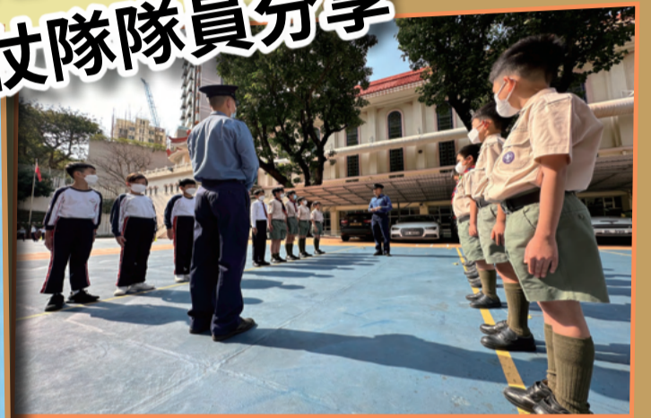
消防處儀仗隊隊員教授小學生中式步操及升旗禮儀。

我在二〇二一年十二月報名加入消防處儀仗隊，與一眾學員由零開始，接受由中國人民解放軍駐港部隊三軍儀仗隊教授的中國式步操訓練，學習軍姿、步操動作、持指揮刀的姿勢和步法等技巧，以及以中國式步操進行升旗儀式。完成訓練及通過考核後，我正式成為儀仗隊的一員，與來自不同單位的隊員在休班時進行恆常操練。經過反覆練習及修正，動作愈見精準、整齊，隊員間亦建立了默契和團隊精神。