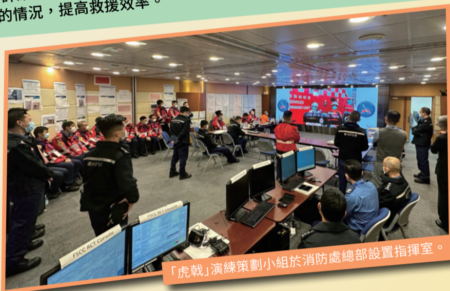
「虎戟」演練策劃小組於消防處總部設置指揮室。

演練其中一個目的是測試部門對外發布信息的能力。演練策劃小組發布模擬新聞，當中部分內容包含誤導性資訊，公眾安全及傳訊課須根據事故發展，適時向公眾發布特別通知及澄清信息。演練亦加入傳媒簡報環節，安排模擬記者到各演練場地進行採訪，藉此加強前線指揮人員應對傳媒的能力。