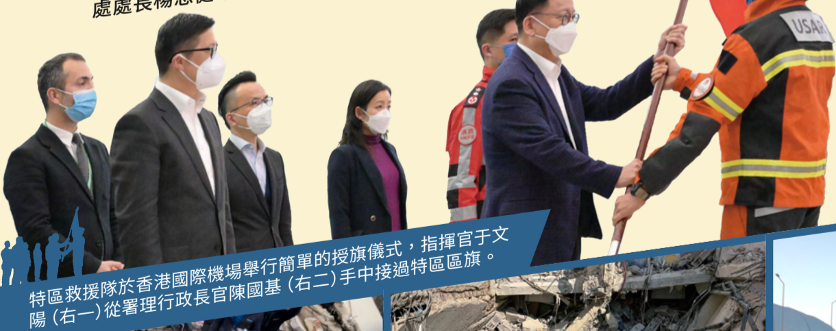
特區救援隊於香港國際機場舉行簡單的授旗儀式，指揮官于文陽（右一）從署理行政長官陳國基（右二）手中接過特區區旗。