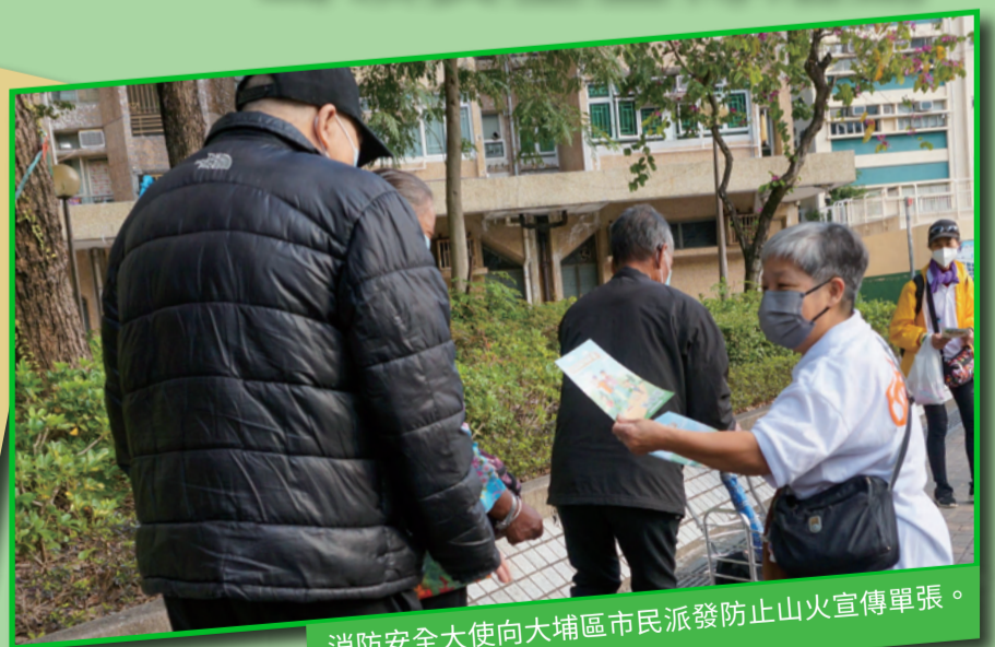
消防安全大使向大埔區市民派發防止山火宣傳單張。

大埔區消防安全大使名譽會長會聯同消防安全大使於一月十七日舉辦防火宣傳活動，在區內派發宣傳單張，加強市民對防止山火及山嶺活動的安全意識。大埔消防局人員亦向消防安全大使分享他們進行滅火和救援任務時的難忘經歷，並透過問答遊戲及創意比賽環節，讓各大使了解消防處最新資訊。