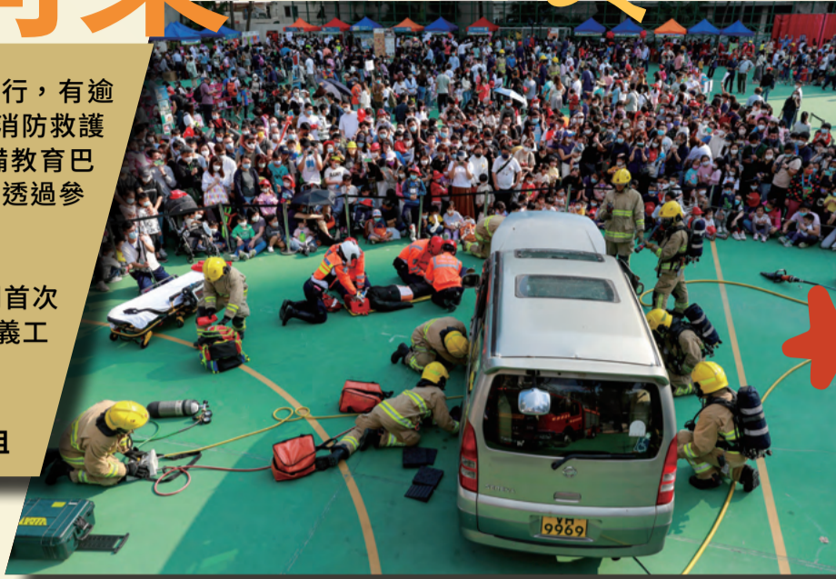
▲ 大批市民觀賞「大埔區防火嘉年華」的消防操練示範。

薄扶林消防局及救護站在二月十二日舉辦了開放日，有賴南區消防安全大使名譽會長會支持，加上各同事悉心籌備，讓活動順利完成。當日我們設有消防車及救護車工具展覽、滅火救援行動及火警調查犬工作示範等大型項目，令市民認識消防處的工作之餘，亦能了解防火及應急知識。