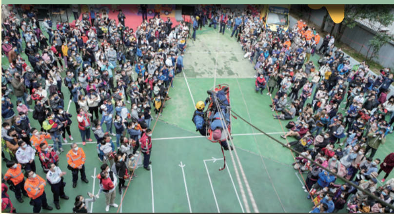
▲ 港灣消防局開放日中，人員向市民示範用於攀山拯救的「高置繩」技術。