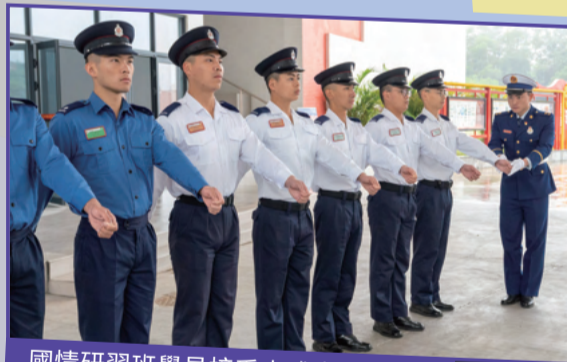
國情研習班學員接受中式步操訓練。

消防及救護學院於三月二十八日派出42名教官及學員，前往廣東省消防救護總隊轄下廣州國家陸地搜尋及救護基地參與國情研習班，加深屬員對國家歷史和發展，以及國家消防救護力量的認識。在為期三日的研習班中，學員參與了救援技術交流、專題國情研習，及中式隊列步操訓練等，獲益良多。部門期望國情研習班的安排可恆常化，成為學員基礎訓練課程，讓更多學員深入認識國情與國家歷史文化，進一步加強培養愛國情懷，同時為兩地消防部門的交流及緊密協作奠下穩固基礎。