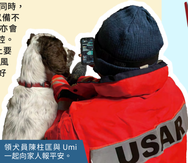
領犬員陳柱匡與 Umi 一起向家人報平安。

令我印象最深刻的是二月十三日的行動，當日我們進行搜索時，突然聽到附近瓦礫下有人高呼“ambulance”，我們隨即前往查看，發現有兩母女被困瓦礫下。我們立即把她們救出，可惜小女孩已離世，與母親天人分隔。