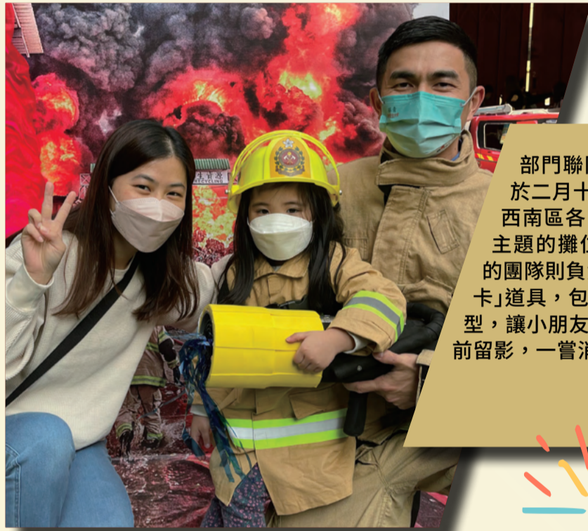
▲ 參與青衣消防局開放日的同事與家人於「3D 攝影區」合照留念。

部門聯同葵青區消防安全大使名譽會長會於二月十六日舉辦青衣消防局開放日。新界西南區各同事踴躍支持，竭盡心思製作不同主題的攤位遊戲，宣傳消防安全信息。我們的團隊則負責「3D 攝影區」，製作了不同的「打卡」道具，包括發光喉筆、大型切割器及車輛模型，讓小朋友穿上救火衣在模擬火警現場佈景板前留影，一嘗消防員的使命感。