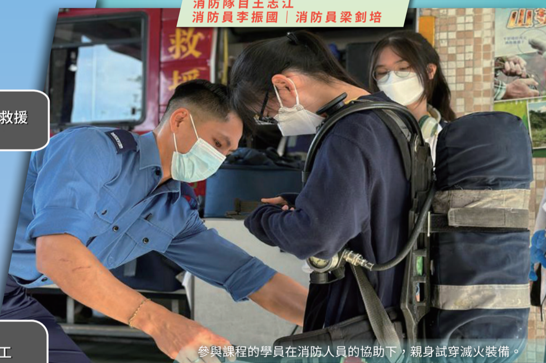
參與課程的學員在消防人員的協助下，親身試穿滅火裝備。

透過訓練營，我深深感受到消防人員的無私和無畏。他們憑着對工作的熱誠和服務社會的使命感，在危難中拯救市民，令我十分佩服和尊敬。