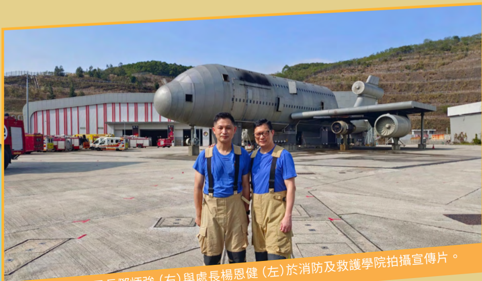
保安局局長鄧炳強 (右) 與處長楊恩健 (左) 於消防及救護學院拍攝宣傳片。

拍攝期間，局長一展其親民及「貼地」風格，學習各種滅火及救援技巧。他更穿起黃金戰衣、揸上呼吸器，跟處長一起參與一系列模擬滅火救援操練，讓市民透過社交媒體認識到消防員及救護員的基礎訓練。