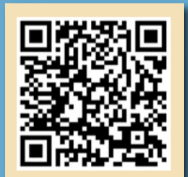
即睇「公務員防貪要訣」

儘管「款待」並非利益，接受款待不會抵觸《防止賄賂條例》，不過，如接受頻密及奢華的款待便容易欠下人情，引致執行職務時出現尷尬或未能客觀處事，甚至有機會出現利益衝突。另外，如果人員以公職身分出席宴會而毋須支付分毫，同場又有抽獎環節，則應考慮放棄參加抽獎，或把獎品交回大會再另行抽出幸運兒。如果這樣做會引起尷尬，有關人員應按部門首長根據公務員事務局通告第4/2007號所載規定，決定如何處置獎品。