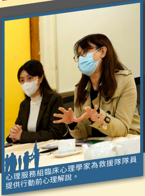
心理服務組臨床心理學家為救援隊隊員提供行動前心理解說。

救援隊於二月十日凌晨抵達哈塔伊省營地駐紮並與國家救援隊會合，同日展開搜救行動。救援隊分為多個小隊連日進行搜救，並分別於二月十一日及十三日，於瓦礫堆下成功救出三名及一名生還者。