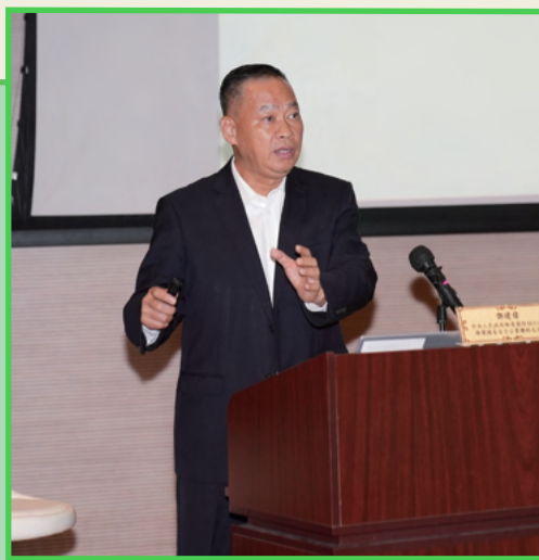
中央人民政府駐香港特別行政區維護國家安全公署聯絡局局長鄧建偉講解「一國兩制」與國家安全的關係。

招聘、訓練及考試組會繼續加強人員培訓，特別是對國家《憲法》、《基本法》和國家發展的認識。