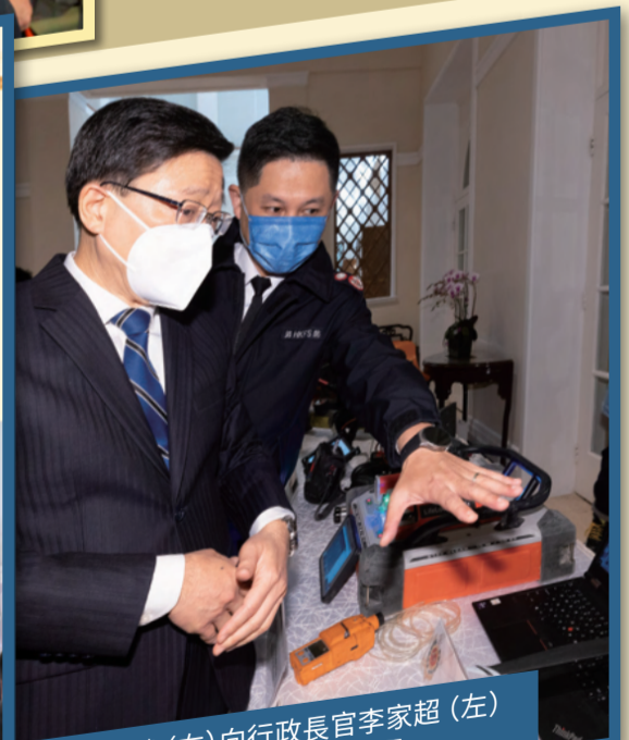
處長楊恩健(右)向行政長官李家超(左)介紹於災區使用的各種救援工具。