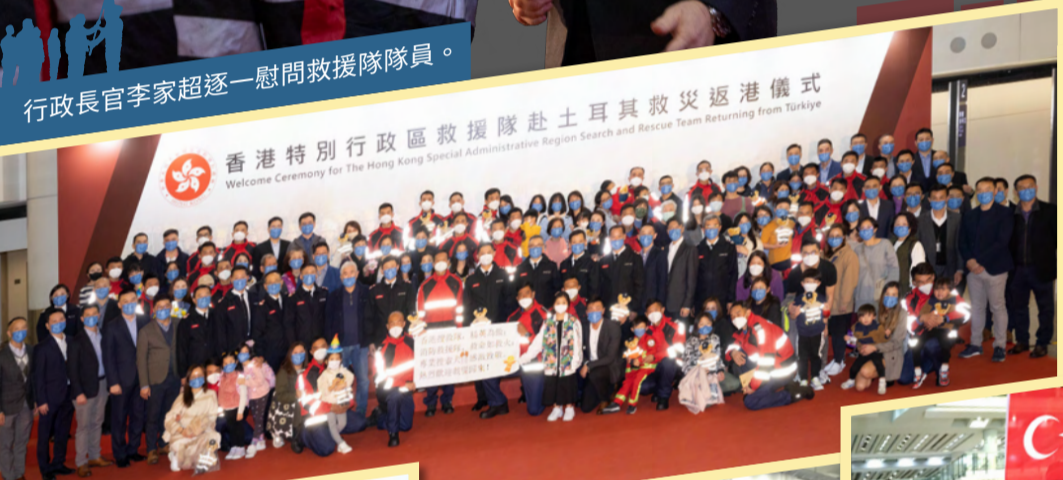
行政長官李家超逐一慰問救援隊隊員。