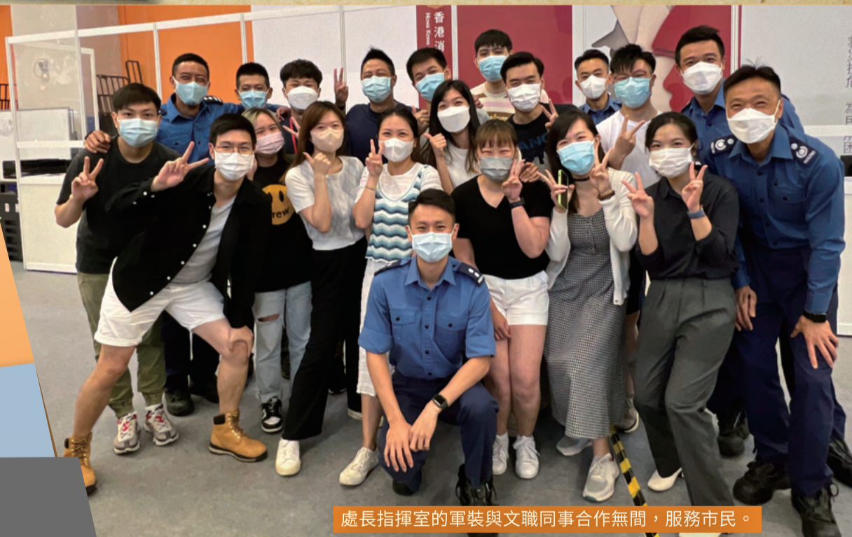
處長指揮室的軍裝與文職同事合作無間，服務市民。

為更有效應對第五波疫情，消防處於去年二月四日啟動處長指揮室，負責統籌指揮、監察資源運用及安排非緊急確診患者前往隔離或治療設施等工作。隨着疫情放緩，處長指揮室於今年二月二十一日正式停止運作，結束歷史任務。疫情期間，指揮室共處理超過176萬宗個案，並安排超過22萬名確診者前往社區隔離設施。縱使工作量排山倒海，指揮室上下仍堅守崗位，務求盡快處理所有個案。受助市民的每一句道謝，都為同事帶來鼓舞和感動。疫情已經告一段落，但消防處會繼續秉持「救災扶危，為民解困」的使命，站在最前線，守護每一位香港市民。