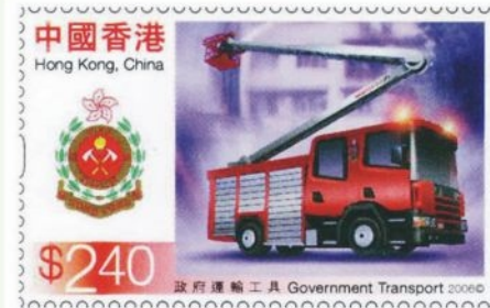
● 油壓升降台郵票 A special stamp featuring a hydraulic platform