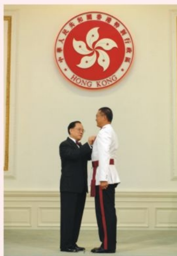
● 消防總長張賢椒 CFO Cheung Yin-chiu receives FSDSM