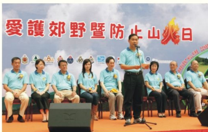
● 處長在防止山火開幕禮上致辭 Director Kwok speaks at the launch ceremony of the Hillfire Prevention Publicity Campaign 2006

他表示要達到防止山火和愛護郊野的目標，除了有賴政府各個部門努力宣傳和教育外，更重要的是市民積極參與及支