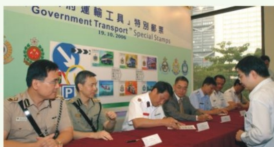
● 港島消防總長朱文駿為集郵人士在首日封簽名 CFO(H) Chu Man-chun signs First Day Covers for philatelists

郵政處當日舉行一個郵票發行儀式，郵政署長譚榮邦聯同六個紀律部隊代表為集郵人士在首日封上簽名留念。