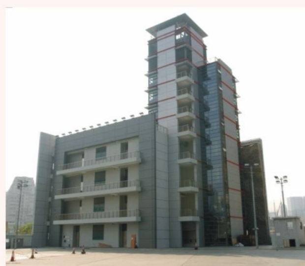
● 西九龍拯救訓練中心 West Kowloon Rescue Training Centre

拯救訓練中心位於西九龍渡華路八號，中心樓高九層，從地下至三樓設有先進救援及滅火訓練設施，另外五層作為救援訓練塔之用。中心內設有多種訓練設施，以加強消防人員處理各類火警和提高人員在不同災難事故中的應變技巧。這些設施包括模擬隧道及管道訓練，「迷宮」式搜索訓練室，以及模擬酒店、住宅、工廠及卡拉OK場所的火場環境實火訓練。