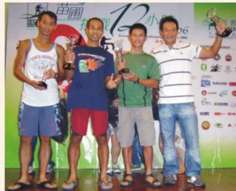
● 野外活動組代表隊 F.S. Team comes top in the Sowers Action Challenging 12 Hours