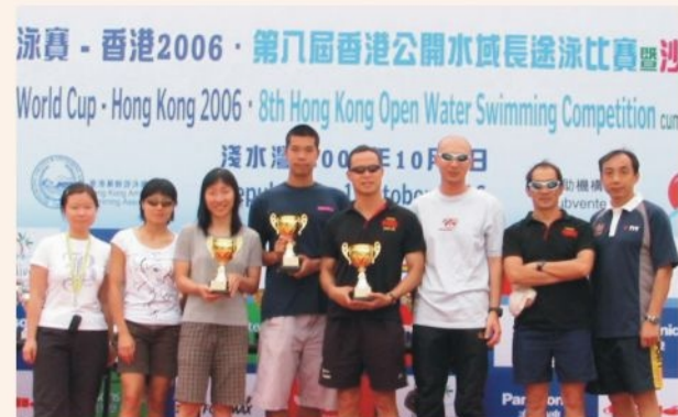
● 消防泳隊 F.S. Swimming Team wins the Overall Championship in the 2006 HK Open Water Swimming Competition