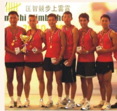
● 跑樓梯比賽獲獎隊員 The champion F.S. Team runs up the 75-storey Central Plaza in five minutes and 27 seconds