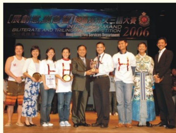
● 處長頒獎予香港總區參賽代表 Hong Kong Command wins the Inter-command Biliterate and Trilingual Competition

比賽分為「即興演講」、「即興處境短劇」及「才藝表演」三個環節。各總區挖空心思，有備而來，演出精彩絕倫。參賽代表都表現出極高的語文水準，而且想像力豐富，所構思的橋段展現無