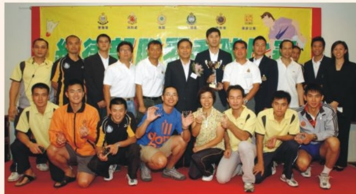
● 消防羽毛球隊 F.S. Team snatches 1st Runner-up in the Disciplined Services Badminton Tournament