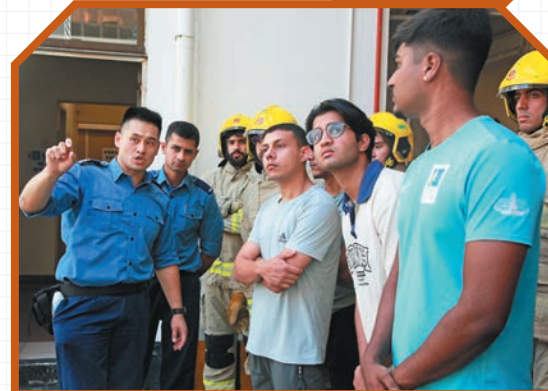
▲消防人員向參加者介紹消防局的日常工作。