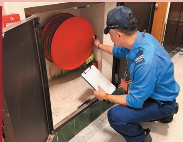
消防設施監督課成立特別執法隊，主動巡查目標樓宇的消防裝置及設備。

截至今年十月，消防設施監督課合共巡查了全港超過4,000幢目標樓宇，並向沒有為處所內消防裝置或設備安排年檢的相關擁有人提出2,255宗檢控，成功檢控個案涉及多個地區。這些執法成果充分體現部門對樓宇消防安全零容忍的堅定立場，同時提醒全港業主必須嚴格履行法定責任。