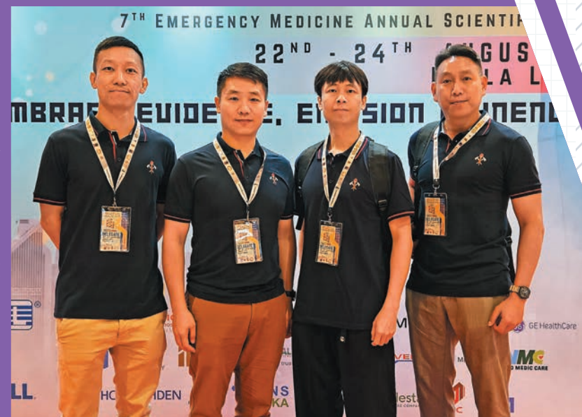
►消防處代表團出席於馬來西亞吉隆坡舉行的國際急診醫學研討會。