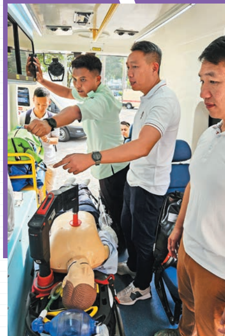
▲消防處代表團登上吉隆坡的救護車，並與當地的救護人員深入交流。

除學術研討外，代表團亦獲安排參觀吉隆坡的緊急醫療反應服務中心（MERS 999），深入了解其統一接收、分級調派的運作模式，以及透過即時交通數據完善救護車部署策略，以應對都會區的交通挑戰。團隊亦考察了當地救護車的設備配置，並就車上醫療設備與當地人員交流心得。