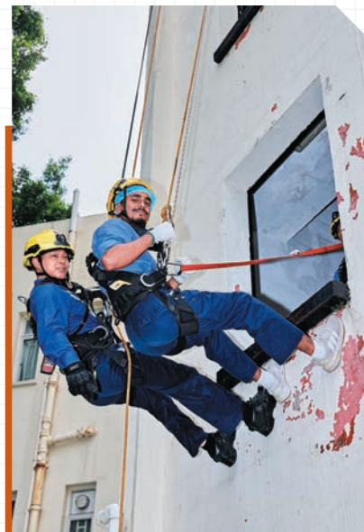
▶參加者親身體驗高空拯救工作。