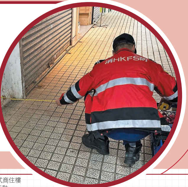
分區公眾安全隊主動巡查舊式商住樓宇，並針對火警危險採取執法行動。

DPST自成立以來成效顯著，截至十月三十一日，四隊DPST共巡查了698幢目標樓宇，就火警危險事宜發出1,626張「消除火警危險通知書」，並提出17宗檢控。