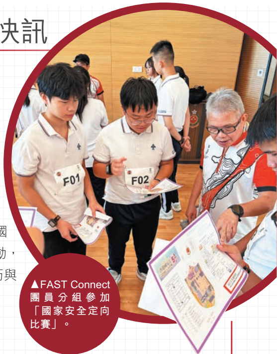
▲FAST Connect團員分組參加「國家安全定向比賽」。

七月二十六日，約200名團員於消防及救護學院參加「國家安全定向比賽」。活動透過結合國家安全教育與定向運動，加深團員對國家安全的認識，同時鍛鍊體能、地圖導航技巧與團隊合作精神。