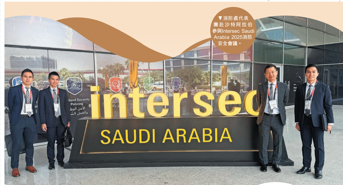
▼消防處代表團赴沙特阿拉伯參與Intersec Saudi Arabia 2025消防安全會議。

總括而言，推行「註冊消防工程师計劃」能在保障消防安全的同時，推動消防工程專業的發展，標誌着消防安全管理的重要里程碑。