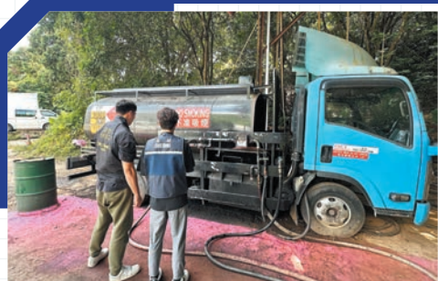
▲部門自九月起展開代號「油擊」的跨部門執法行動，打擊非法燃油轉注活動。

部門一直致力打擊非法燃油轉注活動，以守護社區的消防安全。自九月起，部門展開跨部門行動及推行新措施，務求全面打擊相關違法活動。