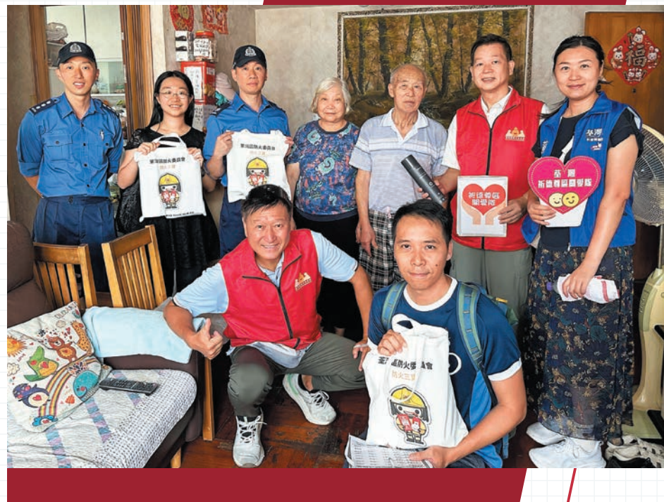
▼消防人員聯同地區力量探訪荃灣區內多幢舊式樓宇及寮屋區，向近百戶長者家庭派發「防火三寶」。

新界南分區聯同荃灣民政事務處、荃灣區防火委員會、社區應急先鋒名譽會長會及關愛隊，今年暑假在荃灣區開展一系列防災應急活動，包括探訪長者並派發「防火三寶」、舉辦消防及救護學院導賞團，以及為關愛隊提供「消防處社區應急先鋒」訓練，進一步強化社區的抗災能力與消防安全意識。