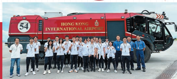
▲FAST Connect團員深入了解機場北消防局日常的運作。