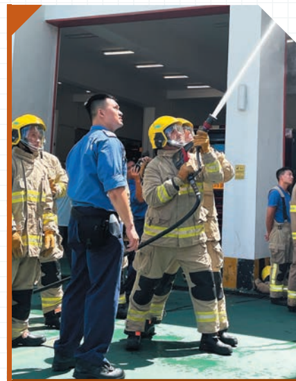
▶參加者親身體驗穿著「黃金戰衣」及使用消防喉筆。

八月十三日，部門舉辦「九龍南區尖沙咀消防局工作體驗日」，讓少數族裔青少年親身體驗消防人員的日常工作，學習消防安全知識；更讓他們了解最新的投考資訊，從而鼓勵有志之士加入部門。