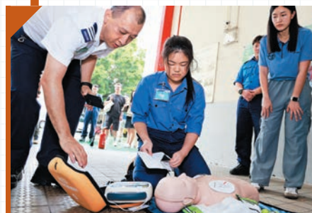
▲參加者學習使用自動心臟除顫器。

六月二十八至二十九日，部門於荔枝角消防局舉辦「九龍西區消防及救護工作體驗日2025」，讓一眾少數族裔年輕人、中學生及消防及救護青年團（FAST Connect）團員透過親身體驗，加深對前線消防及救護工作的認識，同時培養團隊精神並促進多元共融。