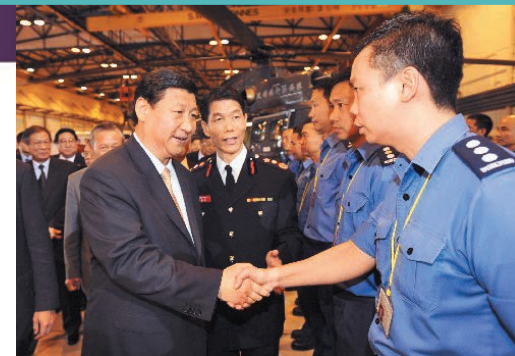
◀二零零八年七月，時任國家副主席習近平（前排左一）會見香港特別行政區參與汶川地震救援行動的特別搜救隊，並與時任助理消防區長、特別搜救隊隊長黃鎮業（前排右一）握手。

「我很感謝消防處帶給我31年精彩、有意義、又很有滿足感的消防生活；感謝部門提供很多培訓機會，令我有機會處理不同消防範疇工作。感謝我的上司、同事、工作伙伴，也很感謝我家人，為我的工作作出一些犧牲和配合。」展開退休前假期的黃鎮業，最後一次以副處長身分會見傳媒，以連番感謝總結他效力消防處的感受。