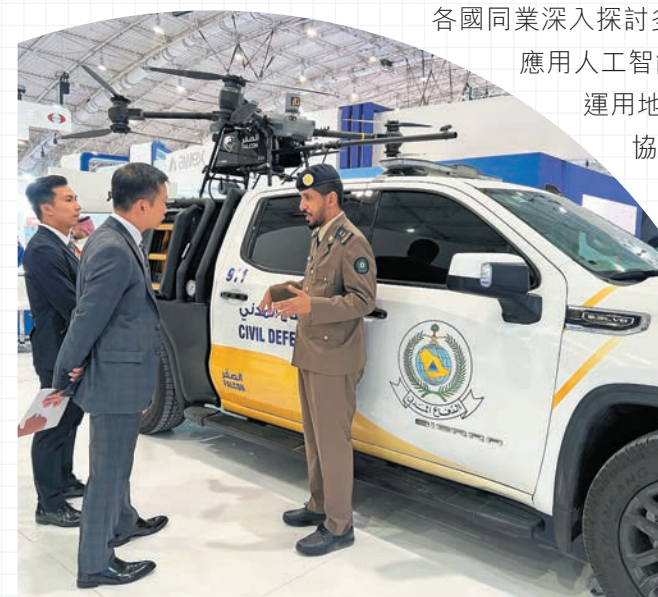
◀消防處代表團與沙特阿拉伯民防部隊探討應用無人機執行滅火救援任務的最新技術。