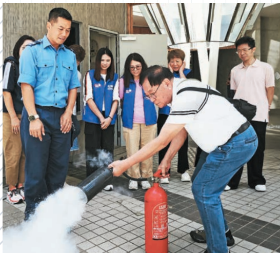
◀消防人員為荃灣區全數19隊「關愛隊」、近200名隊員提供「消防處社區應急先鋒」專業訓練。圖示參加者在消防人員指導下學習使用滅火筒。