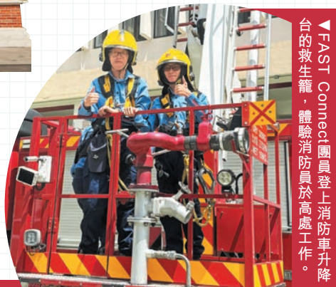
▲FAST Connect團員登上消防車升降台的救生籠，體驗消防員於高處工作。

八月十三日，多名團員齊集黃大仙消防局，親身體驗消防員的日常工作的，增強團隊合作及社會責任感。