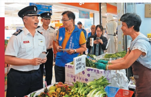
◀消防人員聯同沙田防火委員會和關愛隊上門探訪沙田禾輦邨長者，宣傳防火信息。