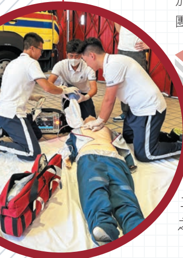
▲FAST Connect團員於救護站體驗救護工作。

20名團員於七月下旬參加為期四星期的「消防處工作體驗計劃」，在消防局、救護站、防火組及消防及救護學院等不同崗位實習，親身體驗部門前線及後勤工作，了解部門多元化的日常運作之餘，培養責任感與團隊精神。