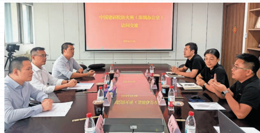
▲副消防總長（牌照及審批）倪楚豐（左二）率領代表團與中國建築科學研究院建築防火研究所人員進行深入交流。

此外，代表團實地考察「海上世界」，了解如何運用消防工程學設計，將具歷史價值的郵輪改建為綜合性娛樂休閒設施，既保留郵輪的原有風貌，又符合現代消防安全標準。