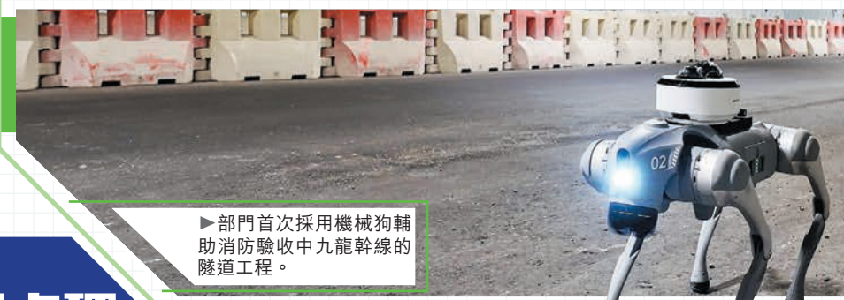
部門首次採用機械狗輔助消防驗收中九龍幹線的隧道工程。