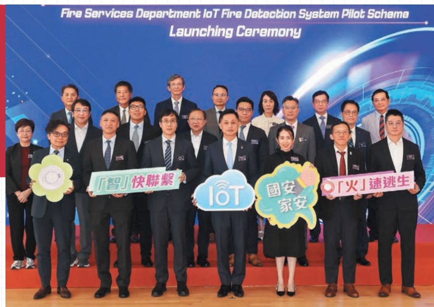
▲處長楊恩健（前排中）、副處長（公眾安全及機構策略）黃嘉榮（前排左二）與一眾嘉賓出席十月二十四日舉行的「物聯網火警偵測系統先導計劃」啟動禮。

部門會在先導計劃完成後總結經驗並評估成效，繼而研究將系統應用於七層或以上舊樓的技術可行性。這些較高層樓宇人口密集，火災風險更高，若能成功推行，將顯著提升更多舊樓的消防安全，令更多居民受益。