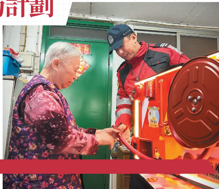
►消防人員教導長者如何使用消防喉轆。

由於計劃效果顯著，部門今年第一季開始逐步將計劃擴展至其他行動總區，與當區的長者中心和持份者攜手合作，共同延續「關愛共融」精神。