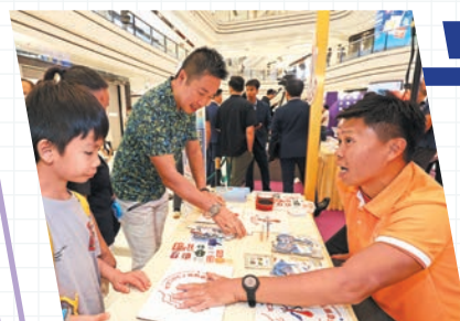
▲市民參與攤位遊戲，學習應急信息。