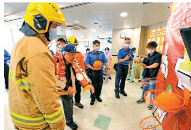
▲去年十一月十八日，部門到訪梨木樹松悅園耆欣護理院暨日間護理中心，向長者宣傳防火信息。