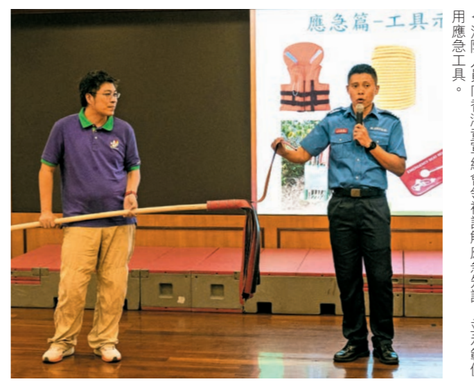
▲消防人員向香港童軍總會領袖講解應急知識，並示範使用應急工具。

香港童軍總會成為計劃下首個「認可培訓機構」，由部門培訓已具備應急知識的機構內領袖成為「社區應急先鋒」導師，再由這些導師培訓機構成員。香港童軍總會約120名領袖已於去年七至八月期間，完成由部門提供的專業導師訓練及救援技巧實習，至今他們已培訓約500名童軍成為「社區應急先鋒」。