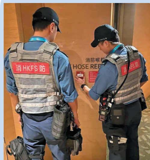
▲消防人員於比賽前檢查消防裝置及設備。