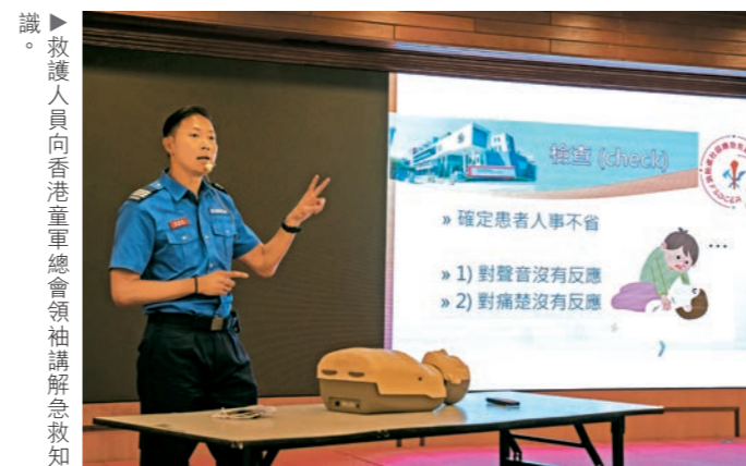
▲救護人員向香港童軍總會領袖講解急救知識。

部門與香港童軍總會去年十一月十四日舉行「積極公民」獎章系列「社區應急先鋒章」發布會，宣布將進一步推動童軍成員參與「消防處社區應急先鋒」計劃。為使計劃的訓練更貼合童軍需要，部門調整了課程模式，讓學員更易掌握應急知識、施行心肺復甦法及使用自動心臟除顫器等關鍵技能。