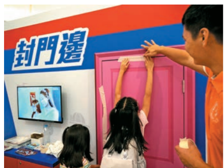
▲市民參與攤位遊戲，學習以膠紙封好門邊的正確方法。

在宣傳月期間，部門舉辦了一系列地區防災應急活動，包括嘉年華、消防局開放日及商場重點宣傳活動，向市民宣揚防災應急信息。