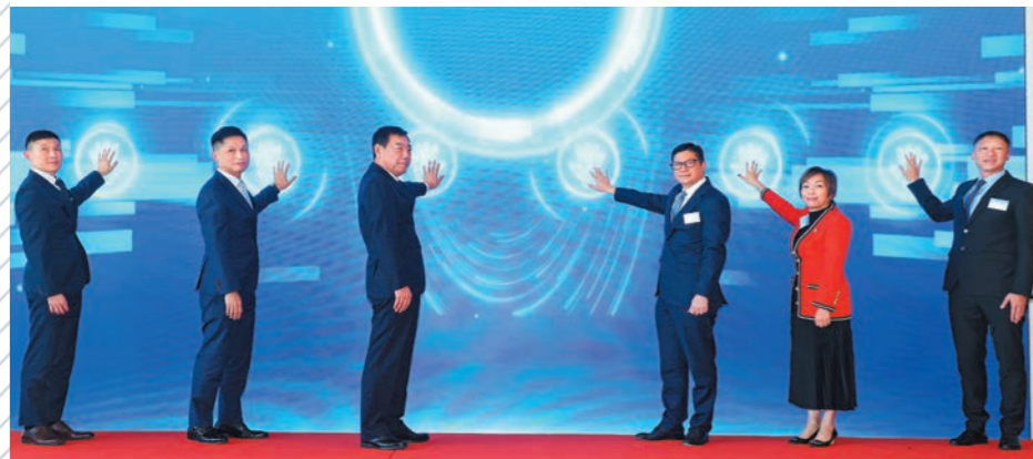
▲國家消防救援局副局長徐忠舜（左三）、保安局局長鄧炳強（右三）、消防處處長楊恩健（左二）、副處長（行動）陳慶勇（左一）、副處長（公眾安全及機構策略）黃嘉榮（右一），以及香港賽馬會董事龔楊恩慈（右二）於消防及救護學院主持國際水域救援技術交流會議開幕典禮。