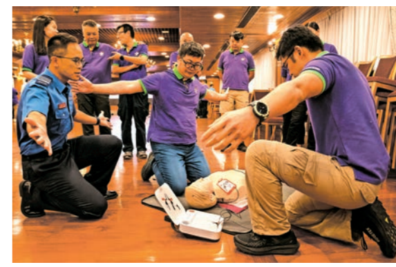
▲救護人員向香港童軍總會領袖示範施行心肺復甦法。