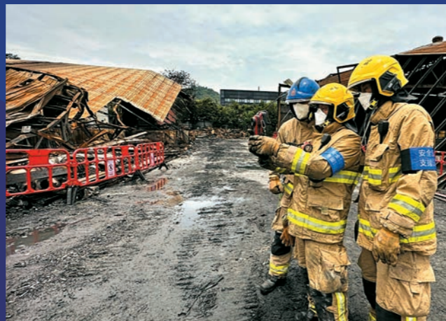
▲安全政策及合規組人員會於事故現場評估工作環境安全水平，並戴上藍色臂章以茲識別。

截止今年二月，安全政策及合規組曾於40宗不同類型事故中出動，分別為33宗火警（當中五宗屬三級或以上火警）及七宗特別服務（包括一宗飛機事故），協助現場主管制定行動策略並進行風險評估。