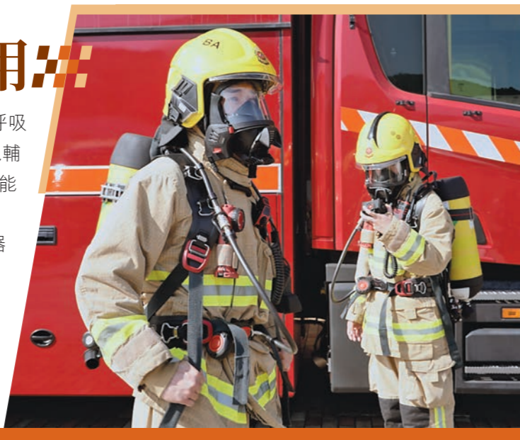
▲部門引入新呼吸器，並已全面啓用。

為使所有前線消防人員均能充分掌握新呼吸器的應用，部門去年十一月一日開始實施「啓用前並聯運作安排」，前線人員需要每天檢測新呼吸器，並使用新呼吸器進行日常訓練。部門將密切監察新呼吸器的使用情況，確保一切運作正常。