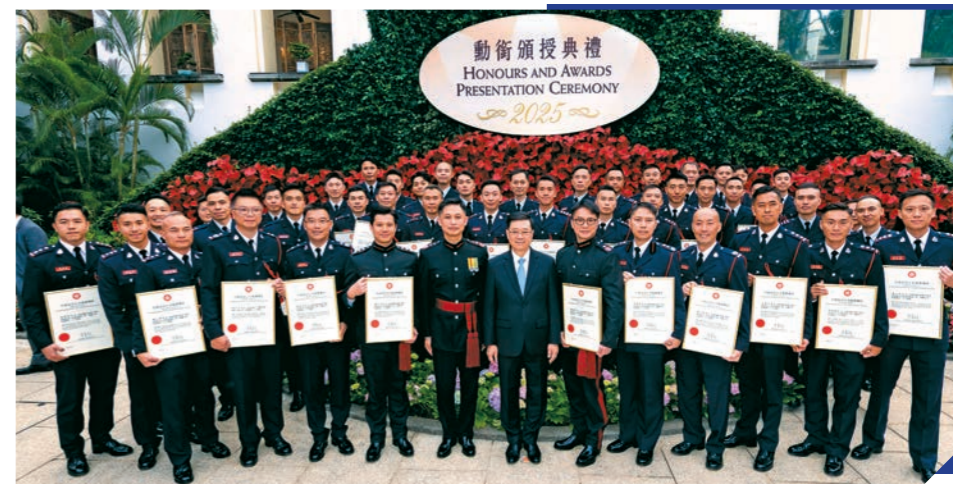
▲行政長官李家超（前排左五）於二零二五年度勳銜頒授典禮頒授勳銜及獎狀予56名消防人員，處長楊思健（前排左五）亦有出席。

二零二五年度勳銜頒授典禮於去年十一月十五日在香港禮賓府舉行，行政長官李家超在典禮上頒授勳銜及獎狀予56名消防人員，當中包括香港消防事務卓越獎章、香港消防事務榮譽獎章、行政長官社區服務獎狀及行政長官公共服務獎狀，以表揚他們為香港作出卓越貢獻，表現超卓。