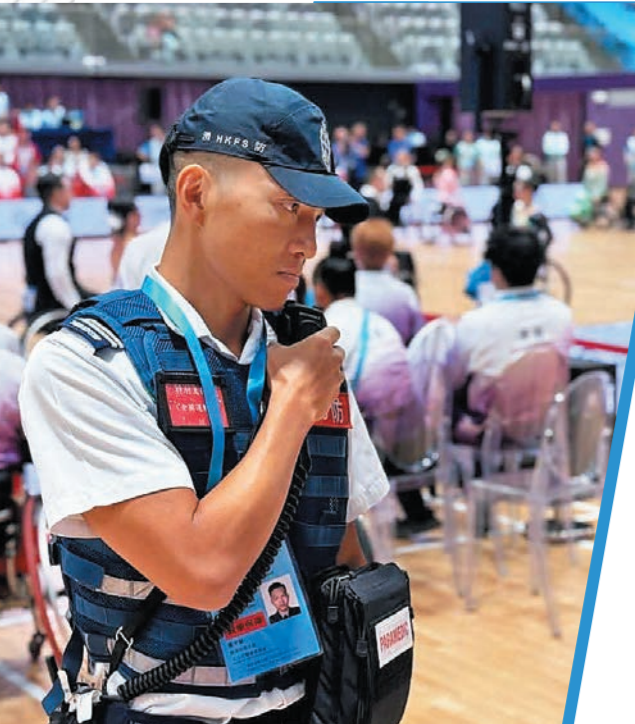
▲部門快速應變隊於比賽場地巡邏。

此外，部門亦積極參與各項準備工作，包括於各個比賽場館搭建期間全面檢查消防系統，檢視消防警報系統、自動灑水設備、煙霧探測器、滅火器配置等關鍵設施。部門更於賽事前多次巡查各場館，確保消防設備保持有效操作狀態，以及緊急逃生通道暢通無阻。