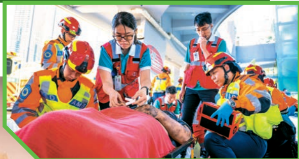
▶部門去年十月十五日聯同康樂及文化事務署、警務處、民政事務總署、民眾安全服務隊及醫院管理局（醫管局），在香港單車館舉行突發事故演習。圖示救護人員聯同醫管局醫護人員為傷者進行分流及處理傷勢。