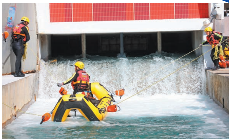
▲消防人員於消防及救護學院進行水域救援示範。

會議首兩天活動在香港舉行，讓參與者透過個人及團體實地訓練、救援工具展示及救援個案經驗分享等環節，交流水域救援技術和心得，並探討應用在所屬地區的可行性。隨後兩天參與者前往潮州，參觀國家東南區域應急救援中心，了解國家如何利用先進科技令救援技術和訓練更臻完善，並到市內水浸風險較高的地點視察，了解國家在水浸事故中的應對策略。