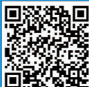
《消防處二〇二五年工作回顧小冊子》

在打擊非法燃油轉注活動方面，部門會繼續加強宣傳及公眾教育工作，並促進跨部門協調及持份者交流，以加強信息共享和情報整合；同時積極進行跨部門聯合執法行動，以提高執法效率及保障公眾安全。