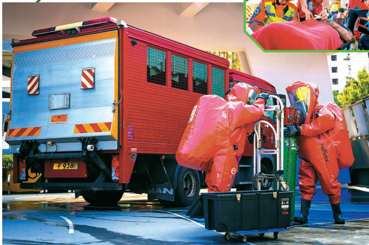
◀部門去年十月十五日聯同康樂及文化事務署、警務處、民政事務總署、民眾安全服務隊及醫院管理局，在香港單車館舉行突發事故演習。圖示危害物質專隊到場協助救援。