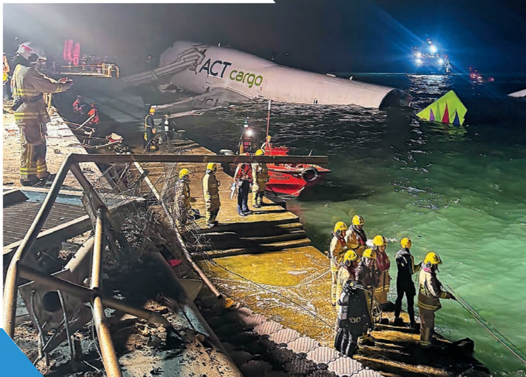
▲機場分區人員抵達事故現場展開救援行動。

部門機場分區立即展開救援行動，在確定涉事貨機四名機組人員的具體位置後，救援人員利用機上的逃生滑梯將他們救出。消防潛水員在離岸約五米外的海底發現墮海車輛，救出兩名被困車內的機場保安人員，惟他們最終不幸離世。