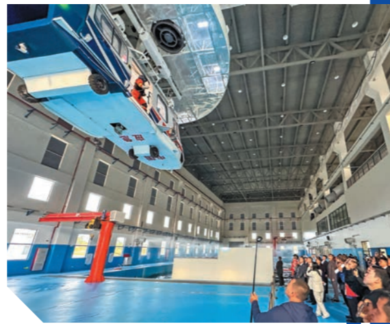
▲與會者參觀位於潮州的國家東南區域應急救援中心。