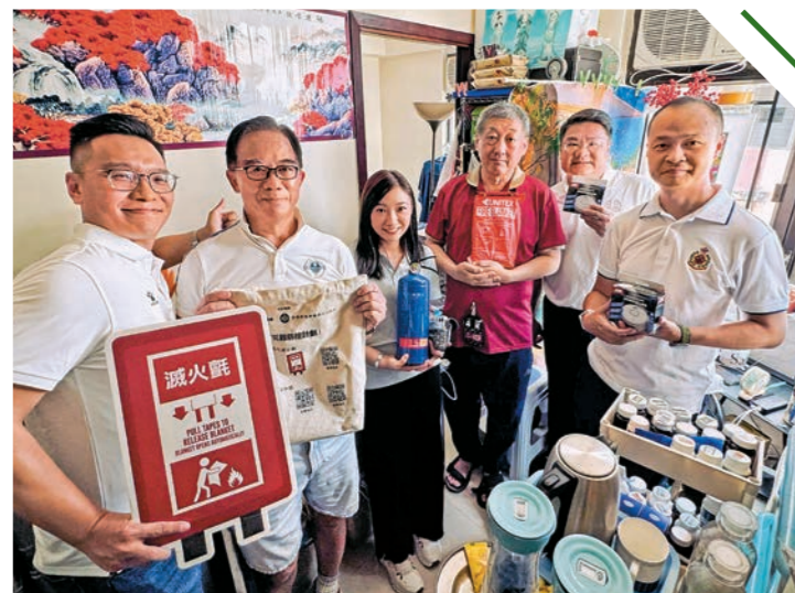
◀去年九月二十九日，部門聯同北區民政事務處、北區防火委員會及消防處社區應急先鋒名譽會長會（北區）探訪粉嶺聯和墟舊式樓宇的居民，向居民宣傳防火信息及派發「防火三寶」。