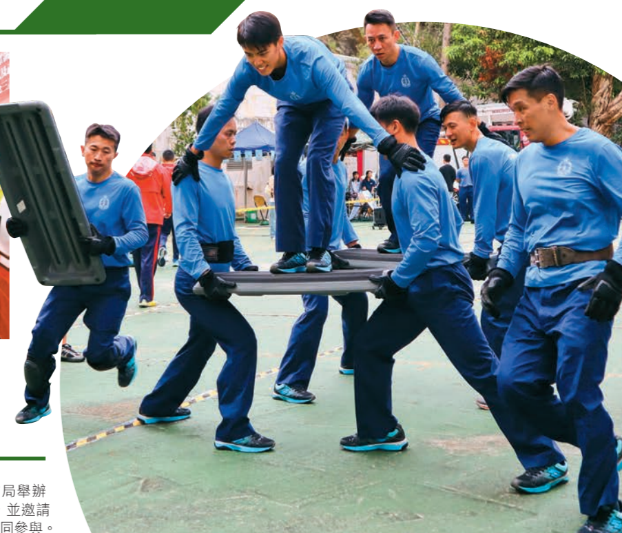
▶去年十一月七日，部門於石硤尾消防局舉辦「第五屆九龍西區消防鐵人競技大賽」，並邀請警務處、海關、懲教署及少數族裔團體一同參與。