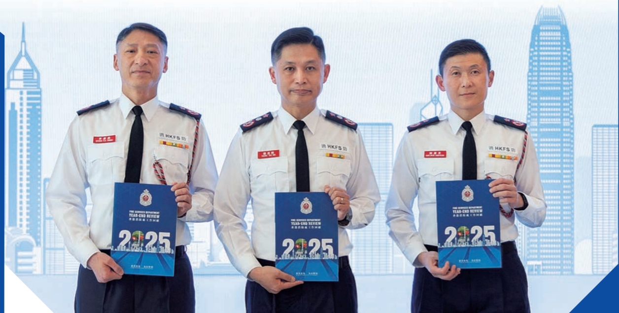
消防處於二月二十四日舉行年終回顧記者會。圖示消防處處長楊恩健（中）、副處長（行動）陳慶勇（右）和副處長（公眾安全及機構策略）黃嘉榮（左）。