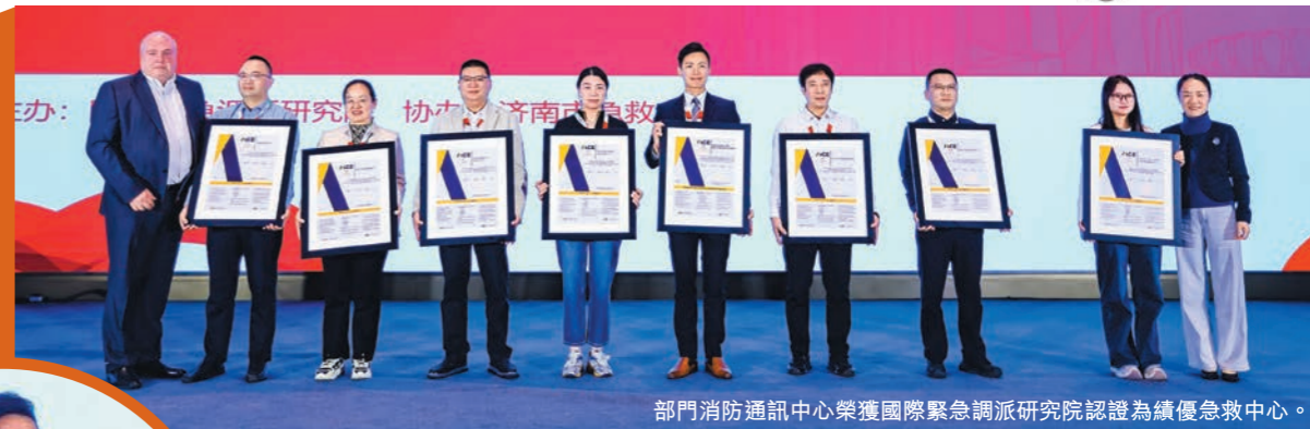
部門消防通訊中心榮獲國際緊急調派研究院認證為績優急救中心。