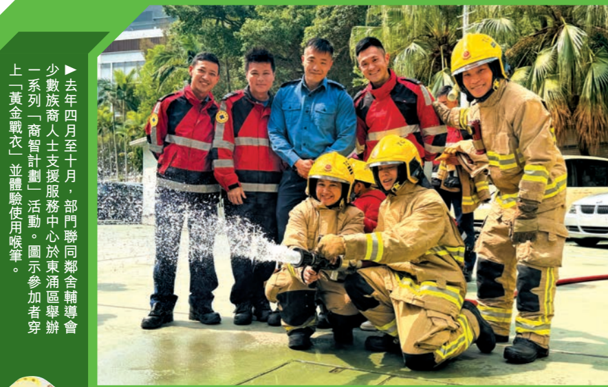
▶去年四月至十月，部門聯同鄰舍輔導會少數族裔人士支援服務中心於東涌區舉辦一系列「裔智計劃」活動。圖示參加者穿上「黃金戰衣」並體驗使用喉筆。