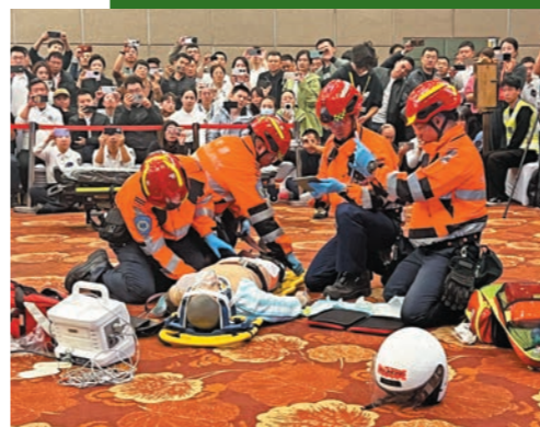
▶部門代表隊參與緊急創傷生命支持（ETLS）項目，模擬為傷者處理傷勢。

賽事之外，人員參與了大會安排的學術論壇，內容涵蓋醫療急救體系的建設與發展，以及社會救援體系中各部門的協作機制及實踐經驗等不同層面。人員亦參觀了醫療科技展及裝備展覽，並考察北京急救中心，實地了解120調度指揮中心的運作情況、救護車輛配置及相關裝備等，親身感受當地日常急救工作的專業與高效。