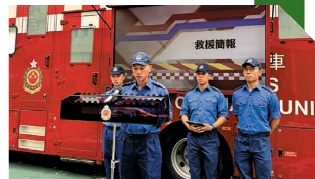
▶部門去年九月十七日在屯門消防局舉行新界北總區飛機事故桌上模擬演習。圖示消防人員在模擬救援簡報回應傳媒查詢。