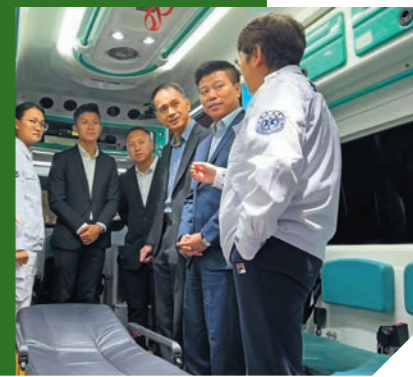
▼北京急救中心人員向部門代表團介紹當地救護車輛配置，分享實戰經驗。