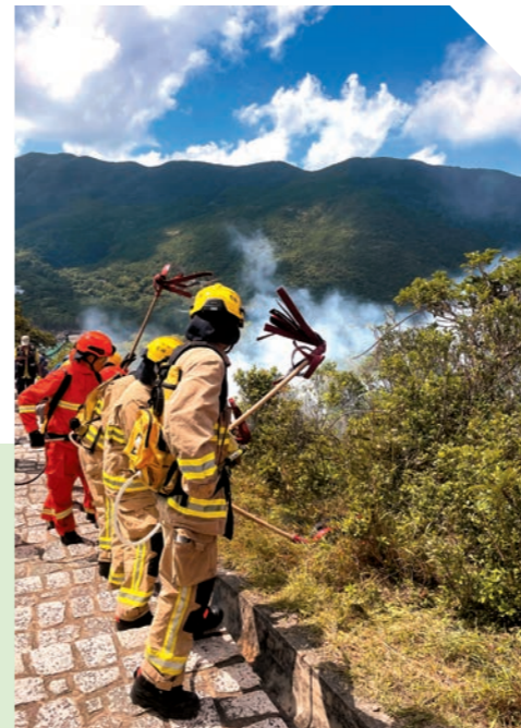
▲部門去年十月十五日聯同警務處、政府飛行服務隊、漁農自然護理署、醫療輔助隊、民眾安全服務隊、民政事務總署、社會福利署及醫院管理局，在港島大浪灣舉行年度跨部門山火及攀山拯救演習。圖示消防人員與相關部門進行滅火行動。