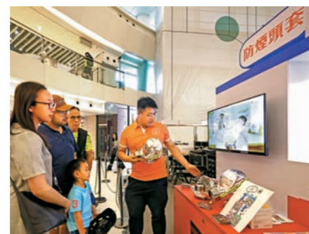
▲市民參與攤位遊戲，學習使用防煙頭套。