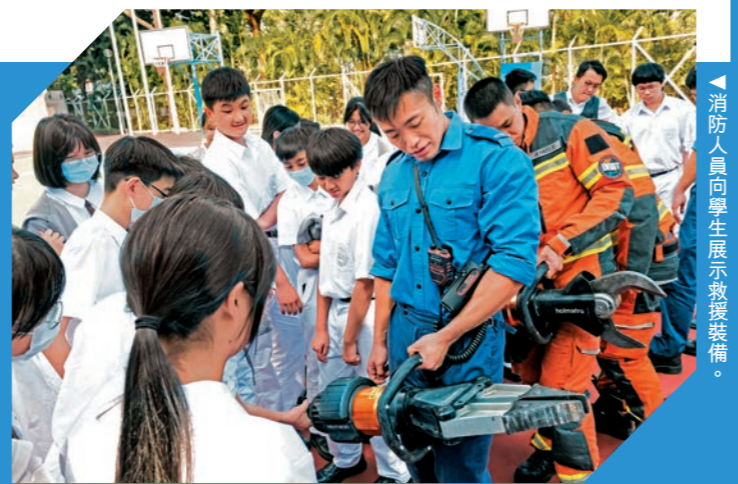
▲消防人員向學生展示救援裝備。

去年十一月十二日，部門派員到訪荃灣公立何傳耀紀念中學，向該校的FAST Connect團員及其他學生分享緬甸地震災區救援行動的經歷，並為他們介紹無人機和搜救犬，以及安排模擬火警體驗，讓他們進一步認識部門的工作與專業精神。