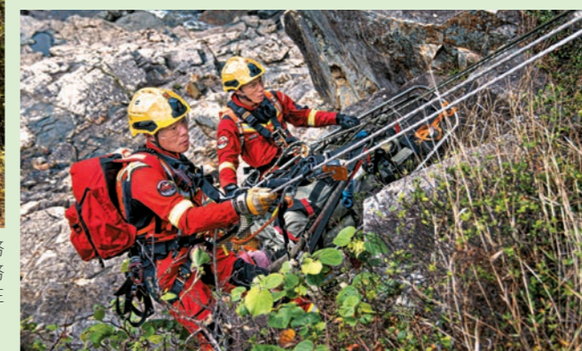
◀部門去年十月十五日聯同警務處、政府飛行服務隊、漁農自然護理署、醫療輔助隊、民眾安全服務隊、民政事務總署、社會福利署及醫院管理局，在港島大浪灣舉行年度跨部門山火及攀山拯救演習。圖示高空拯救專隊進行搜救行動。