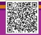
《維護國家安全條例》全文