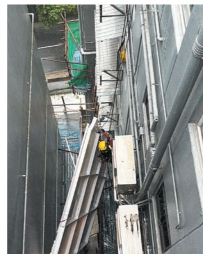
◀高空拯救專隊使用進階繩索技術成功固定構築物。

去年九月下旬，超強颱風「樺加沙」襲港，天文台曾最高發出十號颶風信號。在颱風來臨前，大澳消防局的休班人員主動聯絡及探訪區內長者及有需要協助的人士，並協助居民將電器搬至家中安全位置，減少意外發生和財產損失。另外，大澳消防局人員亦於區內做好預防水浸及防風措施，在低窪地區架設充足的救生繩索，並定時檢查岸邊水尺，作出評估和適當部署，提升救援效率。