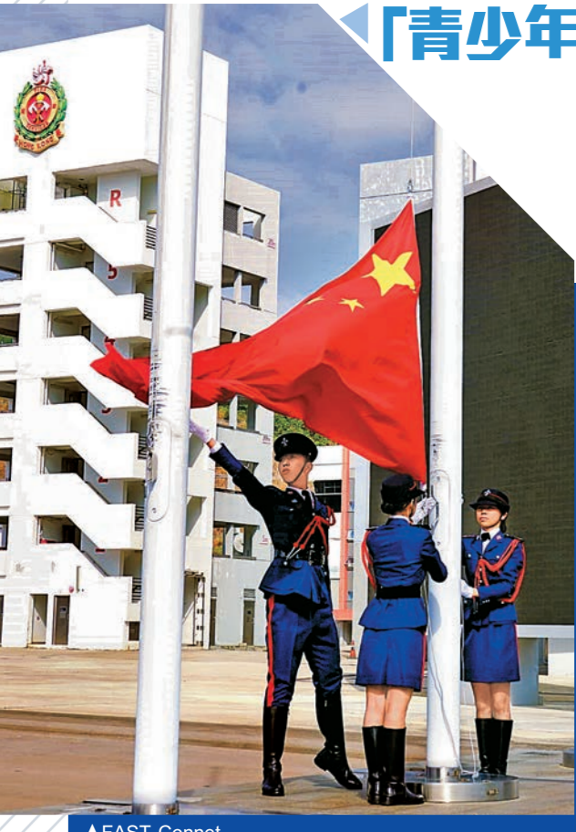
▲FAST Connect 團員參加「青少年制服團隊升旗比賽2025」。