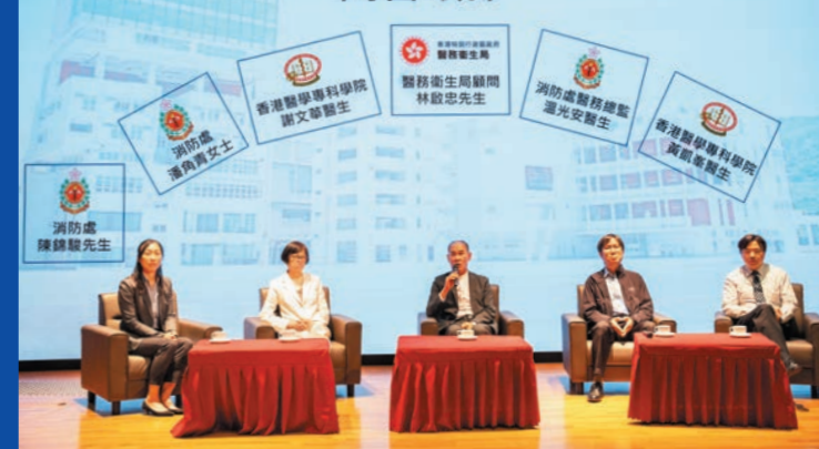
▲部門為前線救護人員舉辦《維持生命治療的預作決定條例》培訓講座。