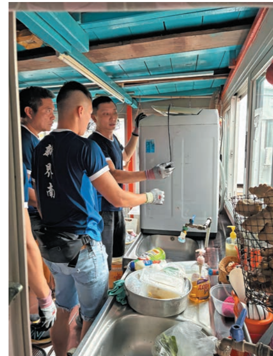
▲大澳消防局的休班人員協助居民將電器搬至安全位置，減少意外發生和財產損失。

「樺加沙」襲港期間，部門接獲報告指港島有大型構築物在強風中飛脫並擊中大廈外牆煤氣喉管，造成氣體洩漏。高空拯救專隊迅速趕赴現場作出風險評估後，使用進階繩索技術固定構築物，並協助煤氣公司人員處理氣體洩漏。