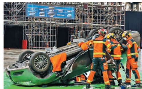
▲部門代表團參加第八屆新加坡國際消防與救護挑戰賽。圖示團隊合作進行爆破程序，模擬拯救被困車內人士。