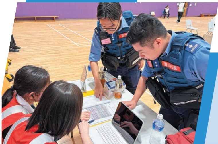
▲部門快速應變隊與醫院管理局人員於比賽場地緊密合作。