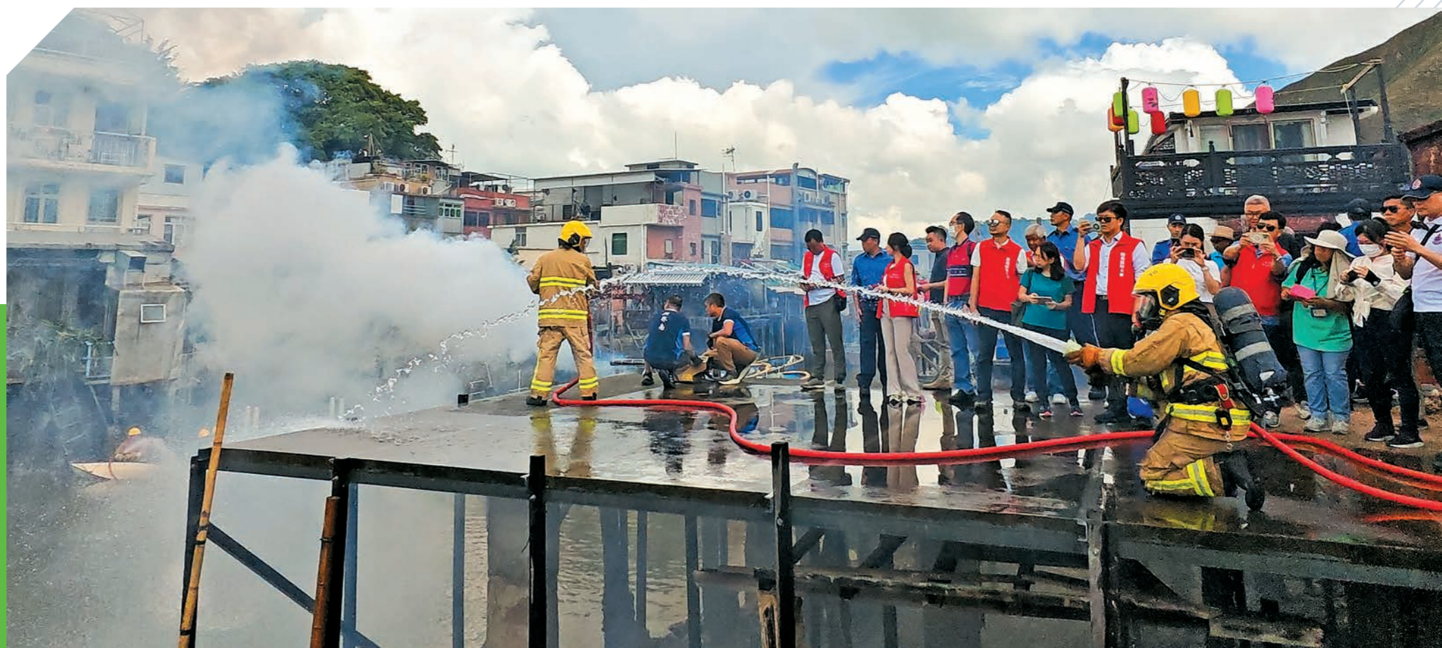
▲去年十月十三日，部門聯同離島區防火委員會及關愛隊在大澳舉行跨部門大澳棚屋火警演習暨社區防火宣傳活動。