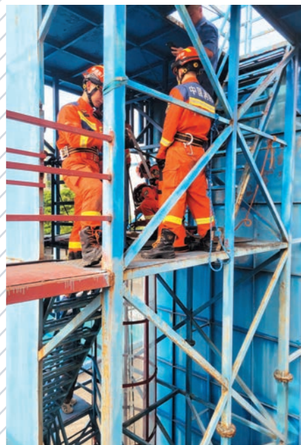
▲大灣區消防同業進行密閉空間救援演練示範。

理可燃液體火災時如何有效應用泡沫，包括氟蛋白泡沫和抗酒精泡沫。隊員亦參觀了密閉空間救援演練，演練中使用透明塑膠管模擬溝渠結構，以便隊員更好地觀察技術細節。