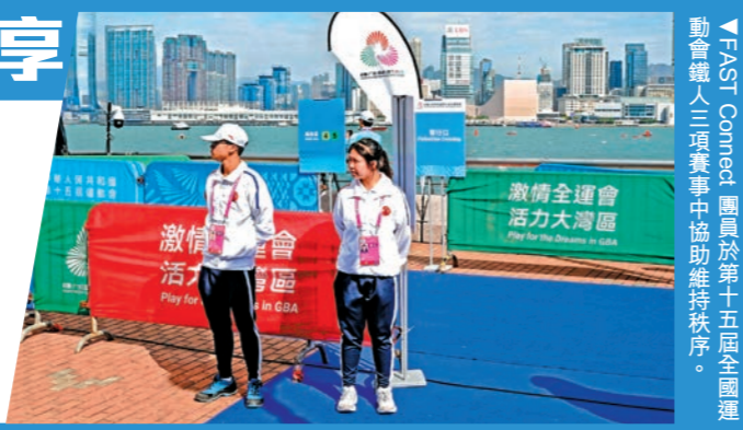
▲FAST Connect 團員於第十五屆全運會鐵人三項賽事中協助維持秩序。