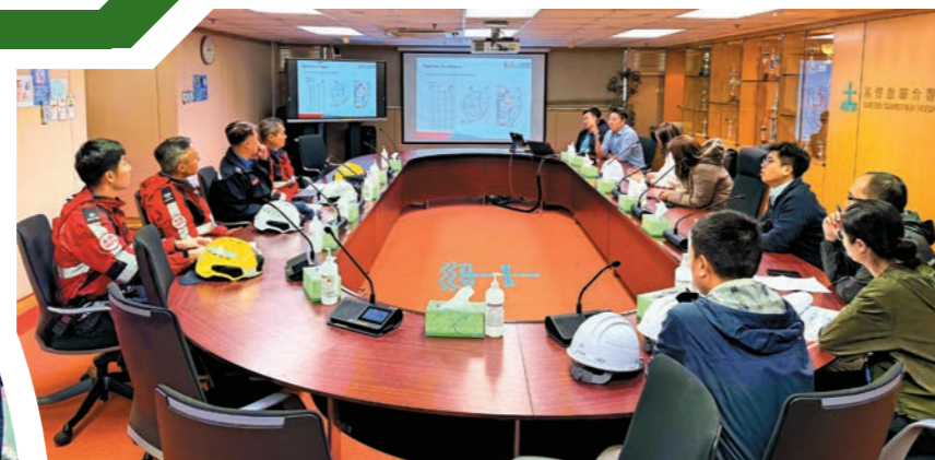
▲去年十一月十九日，部門到觀塘聯合醫院進行消防安全宣傳及巡查。圖示醫院職員向消防人員報告醫院地盤設置的防火措施。