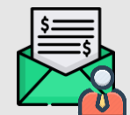
僱主強積金供款記錄