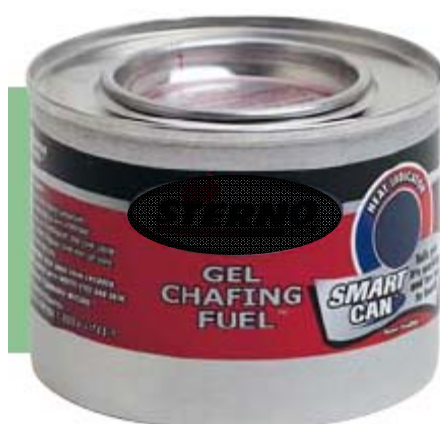
盛載啫哩狀燃料的無縫容器／爐具樣本