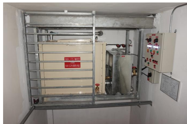
500 公升供水缸安裝於 天台樓梯內部