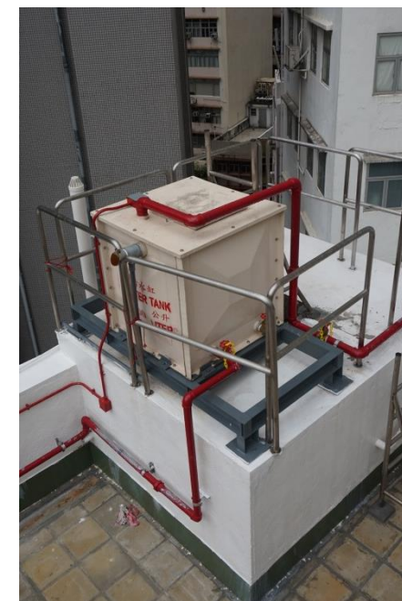
500 公升供水缸安裝於天台