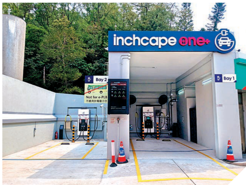
▲蒲崗村道油電站是全港首個增設電動車充電設施的油站。

▶部門聯同香港海關及警務處於二月十三日展開代號「截流」的聯合行動，成功搗破兩個非法加油站。圖示執法人員在行動中蒐集證據。