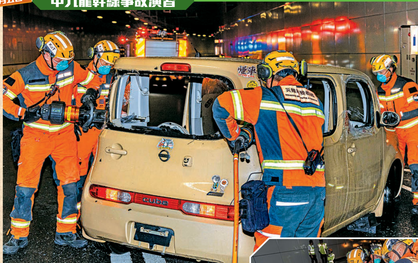
消防處聯同路政署及隧道管理公司在中九龍幹線(油麻地段)舉行交通事故演習。圖示災難應變救援隊員進行車輛爆破，拯救被困車內人士。