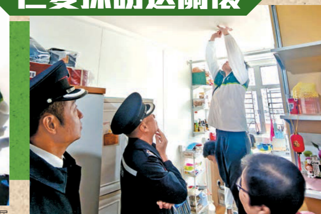
▲消防人員為長者安裝獨立火警偵測器。