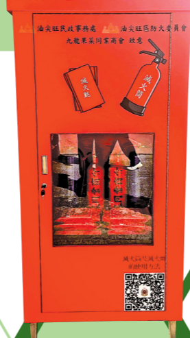
▲部門與九龍果菜同業商會在油麻地果欄開設「應急滅火櫃」，內置滅火筒及滅火氈。

二月十一日，部門聯同油尖旺民政事務處、油尖旺區防火委員會及九龍果菜同業商會在油麻地果欄開設兩個「應急滅火櫃」，內置滅火筒及滅火氈，讓果欄從業員遇上火警時能及時取用，以大幅降低火警傷亡風險。