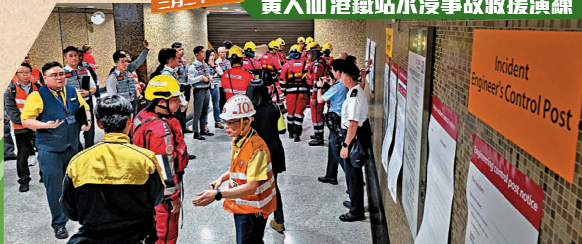
演練由消防處聯同警務處、機電工程署和香港鐵路有限公司舉辦。圖示參與演習人員在跨部門行動指揮站商討救援安排。