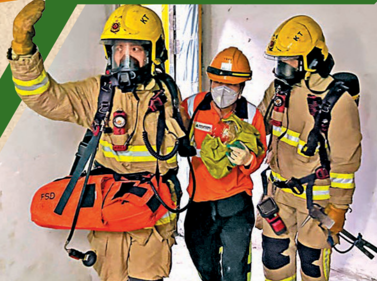
消防處聯同基督教聯合醫院舉行演習，模擬醫院建築地盤發生火警。圖示消防人員協助地盤工人撤離現場。