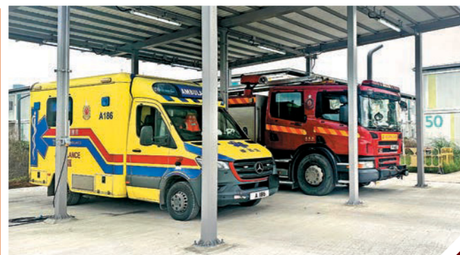
▲落馬洲河套區消防處臨時派駐點投入服務。

隨着落馬洲河套區的港深創新及科技園開園，區內陸續有不同項目落成，為應對該區的緊急服務需求，消防處於二月一日正式啓用落馬洲河套區臨時派駐點。