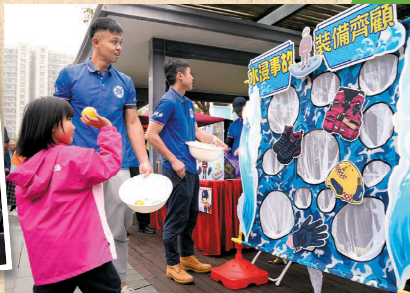
▲市民透過攤位遊戲學習防災應急知識。