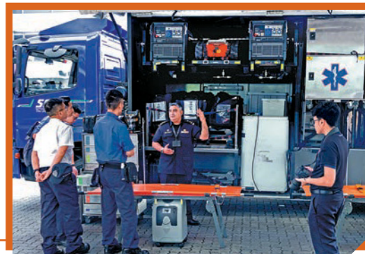
救護人員參觀新加坡民防部隊的醫療支援車輛。

是次交流不僅加強兩地在專業技術與學術層面的互動，亦為未來在輔助醫療領域的合作與創新奠下穩固基礎。