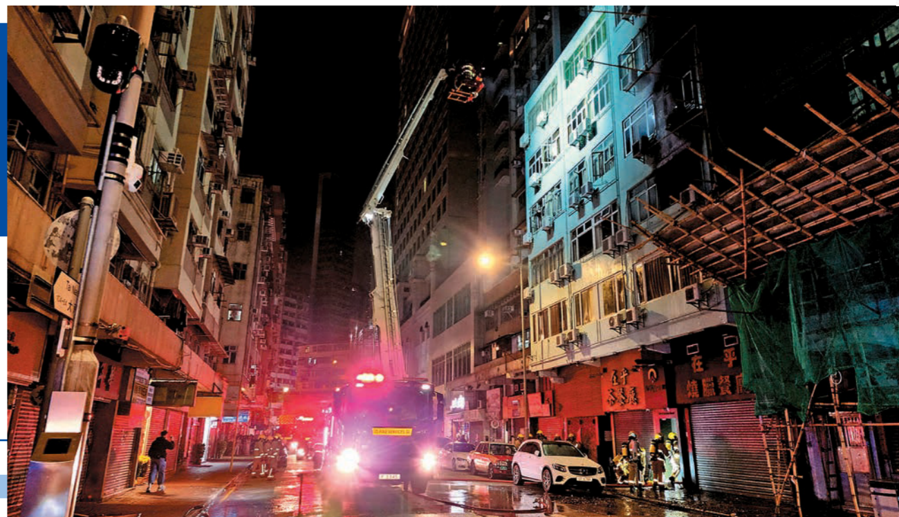
▲旺角大南街一個住宅單位發生火警，消防人員進行滅火救援行動。

二月二十五日凌晨，旺角大南街一個住宅單位發生火警，火勢猛烈。消防人員到場後隨即在最近的消防栓取水，並迅速於約半小時後完成滅火救援行動，搜救隊亦確認沒有人被困。事件中，共有33人疏散到安全位置，八名居民因吸入濃煙不適送院。事後，消防處滅火訓練專隊的成員與參與行動的消防人員舉行研討會，透過影片提供深層技術分析，讓前線人員對滅火技術運用和細節有更深刻的理解。