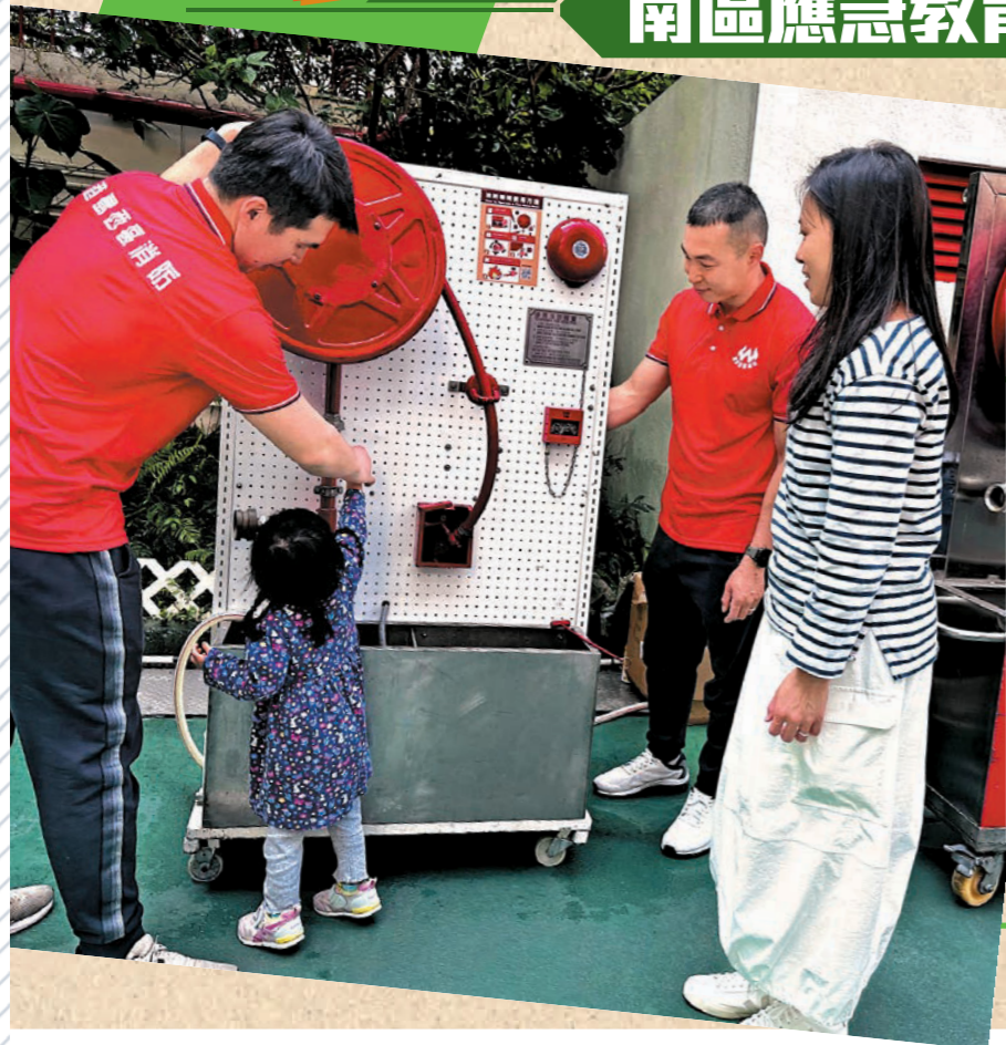
▲活動由消防處聯同南區民政事務處和南區防火委員會舉辦。圖示消防人員教導市民正確使用消防喉轆的四個步驟「破、轉、拉、射」。