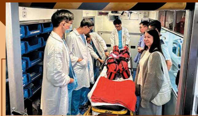
▲北區醫院急症室團隊登上流動傷者治療車，了解如何利用車內手術室進行院前手術。