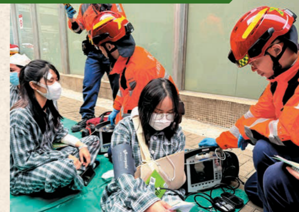
▲救護人員利用「大量傷者事故檢傷分流系統」為傷者分流，並進行初步治理。