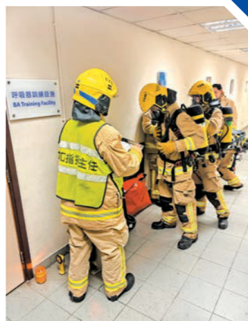
▲消防人員於「活動式間隔系統」進行呼吸器訓練。

部門第二個「活動式間隔系統」將於今年第二季在港島總區的薄扶林消防局落成。部門亦正積極籌備於新界南總區的竹篙灣消防局、新界北總區的元朗消防局，以及九龍總區的調景嶺消防局興建「活動式間隔系統」，讓消防人員可在屬區或鄰近地點接受訓練，大幅提升便利性和訓練參與度。