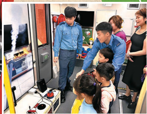
▲市民學習如何選擇和操作滅火筒，應對不同類型的火警。