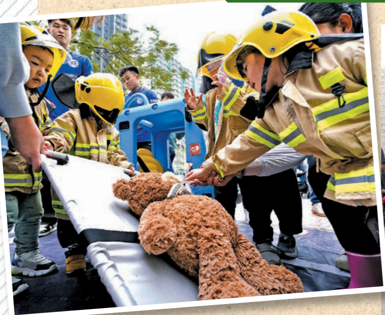
▲活動由消防處聯同東區民政事務處和東區防火委員會舉辦。圖示市民模擬體驗公路及鐵路拯救專隊的工作。