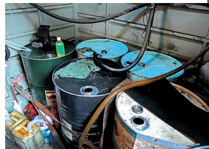
◀部門聯同香港海關及警務處於二月十三日展開代號「截流」的聯合行動，成功搗破兩個非法加油站。圖示行動中檢獲的證物。

在跨部門和界別協作方面，部門不但透過「打擊非法燃油轉注活動策略小組」定期與相關部門及石油行業代表舉行會議，加強信息共享和協調，從源頭堵截非法燃油供應，更積極進行跨