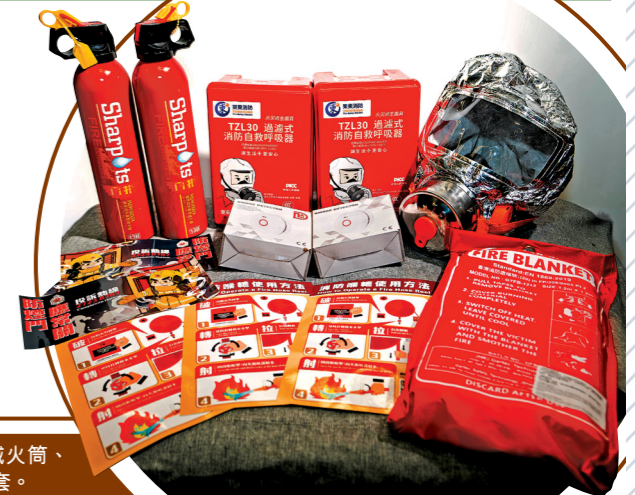
▶「防災應急包」包括現有「防火三寶」的滅火筒、滅火氈和獨立火警偵測器，以及新增的防煙頭套。

部門一向致力於社區推廣消防安全信息，當中包括「防火三寶」（即滅火筒、滅火氈及獨立火警偵測器）的重要性。部門去年向市民派發3,000套「防火三寶」，並於今年起新增防煙頭套，將「防火三寶」升級為「防災應急包」，至今已向18區消防處社區聯動網絡提供共5,400套，即每區300套，讓地區人士向市民派發，以提升市民遇上初期火災的預警和自救能力。