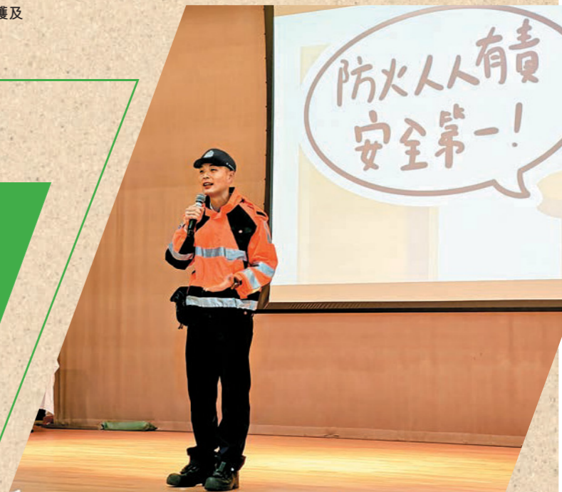
▲救護人員分享燒燙傷個案及急救處理方法。