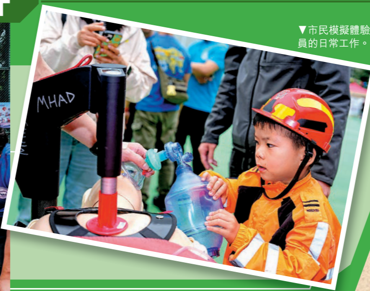
▼市民模擬體驗救護人員的日常工作。