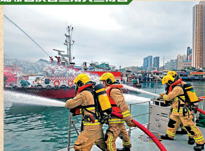
消防處聯同警務處和海事處在筲箕灣避風塘舉行演習。圖示消防人員向起火船隻射水。