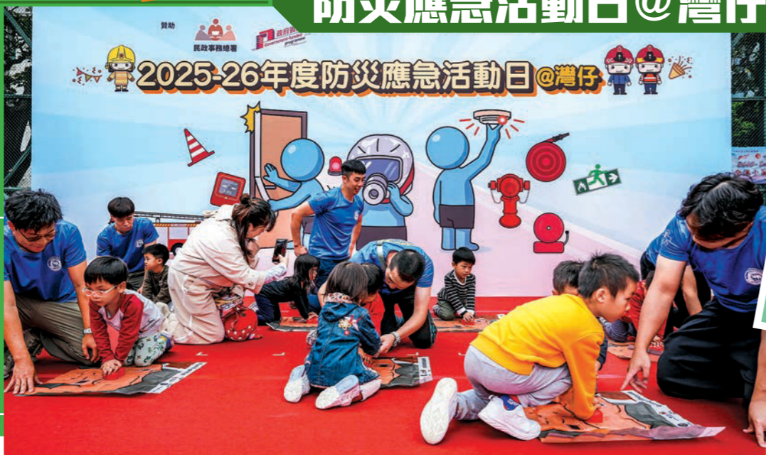
▶活動由消防處聯同灣仔民政事務處和灣仔區防火委員會舉辦。圖示市民學習施行心肺復甦法。