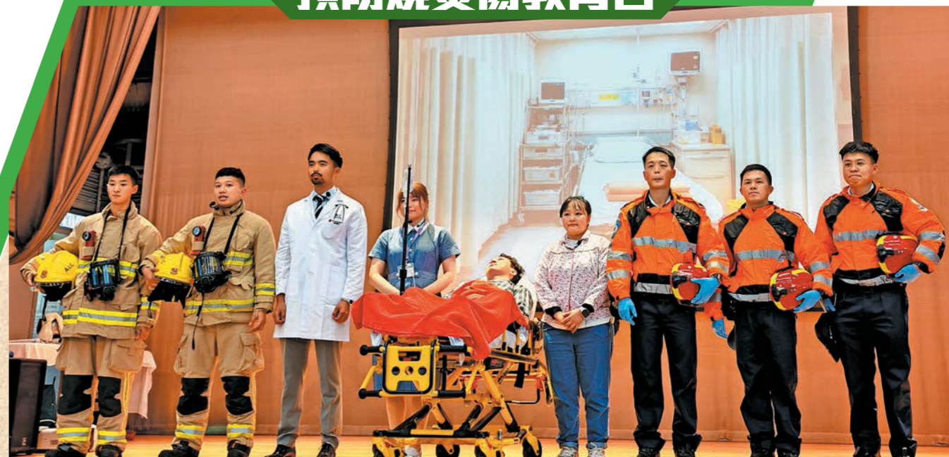
▲活動由消防處和瑪麗醫院燒傷中心聯合舉辦。圖示消防、救護及醫護人員合力演出模擬家居煮食引發火警的情景話劇。