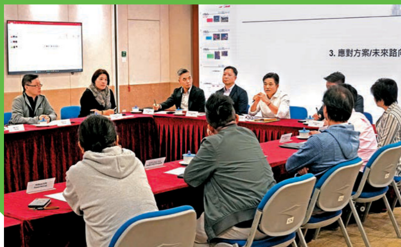
▲消防處與相關政府部門及石油行業代表舉行會議，探討非法燃油轉注活動的情報及在源頭堵截燃油供應的防控策略。

部門聯合行動，提升執法效率。部門聯同香港海關及警務處於二月十三至十五日展開代號「截流」的聯合行動，特別針對市區內的非法燃油轉注黑點作重點打擊，成功搗破四個非法加油站，檢獲約1,180公升未完稅汽油及4,780公升柴油，並對涉案人士提出檢控，充分展現政府嚴厲打擊非法燃油活動的堅定決心。