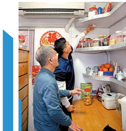
▲消防人員上門探訪居民，並為居民安裝獨立火警偵測器。