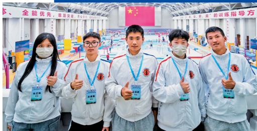
▲消防及救護青年團團員獲安排觀看國家體操隊訓練。