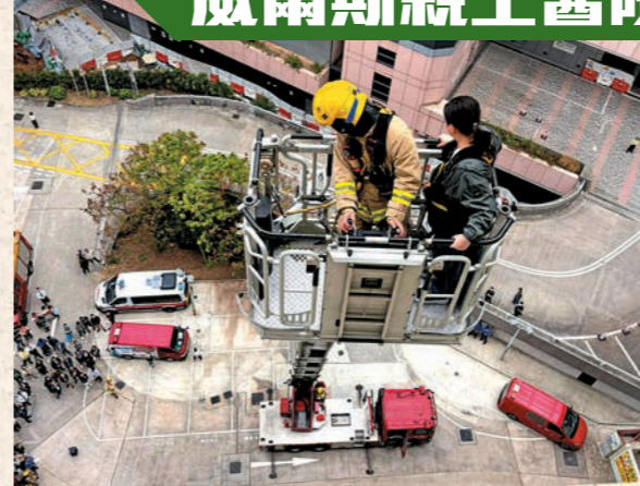
▲演習由消防處聯同醫院管理局和警務處舉辦。圖示消防人員使用鋼梯救出行動不便的傷者。