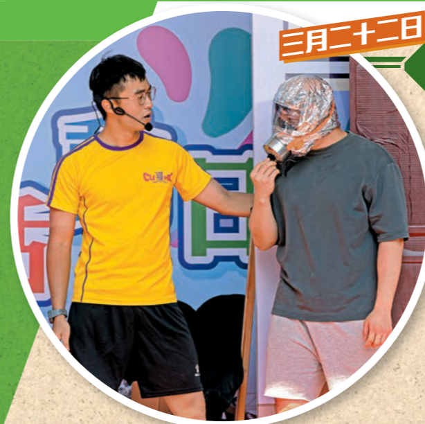
▲活動由消防處聯同九龍城民政事務處和九龍城區防火委員會舉辦。圖示消防人員透過防火話劇向市民推廣防煙頭套。