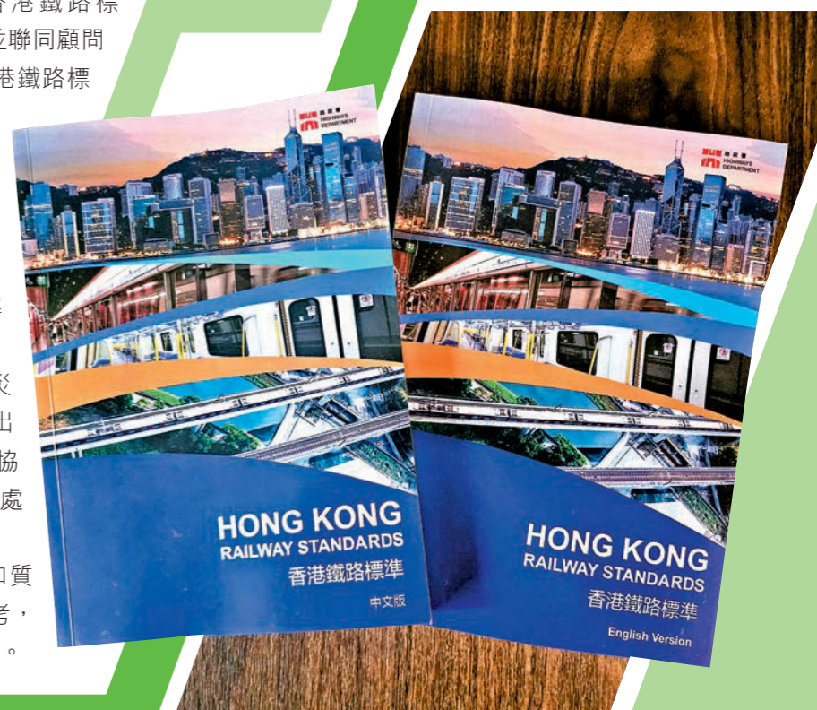
▼《香港鐵路標準》正式公布，以加快新鐵路項目的推展步伐。

消防處協力提升鐵路建設的效率和質素，期望新標準能成為大灣區的共同參考，同時鞏固香港在鐵路建設領域的重要地位。