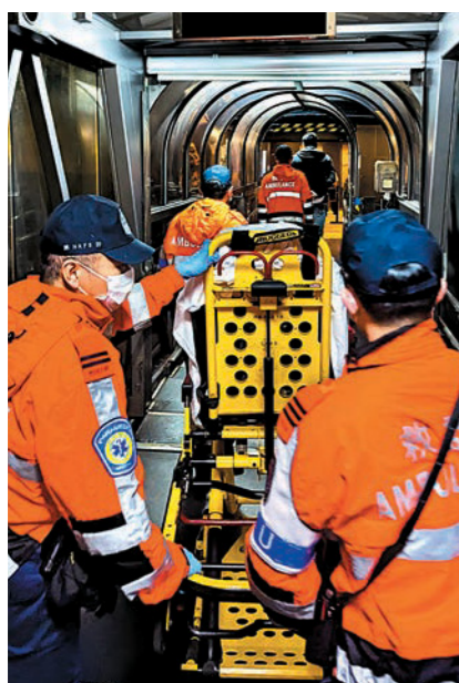
▲疫情控制及應變專隊和特別支援隊人員抵達啟德郵輪碼頭，協助處理疑似感染諾如病毒個案。