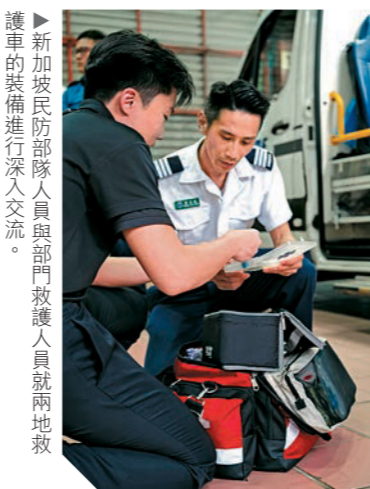
新加坡民防部隊人員與部門救護人員就兩地救護車的裝備進行深入交流。

這個認證測評，不但對救援隊的整體能力作出公信力的評估，亦是受災國接受救援隊伍展開行動的重要參考和依據。目前，全球共有61支救援隊通過認證測評，每支隊伍須每五年完成一次複測，以確保各方面的能力和水平均與時並進，緊貼國際標準。