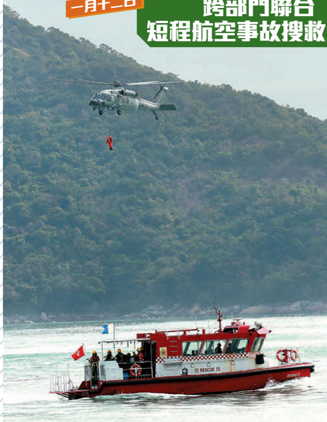
消防處參與民航處統籌的搜救演練，模擬一架直升機於大嶼山望東灣附近失事墜海。圖示消防處潛水支援快艇和政府飛行服務隊直升機協同運送傷者。