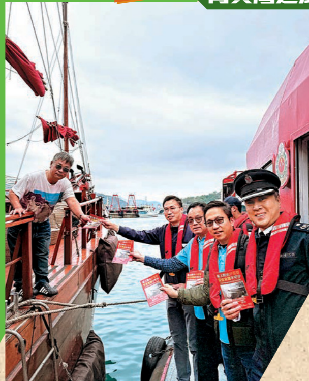
消防處聯同東區民政事務處及東區防火委員會舉行防火宣傳日。圖示參與人員向船家宣傳消防安全信息。