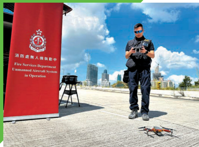
▲部門引入無人機輔助巡邏，針對隱蔽黑點進行偵察。