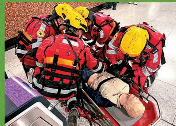
消防人員為傷者進行初步治理。