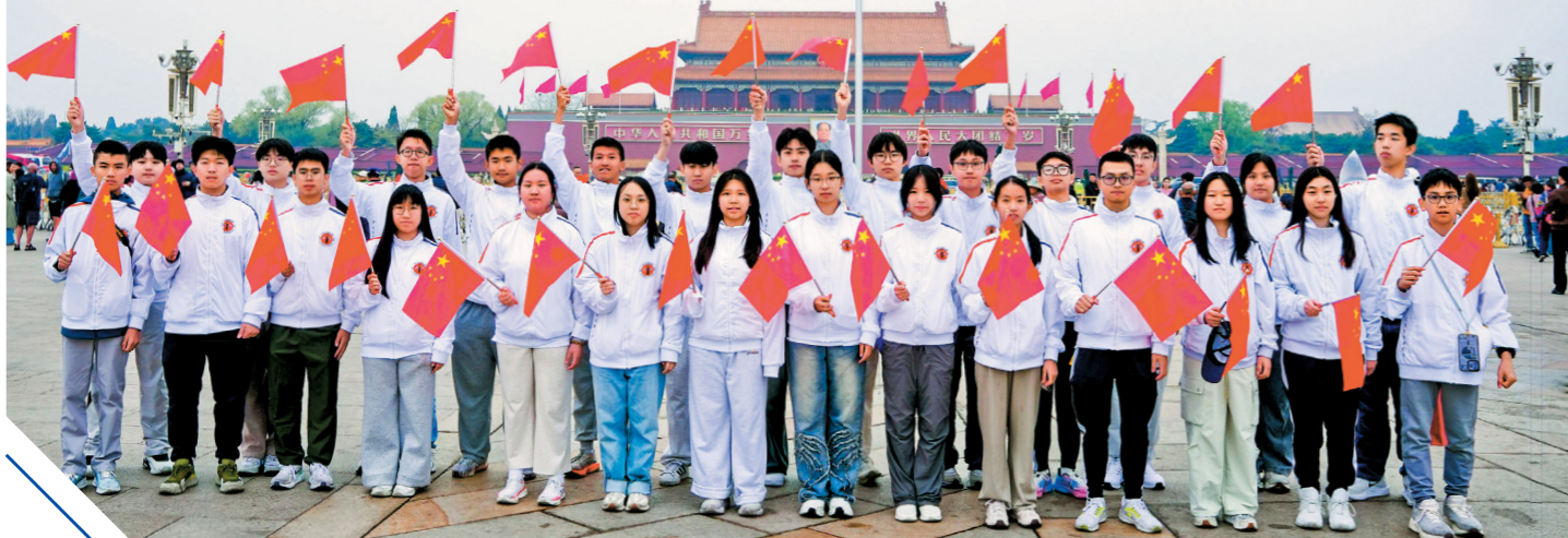
▲消防及救護青年團團員於天安門廣場觀看升旗儀式。

隨後，團員獲安排參觀北京多個名勝地標，包括萬里長城、故宮和人民大會堂，並到天安門廣場觀看升旗儀式；拜訪國家體育總局，觀摩國家跳水隊和體操隊訓練；參觀中央美術學院和北京電影學院，認識國家藝術教育和影視製作。團員透過實地交流和參訪，親身體驗城市運作，探索國家發展足跡。