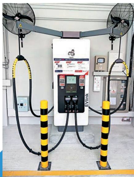
◀蒲崗村道油電站設有高速充電樁，供電動車使用。

危險品管制課會繼續與業界保持緊密溝通，不時檢討及更新相關指引，並在不影響安全前提下盡量加快審批工作，於審批過程中因應實際運作情況作出評估及發出適切指引，配合推動綠色能源及零碳交通發展，同時進一步保障市民安全。