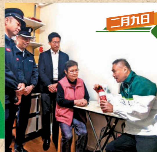
▲消防處聯同仁愛堂社區義工探訪屯門青福里簡約公屋居民。圖示消防人員向長者講解滅火筒的使用方法。