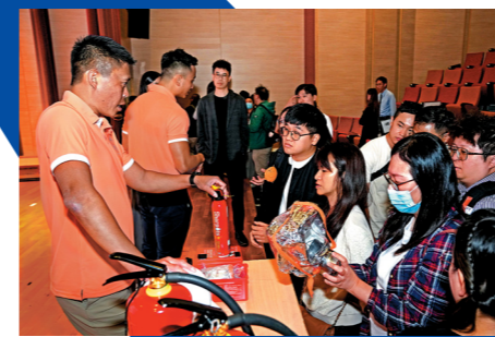
▲消防人員向「樓宇應急先鋒」計劃培訓課程學員介紹各種滅火工具。