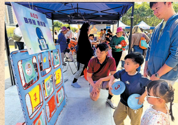
▲市民透過攤位遊戲學習防災應急知識。