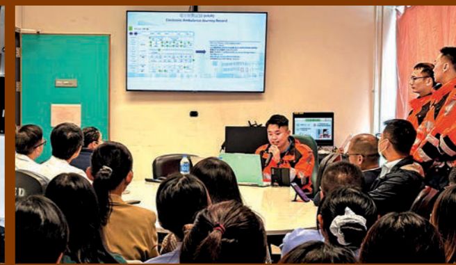
▲救護人員向北區醫院急症室團隊介紹救護服務的行動指引及運作程序。