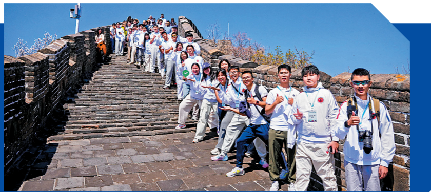
▲消防及救護青年團團員登上萬里長城。