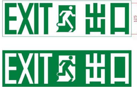
圖 2 – 結合圖形符號及文字的出口指示牌